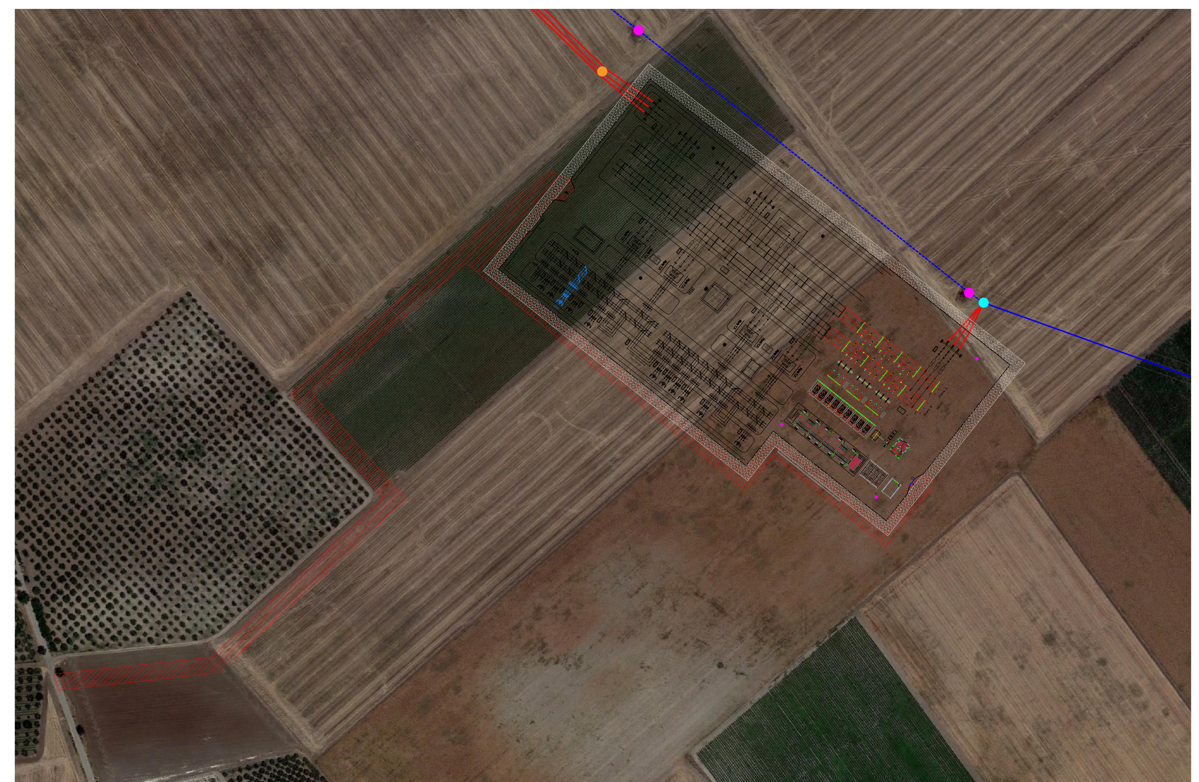
PLANIMETRIA DI INQUADRAMENTO SU ORTOFOTO