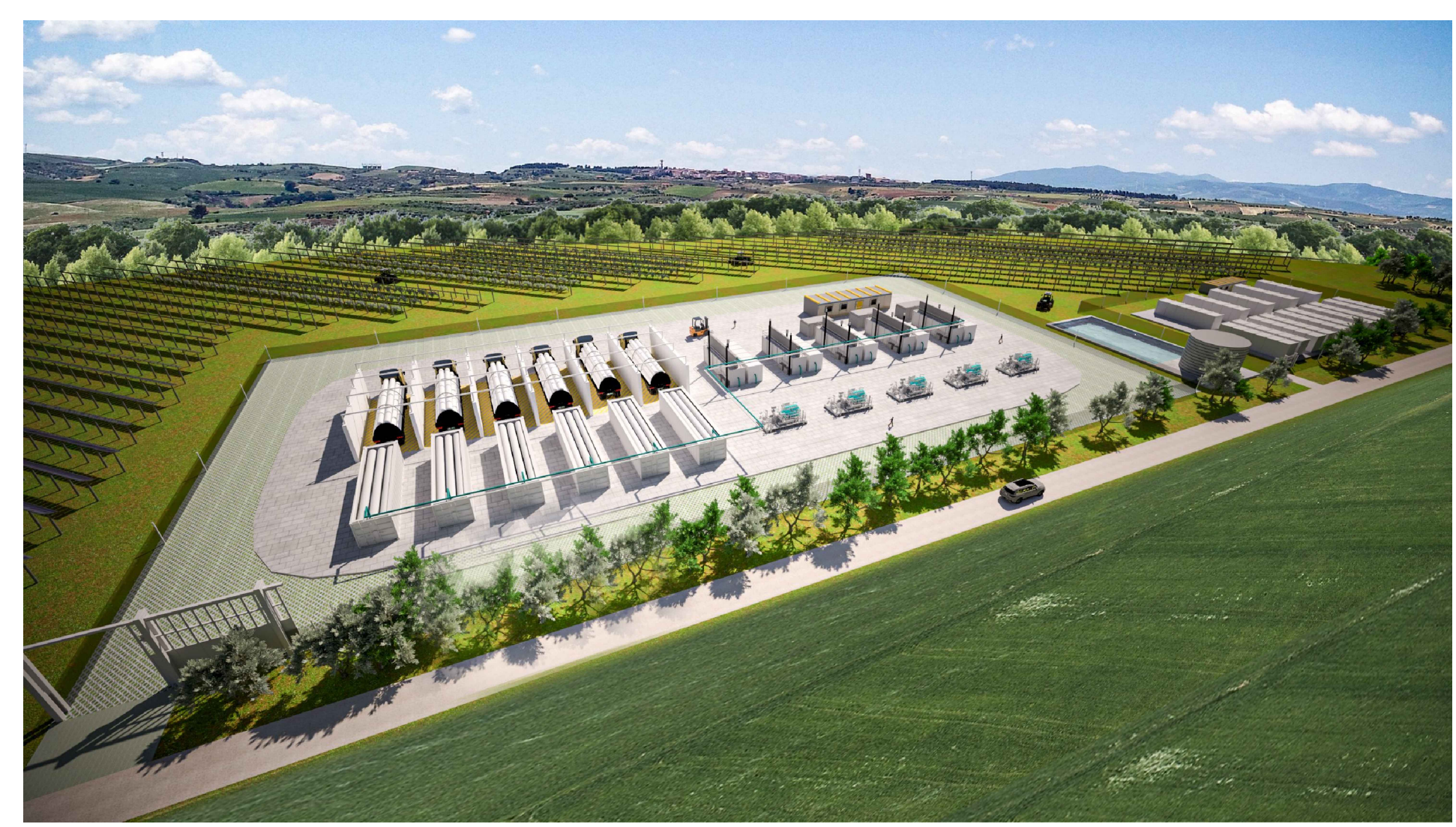
Fotoinserimento direttrice E-O