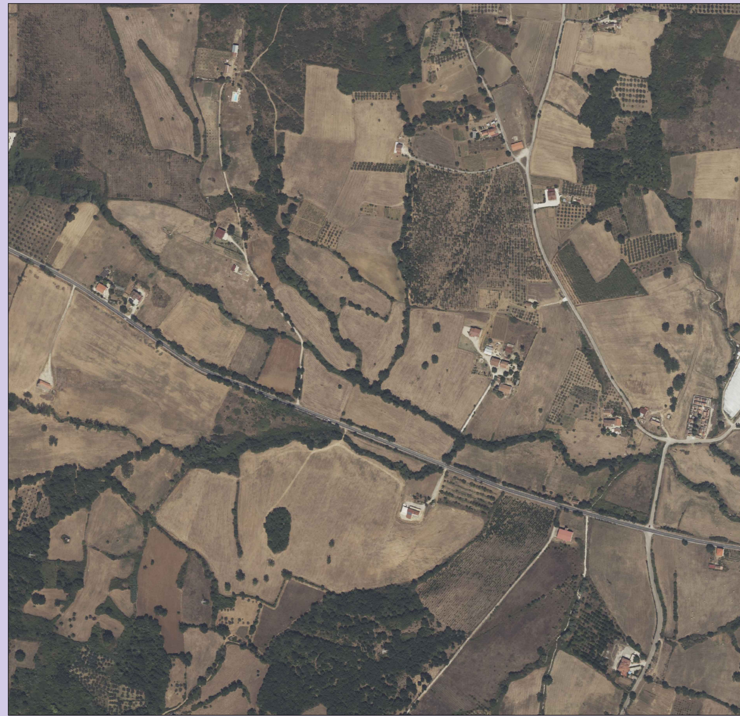
Tav.42.3 - A