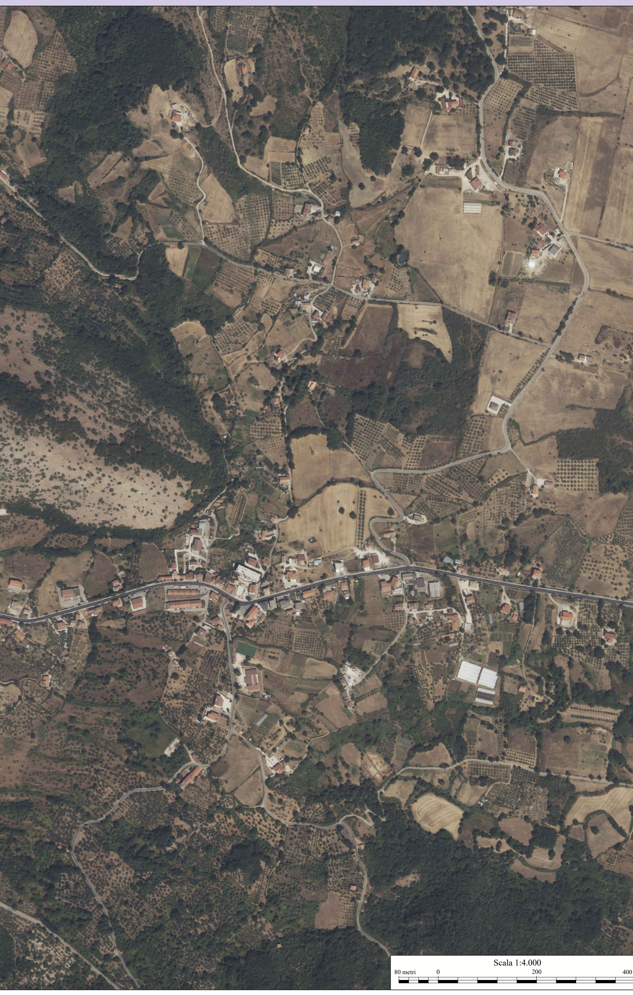
Tav.48.3 - A