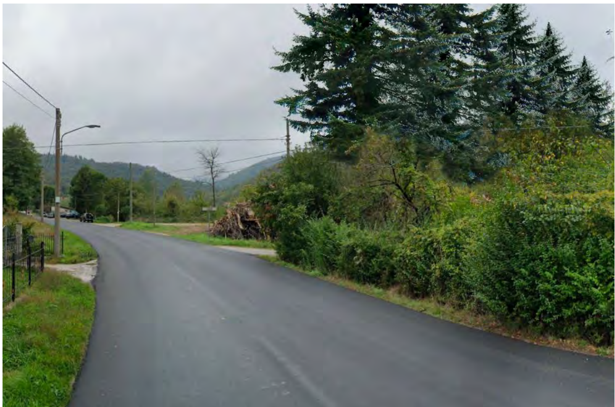
Figura 4: punto di vista 2 (Post Operam).