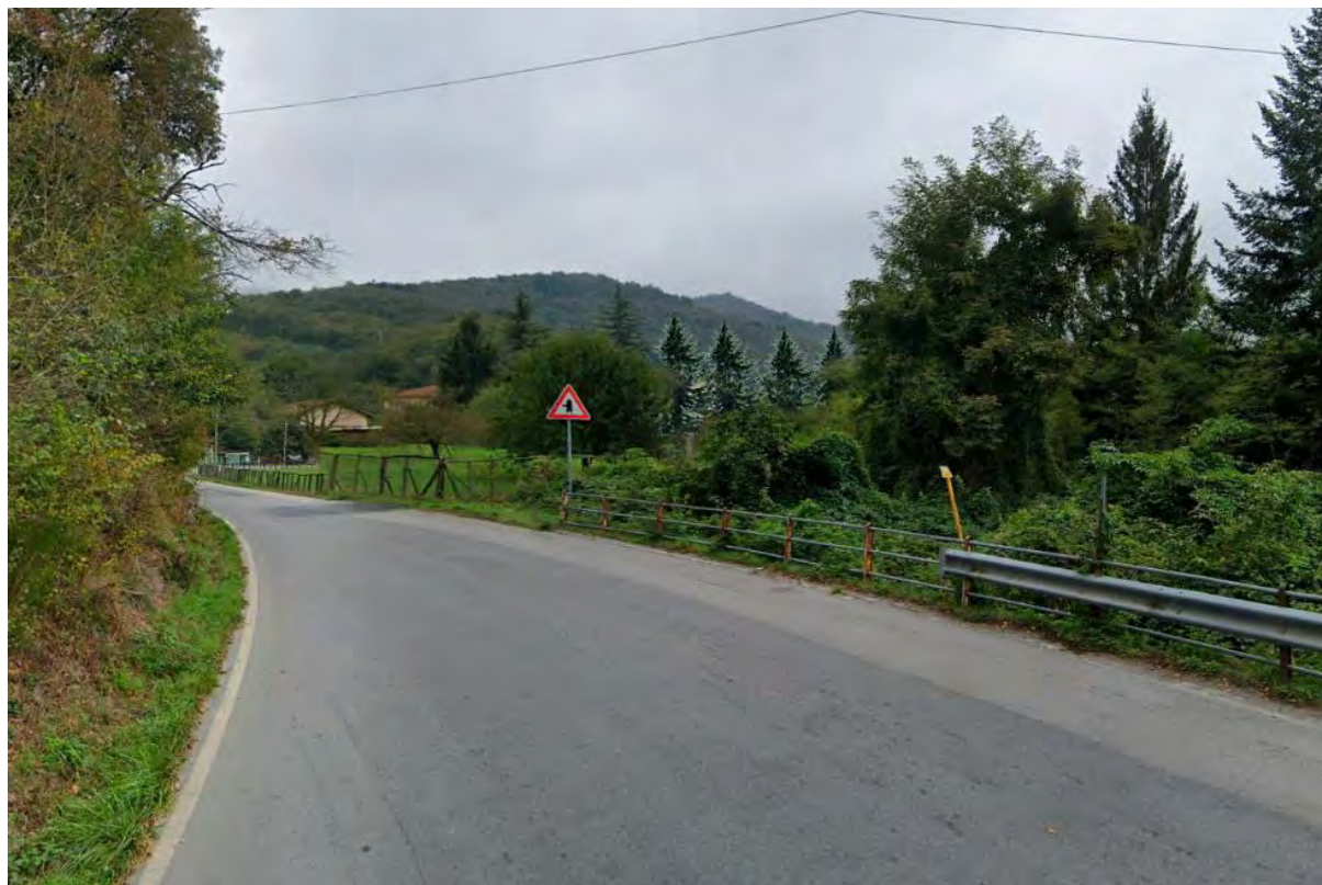
Figura 6: punto di vista 3 (Post Operam).