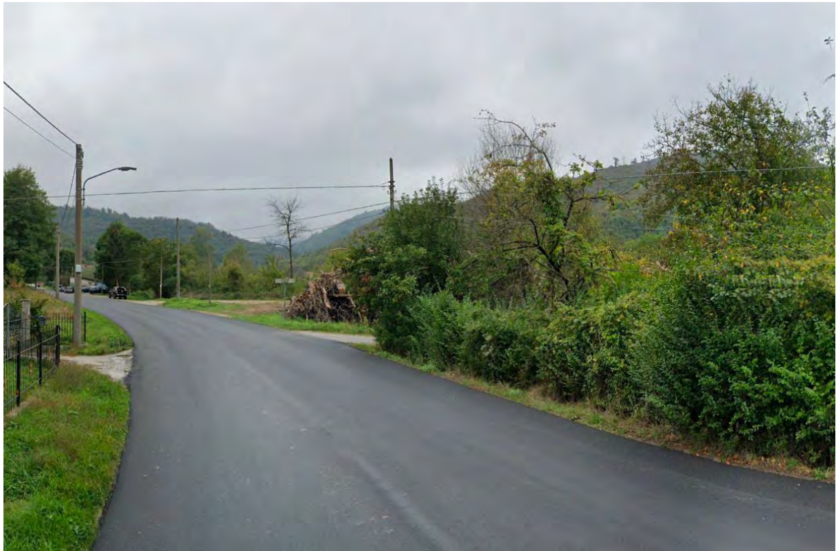
Figura 3: punto di vista 2 (Ante Operam).