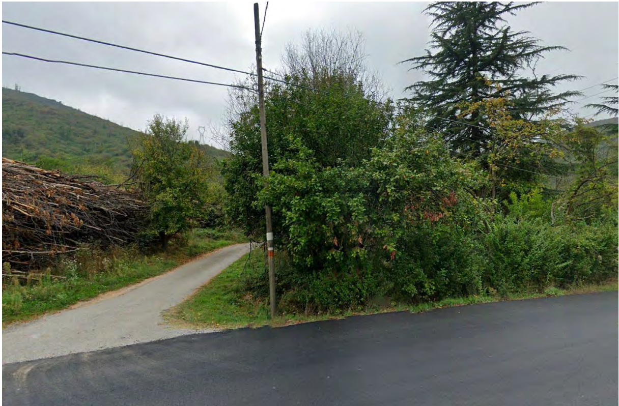
Figura 7: punto di vista 4 (Ante Operam).

REALIZZAZIONE IMPIANTO EOLICO "CRAVAREZZA" COMUNI CALICE LIGURE MALLARE ORCO FEGLINO E ALTARE (SV) PROGETTO DEFINITIVO