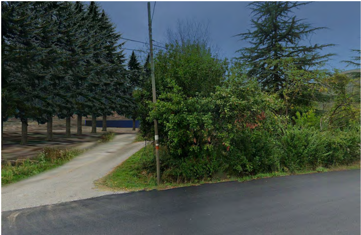
Figura 8: punto di vista 4 (Post Operam).