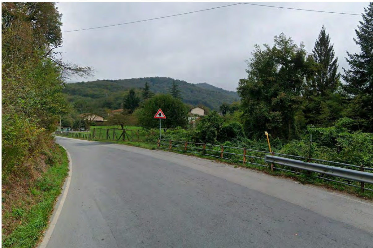
Figura 5: punto di vista 3 (Ante Operam).

REALIZZAZIONE IMPIANTO EOLICO "CRAVAREZZA" COMUNI CALICE LIGURE MALLARE ORCO FEGLINO E ALTARE (SV) PROGETTO DEFINITIVO