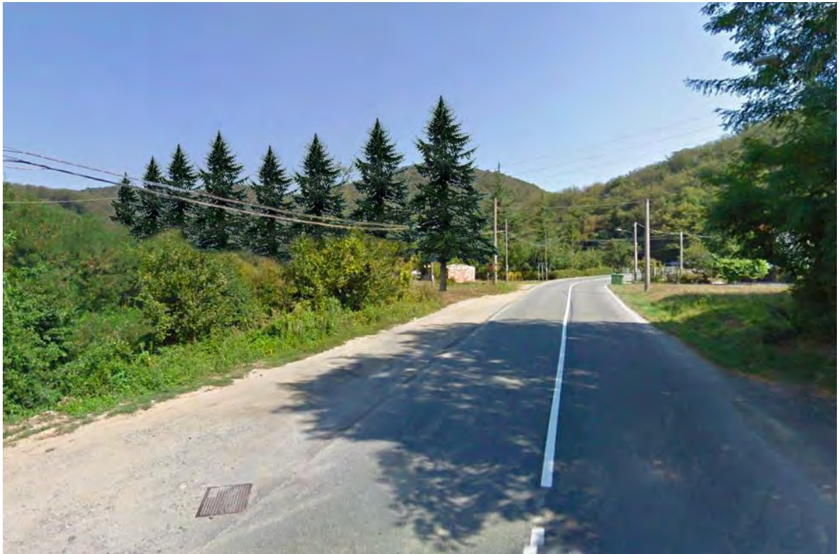
Figura 2: punto di vista 1 (Post Operam).