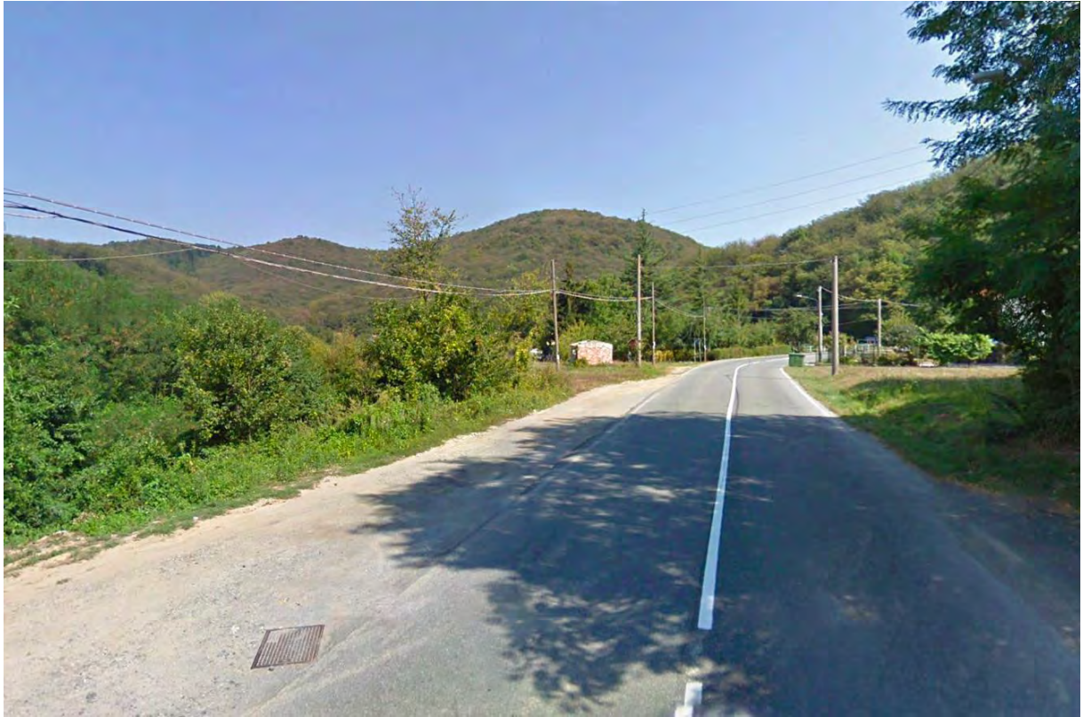
Figura 1: punto di vista 1 (Ante Operam).

REALIZZAZIONE IMPIANTO EOLICO "CRAVAREZZA" COMUNI CALICE LIGURE MALLARE ORCO FEGLINO E ALTARE (SV) PROGETTO DEFINITIVO