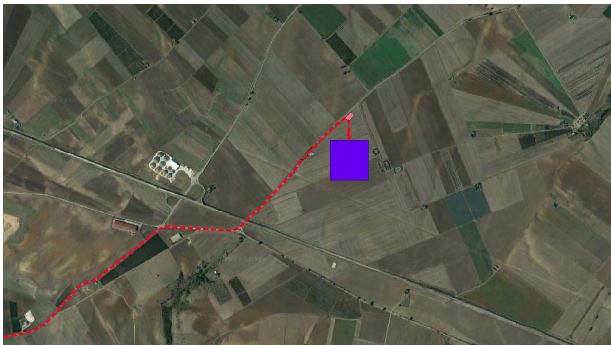
Figura 2 -Ipotesi posizionamento futura SE-Terna (in viola), in rosa posizionamento Stazione di Consegna