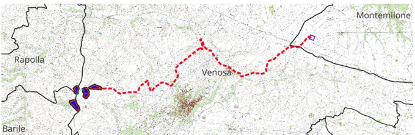
Figura 1 – Inquadramento dell'area di progetto su base CTR.

Per maggiori dettagli sul progetto si rimanda alla lettura degli elaborati tecnici e descrittivi dell'impianto e di quelli relativi agli Studi di Impatto Ambientale.