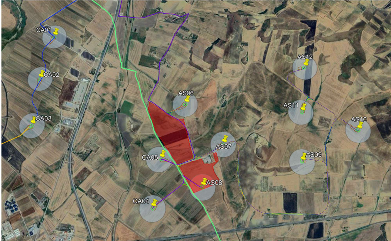
Figura 2 - Sovrapposizione dell'area di impianto della Proponente (in rosso) e posizione degli aerogeneratori della Scrivente

Di seguito, degli stralci in cui si evidenzia l'area individuata per il progetto dell'impianto della Proponente e la posizione degli aerogeneratori presentati in VIA della Scrivente.