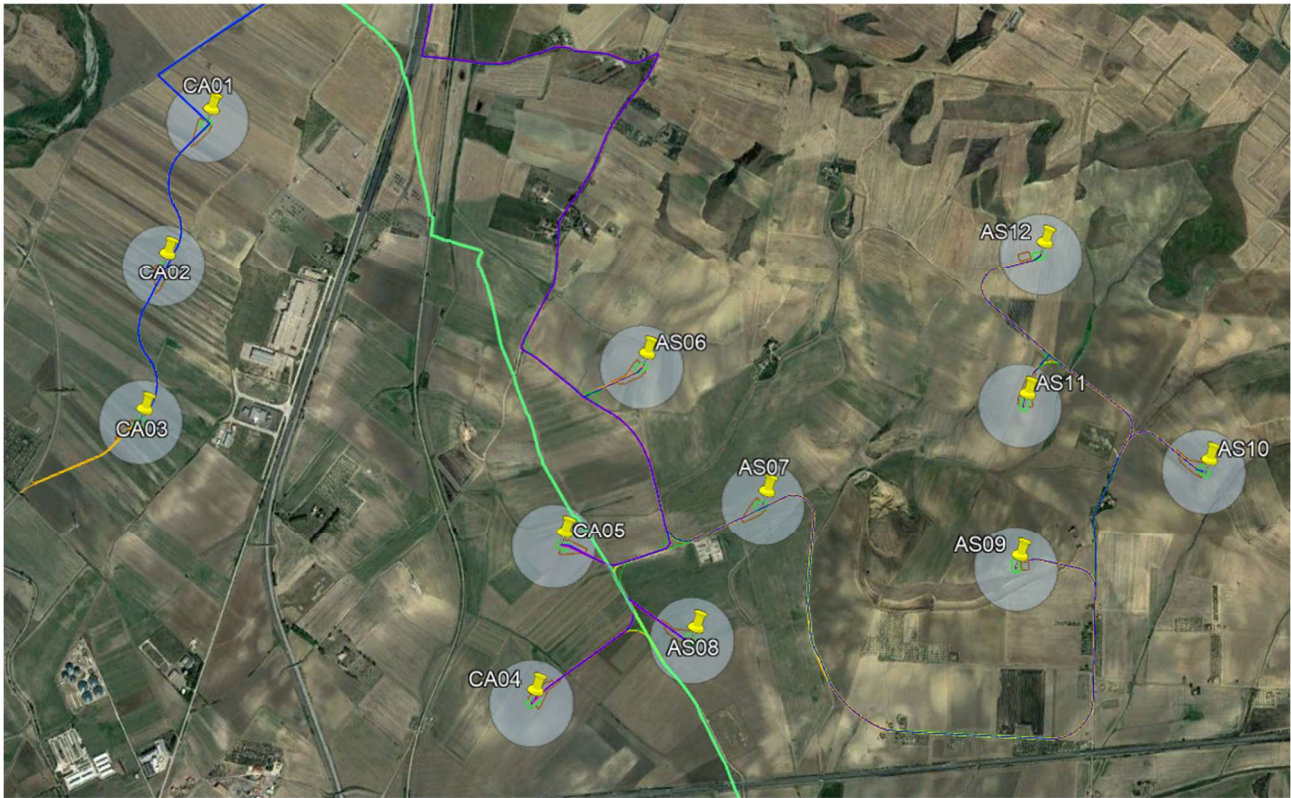
Figura 1 - Ortofoto dell'impianto della scrivente

Di seguito, degli stralci in cui si evidenzia l'area individuata per il progetto dell'impianto della Proponente e la posizione degli aerogeneratori presentati in VIA della Scrivente.