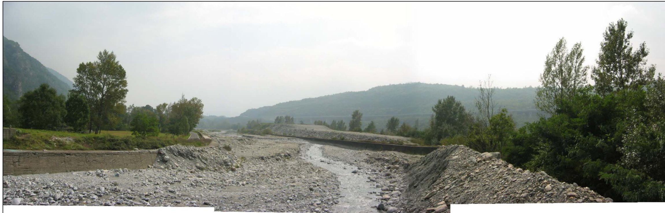
Zona di attraversamento del torrente Cenischia: notare il sovralluvionamento dell'alveo