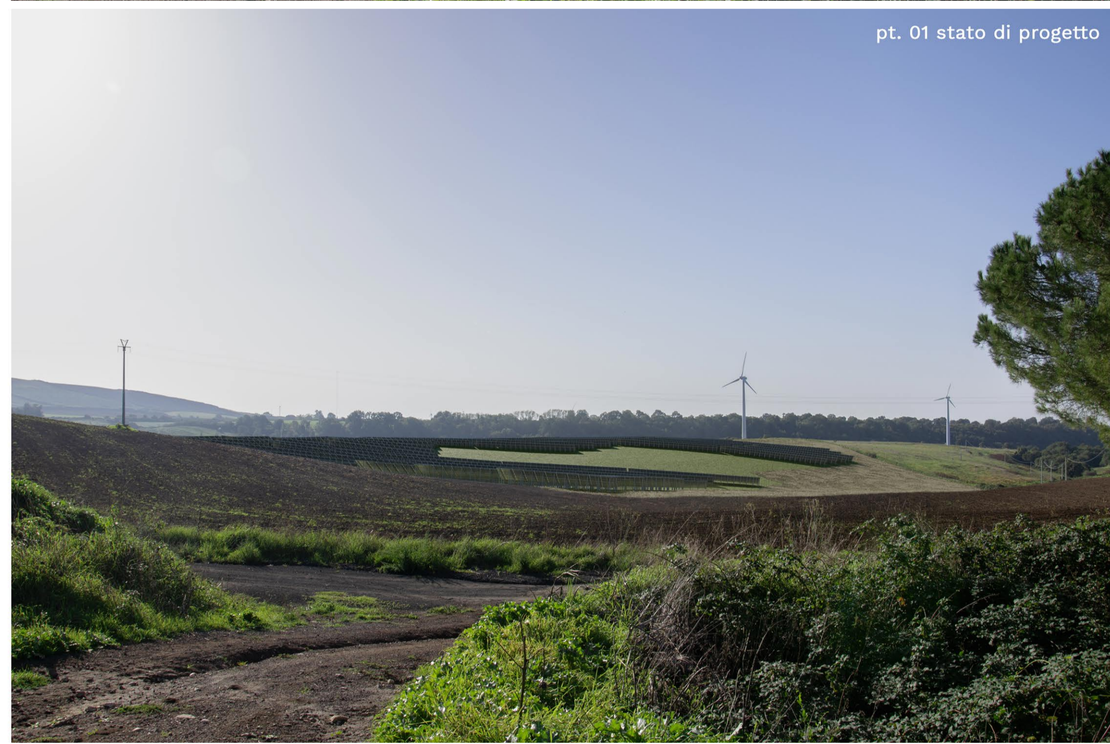
pt. 01 stato di progetto