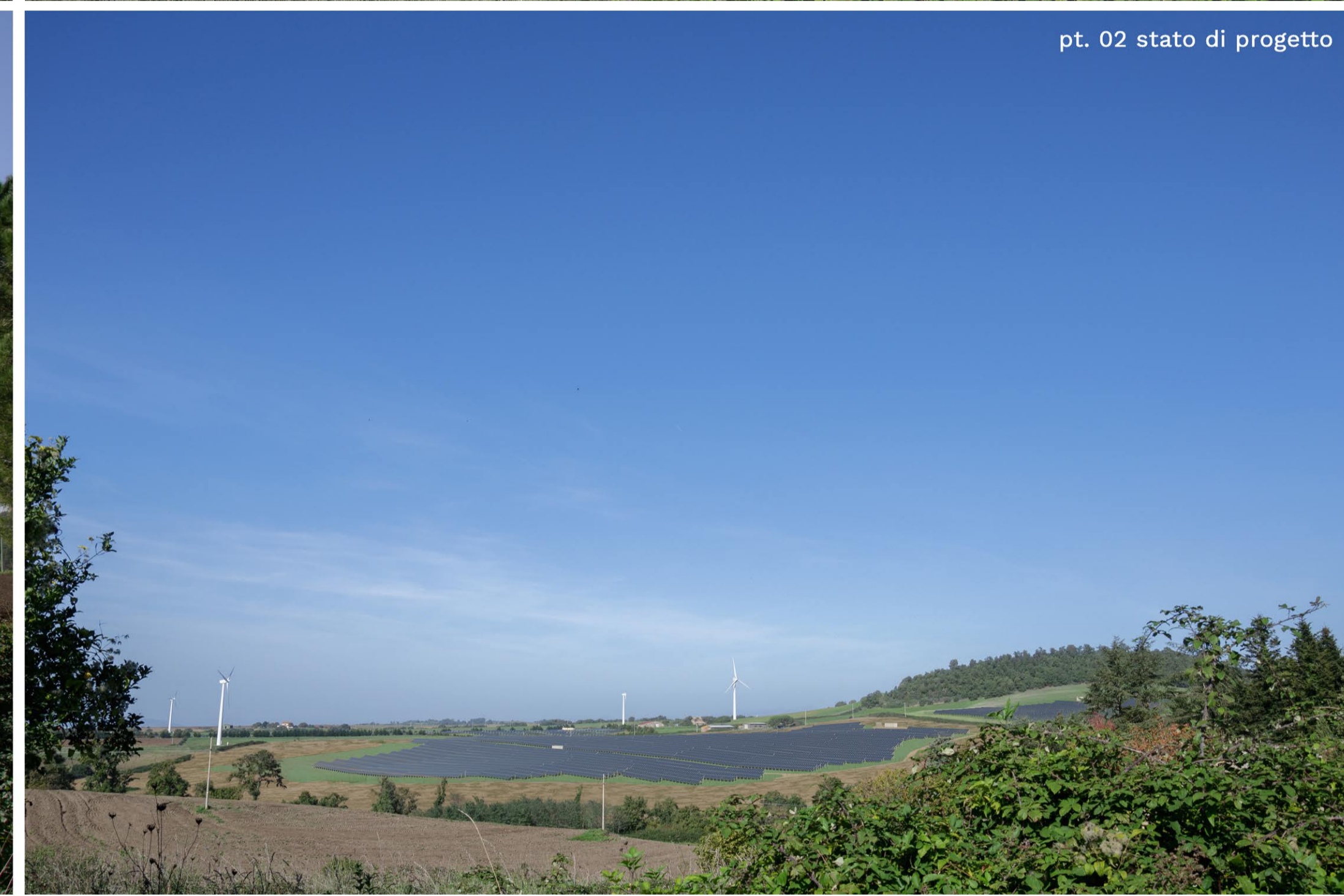
pt. 02 stato di progetto