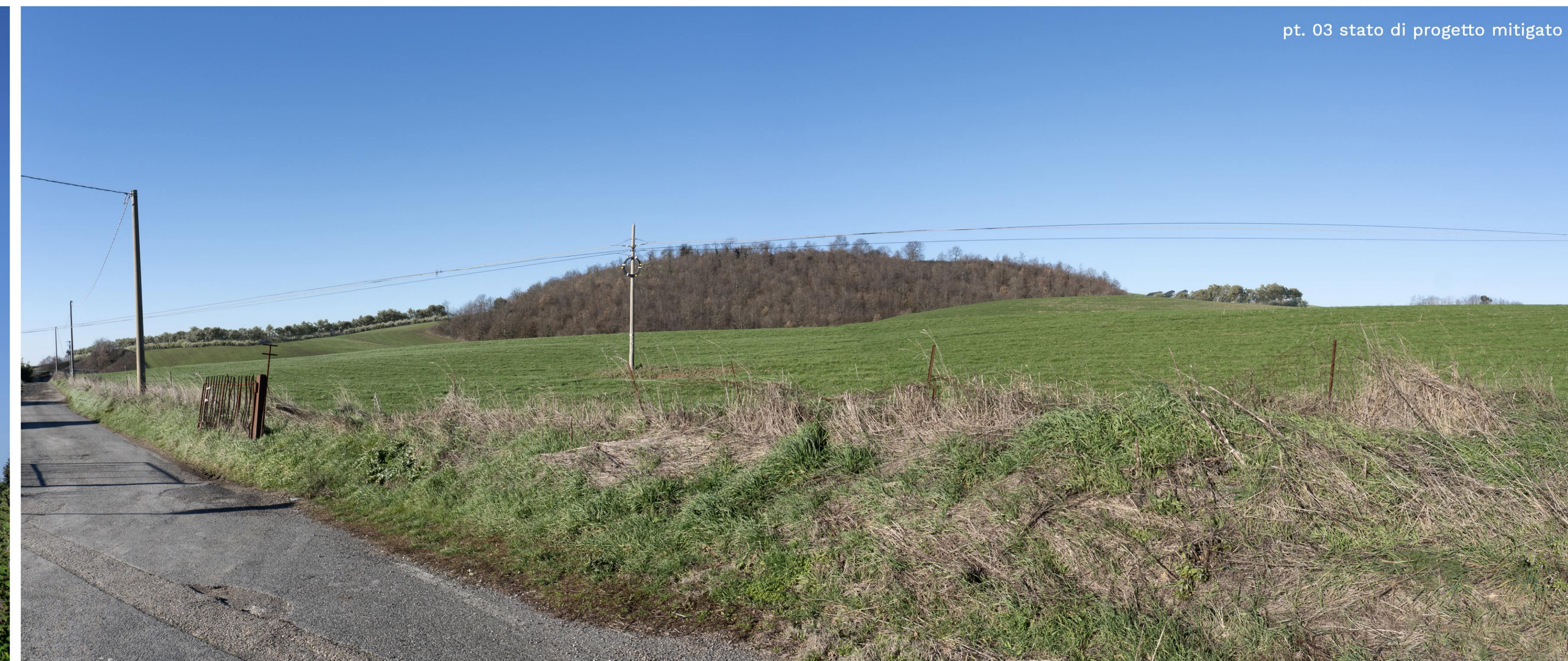
pt. 03 stato di progetto mitigato