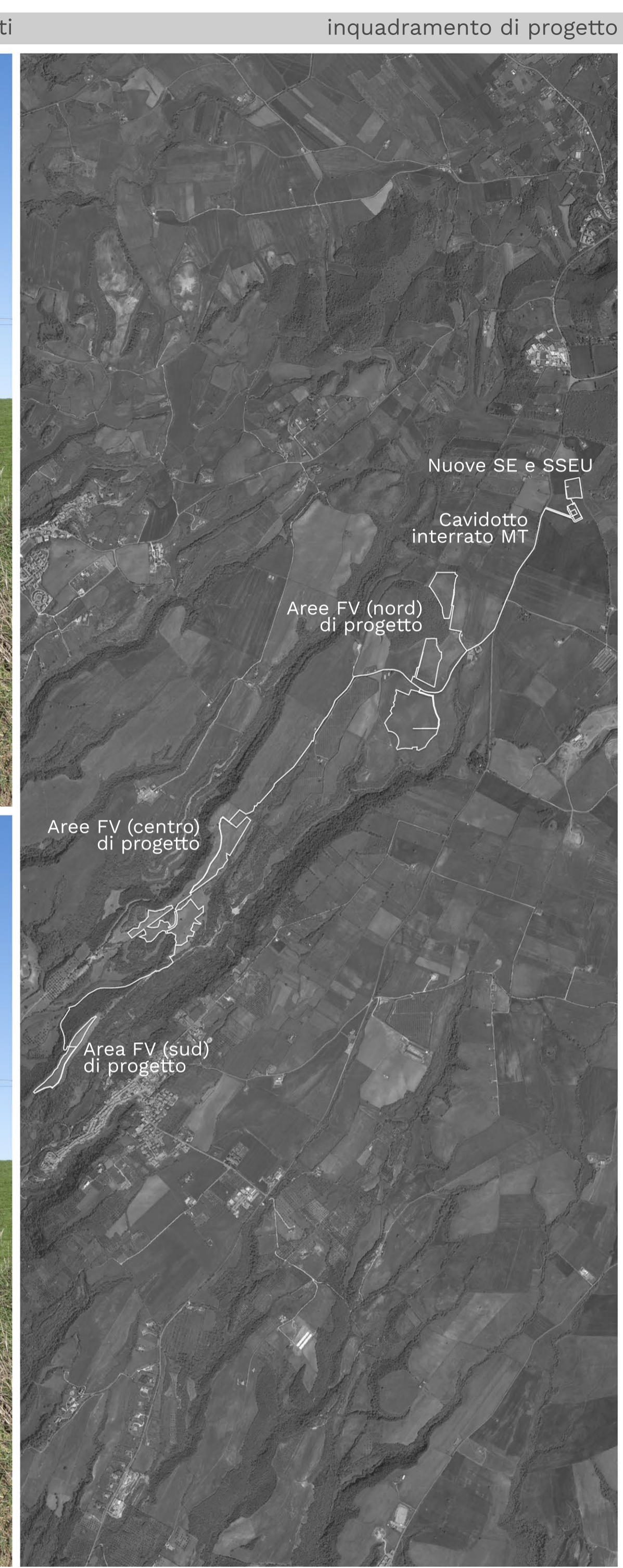
inquadramento di progetto