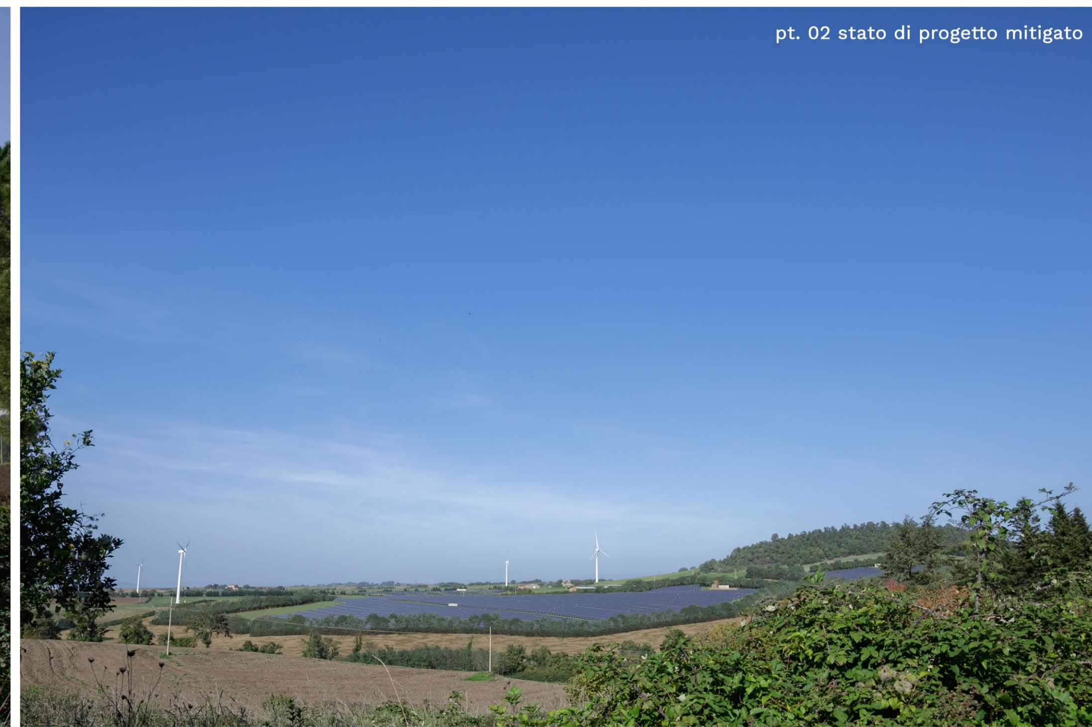
pt. 02 stato di progetto mitigato