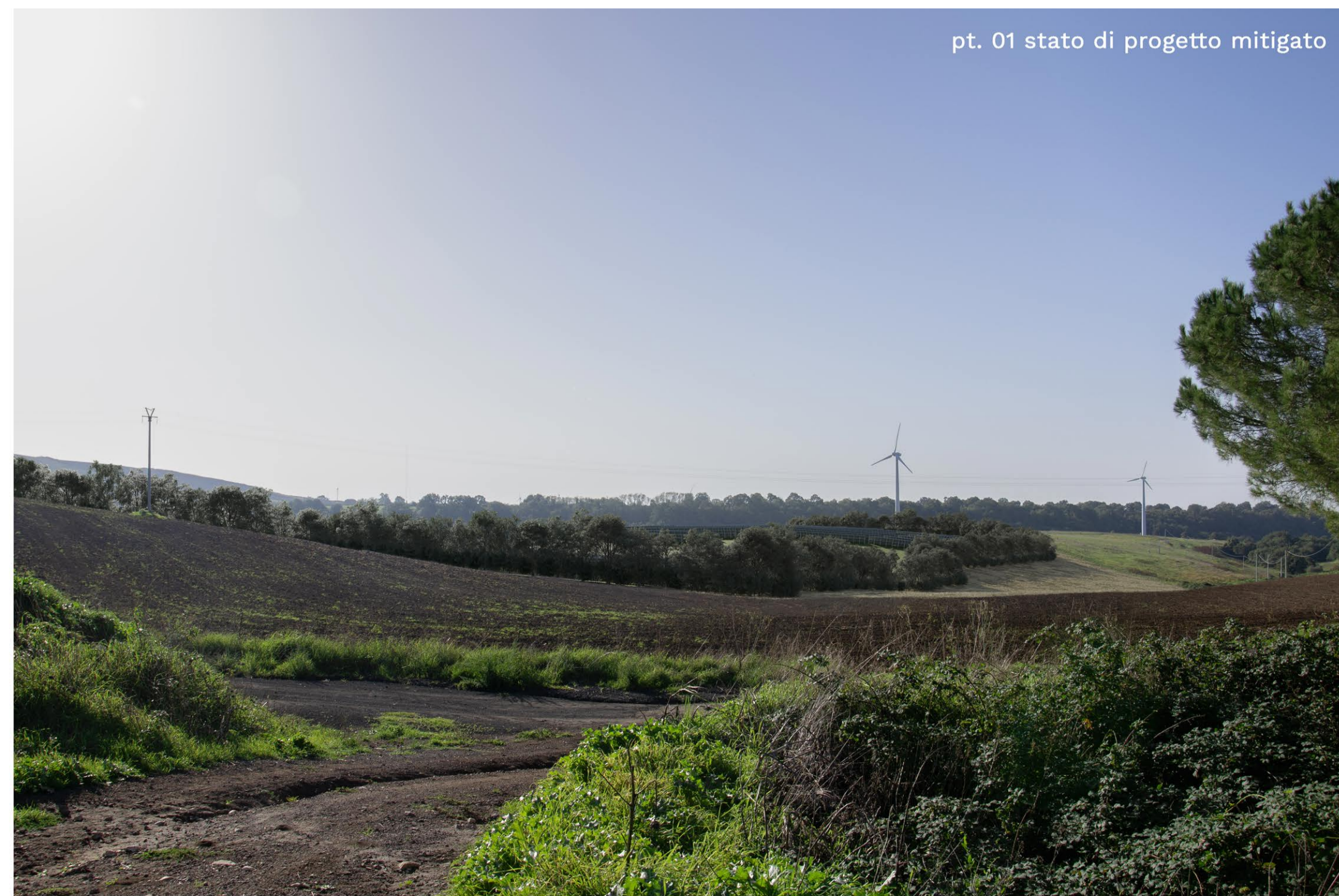
pt. 01 stato di progetto mitigato