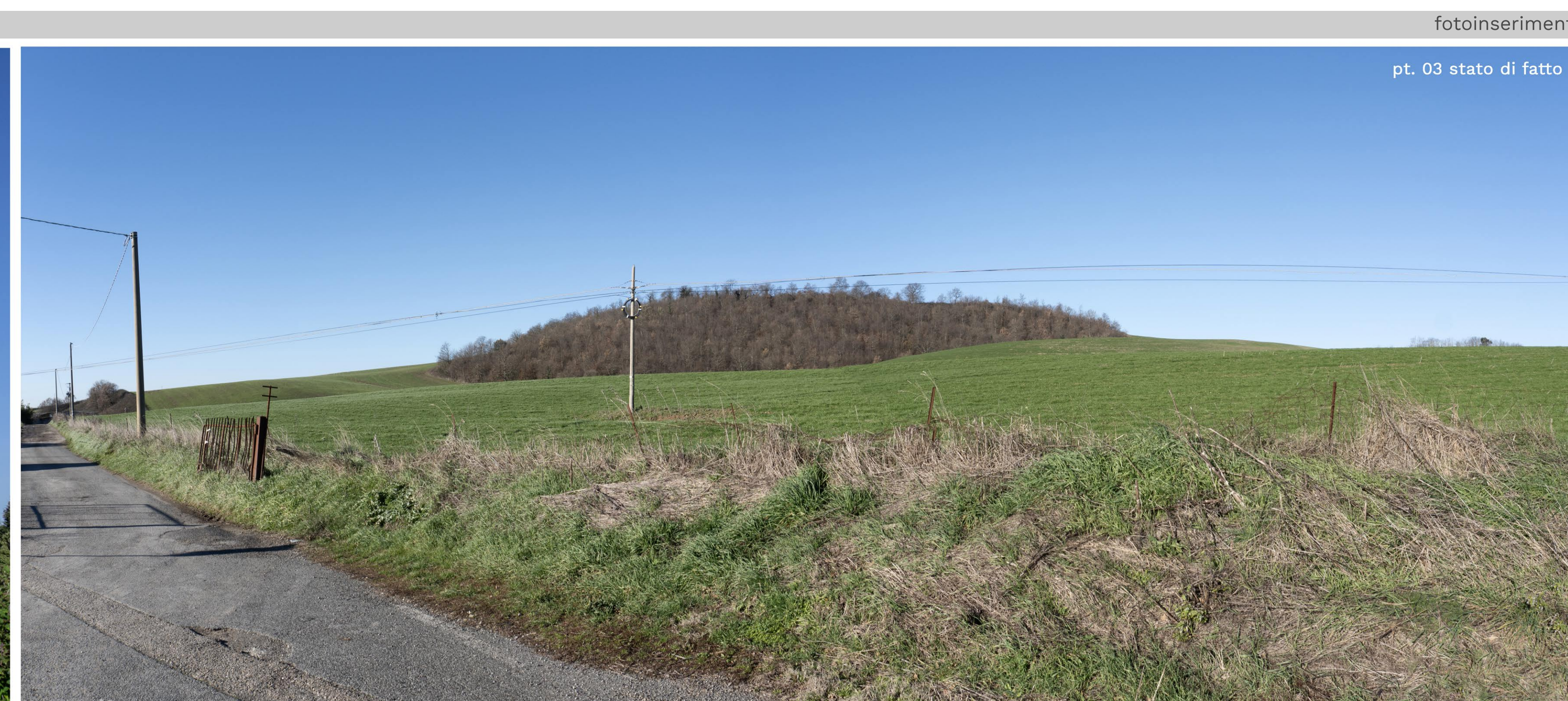
pt. 03 stato di fatto