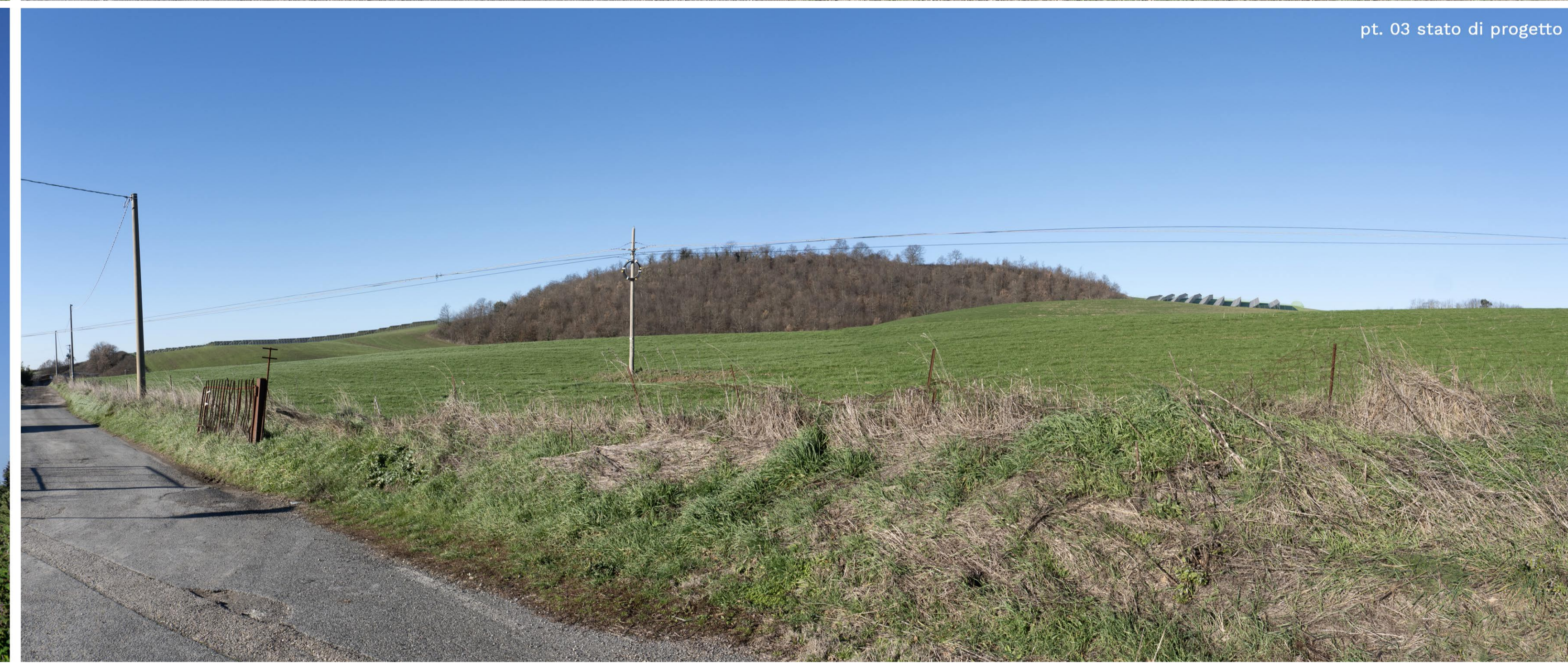
pt. 03 stato di progetto