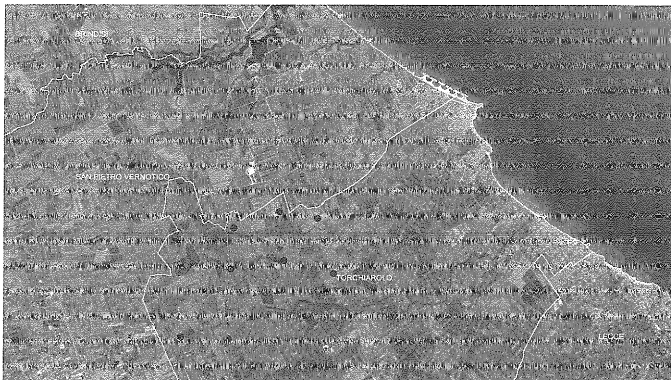
Area parco eolico – Inquadramento su ortofoto

Di seguito le coordinate degli aerogeneratori di progetto nel sistema di riferimento UTM WGS84 Fuso 33: