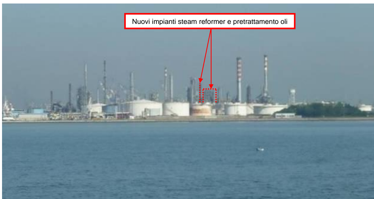
Figura 21. Nuovi impianti presso Raffineria di Venezia (punto di vista n. 10 dalla laguna – Canale Vittorio Emanuele)