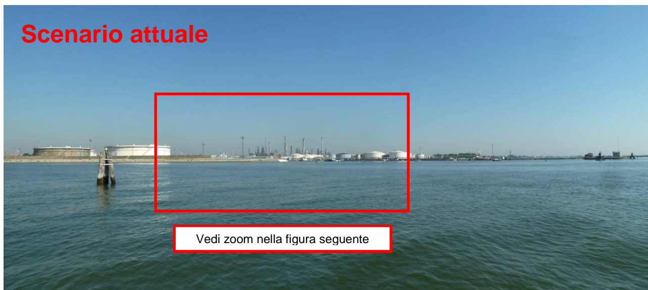
Figura 24. Inserimento paesaggistico Raffineria di Venezia - Scenario attuale (punto di vista n. 11 dalla laguna - Canale delle Tresse)