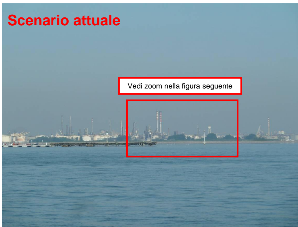
Figura 13. Inserimento paesaggistico Raffineria di Venezia - Scenario attuale (punto di vista n. 7 dalla città di Venezia)