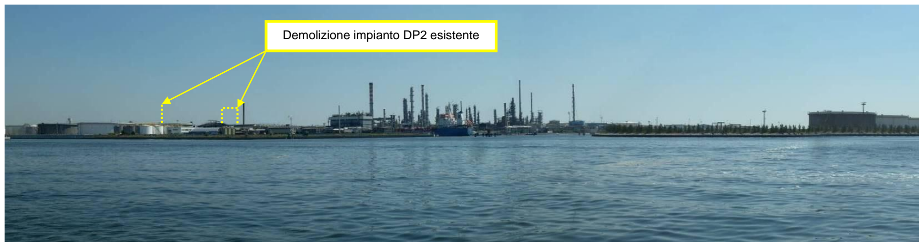
Figura 31. Demolizioni impianti presso Raffineria di Venezia (punto di vista n. 13 da Porto Marghera)