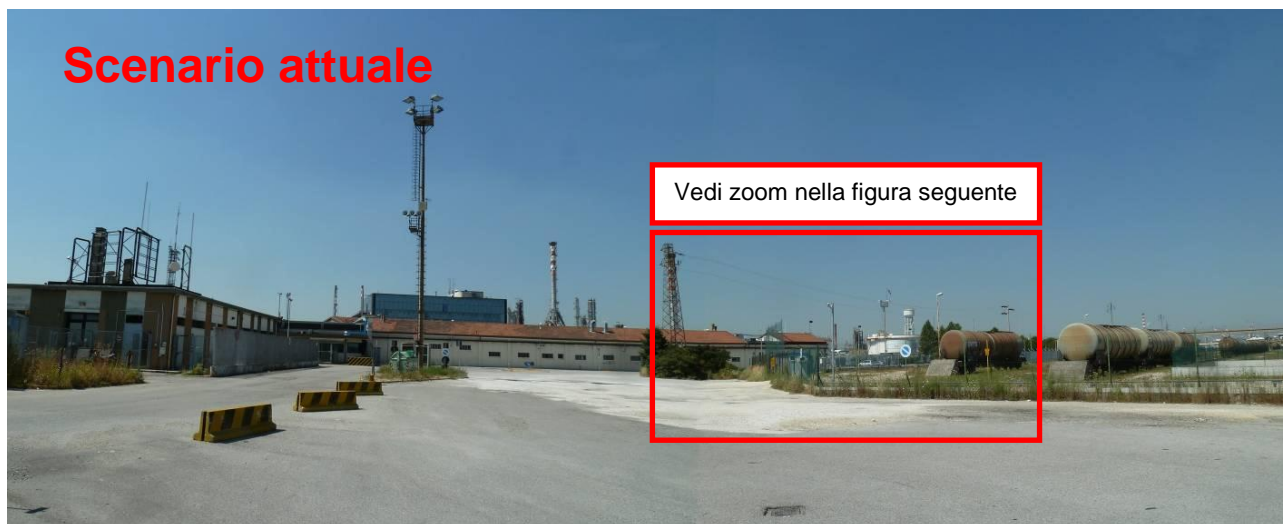
Figura 1. Inserimento paesaggistico Raffineria di Venezia - Scenario attuale (punto di vista n. 5 da via dei Petroli)