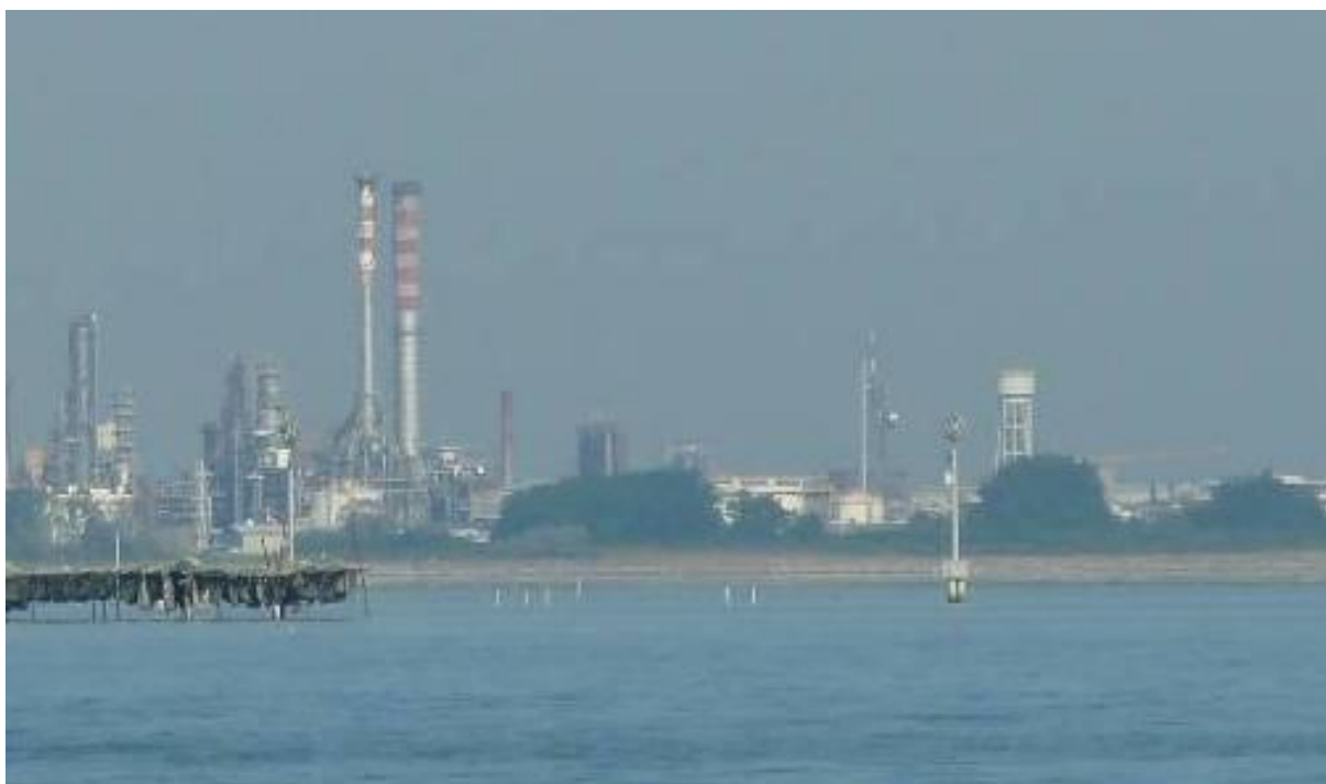
Figura 14. Inserimento paesaggistico Raffineria di Venezia - Scenario attuale (punto di vista n. 7 dalla città di Venezia)