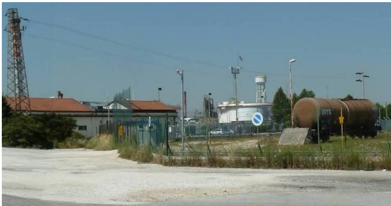
Figura 2. Inserimento paesaggistico Raffineria di Venezia - Scenario attuale (punto di vista n. 5 da via dei Petroli)