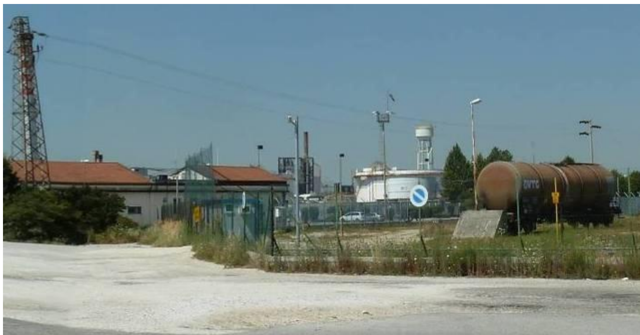
Figura 6. Inserimento paesaggistico Raffineria di Venezia - Scenario futuro (punto di vista n. 5 da via dei Petroli)