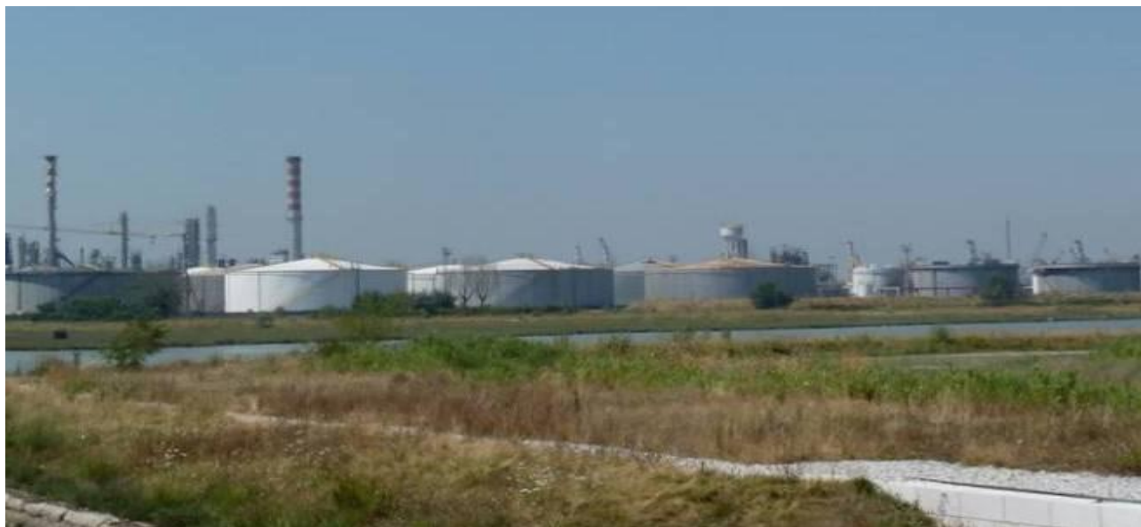
Figura 8. Inserimento paesaggistico Raffineria di Venezia - Scenario attuale (punto di vista n. 6 dal ponte della Libertà)