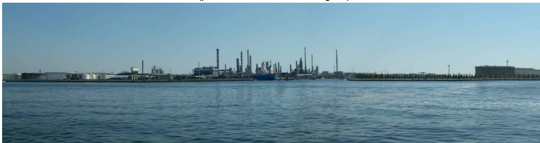
Figura 34. Inserimento paesaggistico Raffineria di Venezia - Scenario futuro (punto di vista n. 13 da Porto Marghera)