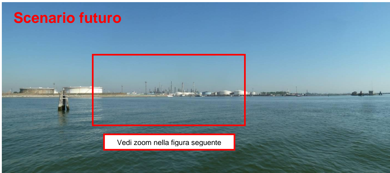
Figura 27. Inserimento paesaggistico Raffineria di Venezia - Scenario futuro (punto di vista n. 11 dalla laguna - Canale delle Tresse)