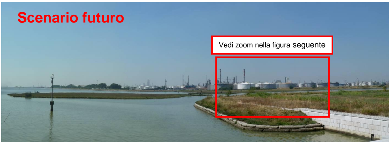
Figura 11. Inserimento paesaggistico Raffineria di Venezia - Scenario futuro (punto di vista n. 6 dal ponte della Libertà)