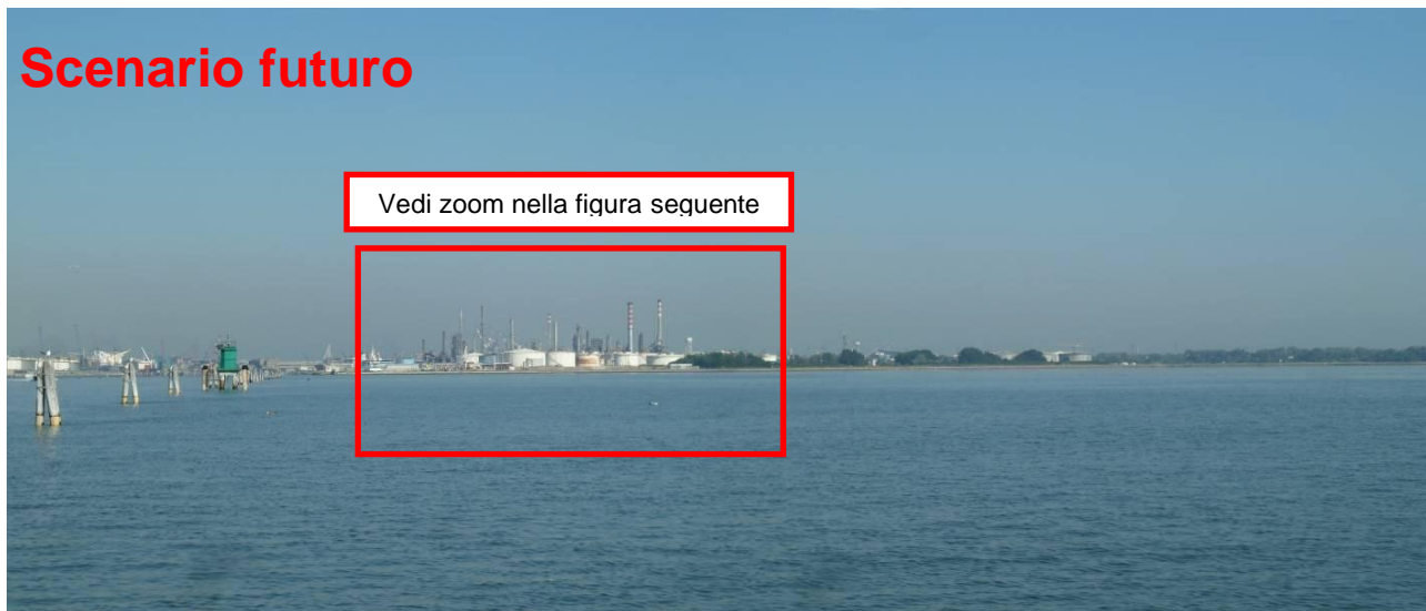
Figura 22. Inserimento paesaggistico Raffineria di Venezia - Scenario futuro (punto di vista n. 10 dalla laguna – Canale Vittorio Emanuele)