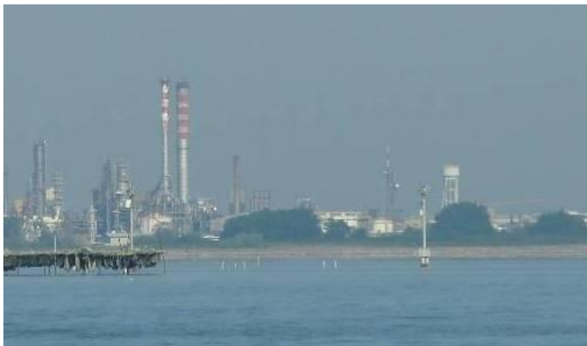
Figura 18. Inserimento paesaggistico Raffineria di Venezia - Scenario futuro (punto di vista n. 7 dalla città di Venezia)