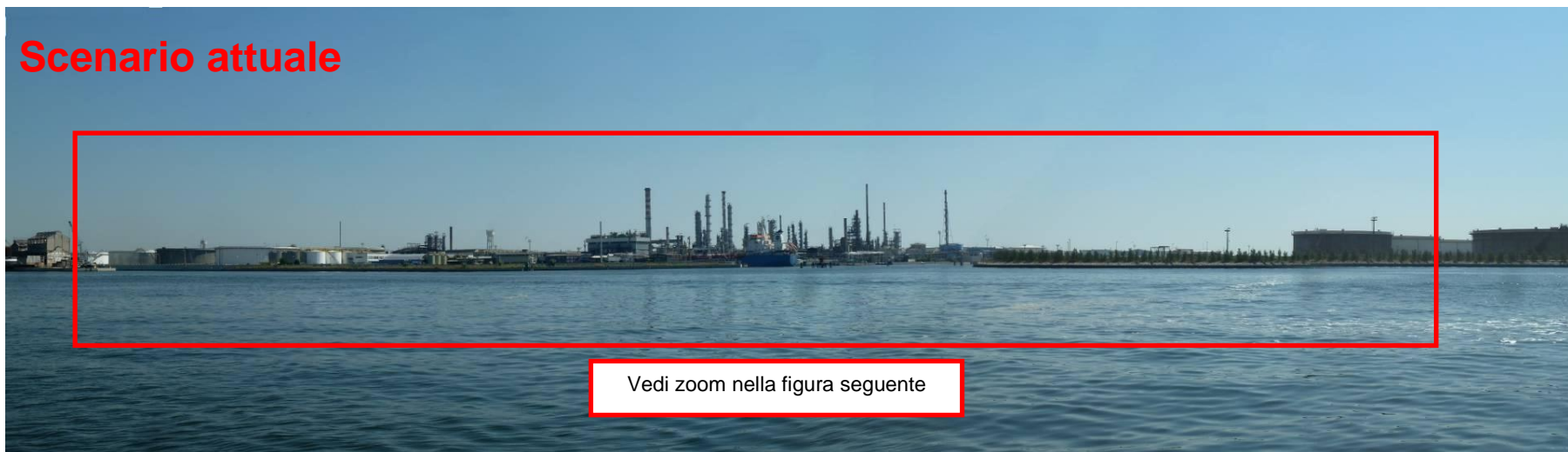
Figura 29. Inserimento paesaggistico Raffineria di Venezia - Scenario attuale (punto di vista n. 13 da Porto Marghera)