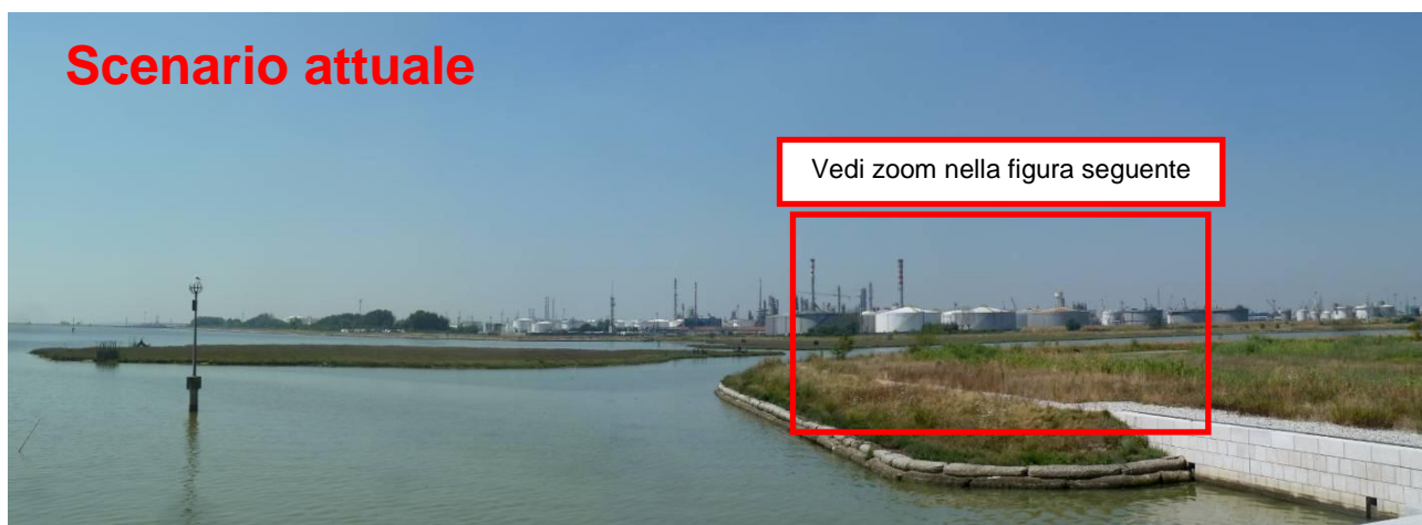
Figura 7. Inserimento paesaggistico Raffineria di Venezia - Scenario attuale (punto di vista n. 6 dal ponte della Libertà)