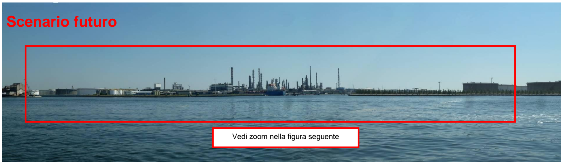
Figura 33. Inserimento paesaggistico Raffineria di Venezia - Scenario futuro (punto di vista n. 13 da Porto Marghera)