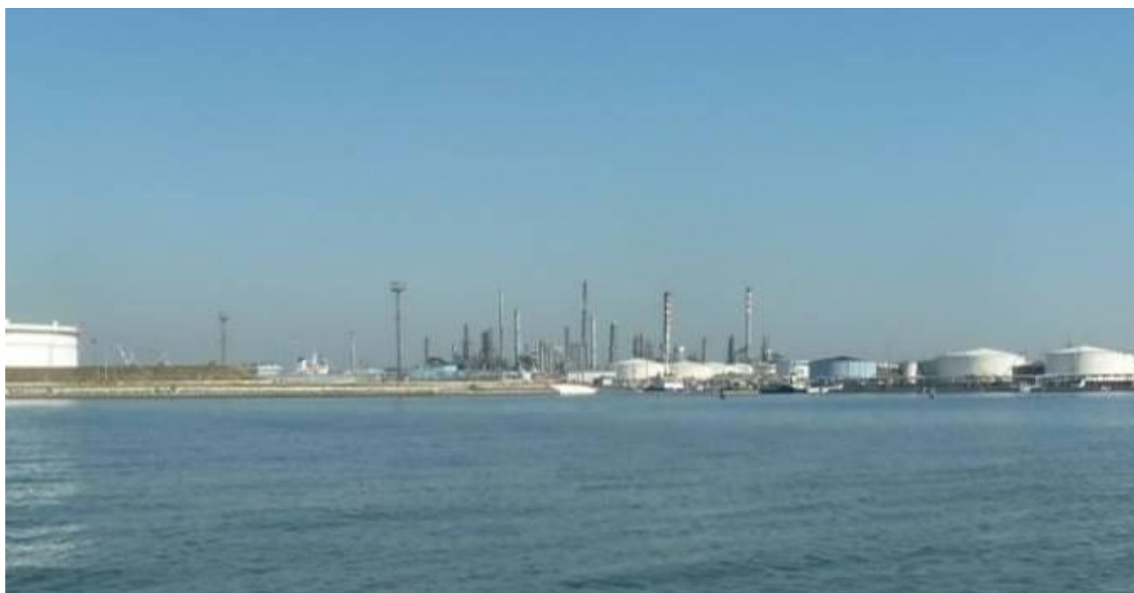
Figura 28. Inserimento paesaggistico Raffineria di Venezia - Scenario futuro (punto di vista n. 11 dalla laguna - Canale delle Tresse)