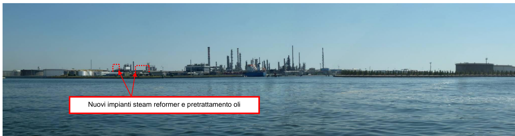
Figura 32. Nuovi impianti presso Raffineria di Venezia (punto di vista n. 13 da Porto Marghera)