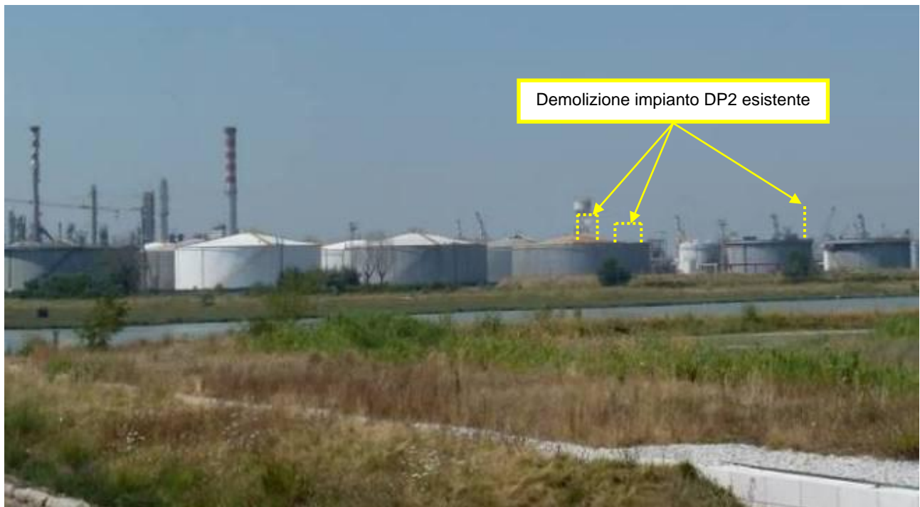
Figura 9. Demolizioni impianti presso Raffineria di Venezia (punto di vista n. 6 dal ponte della Libertà)