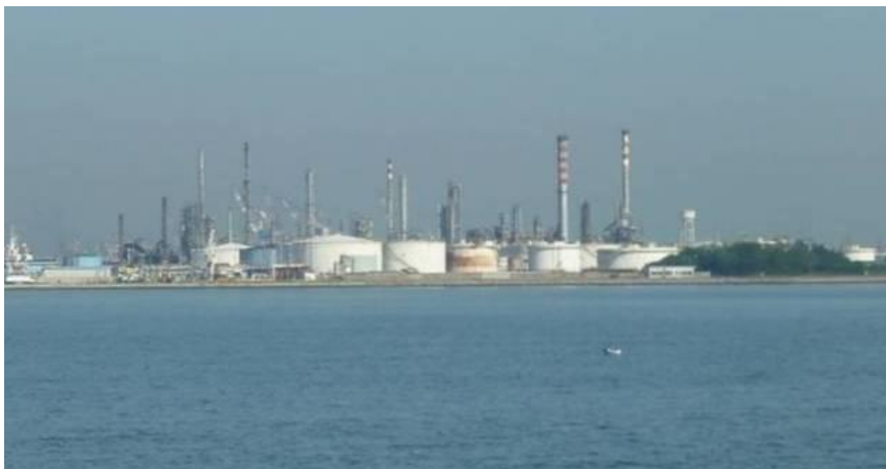
Figura 20. Inserimento paesaggistico Raffineria di Venezia - Scenario attuale (punto di vista n. 10 dalla laguna – Canale Vittorio Emanuele)