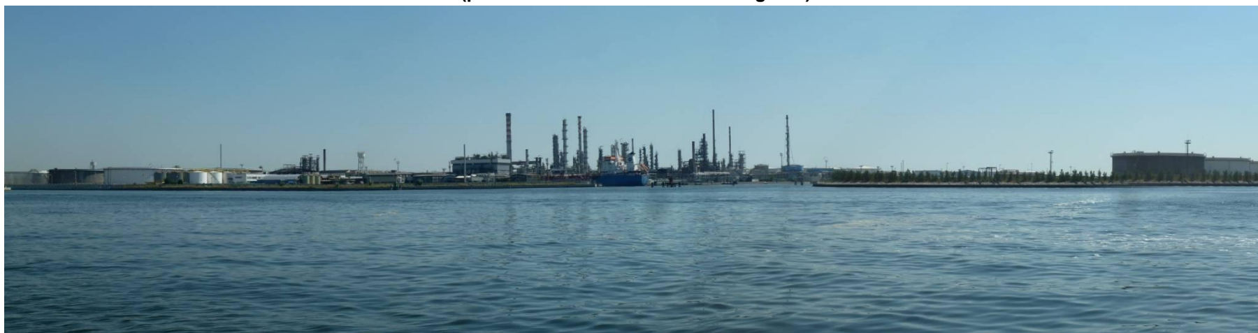
Figura 30. Inserimento paesaggistico Raffineria di Venezia - Scenario attuale (punto di vista n. 13 da Porto Marghera)