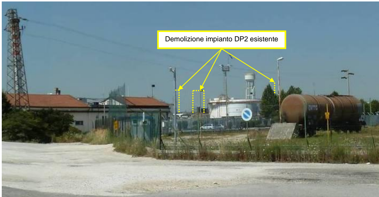
Figura 3. Demolizioni impianti presso Raffineria di Venezia (punto di vista n. 5 da via dei Petroli)