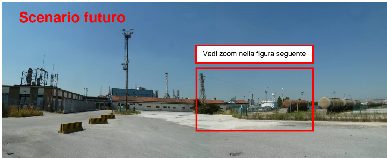
Figura 5. Inserimento paesaggistico Raffineria di Venezia - Scenario futuro (punto di vista n. 5 da via dei Petroli)