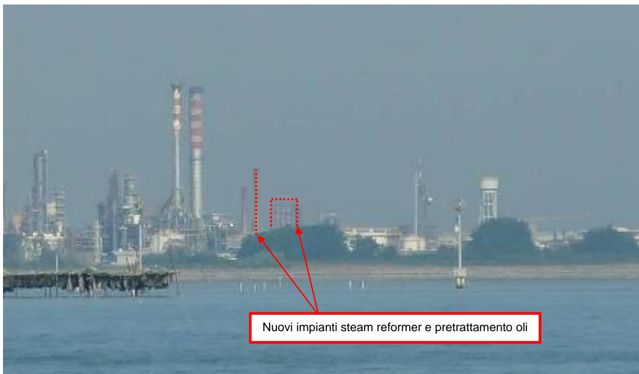
Figura 16. Nuovi impianti presso Raffineria di Venezia (punto di vista n. 7 dalla città di Venezia)