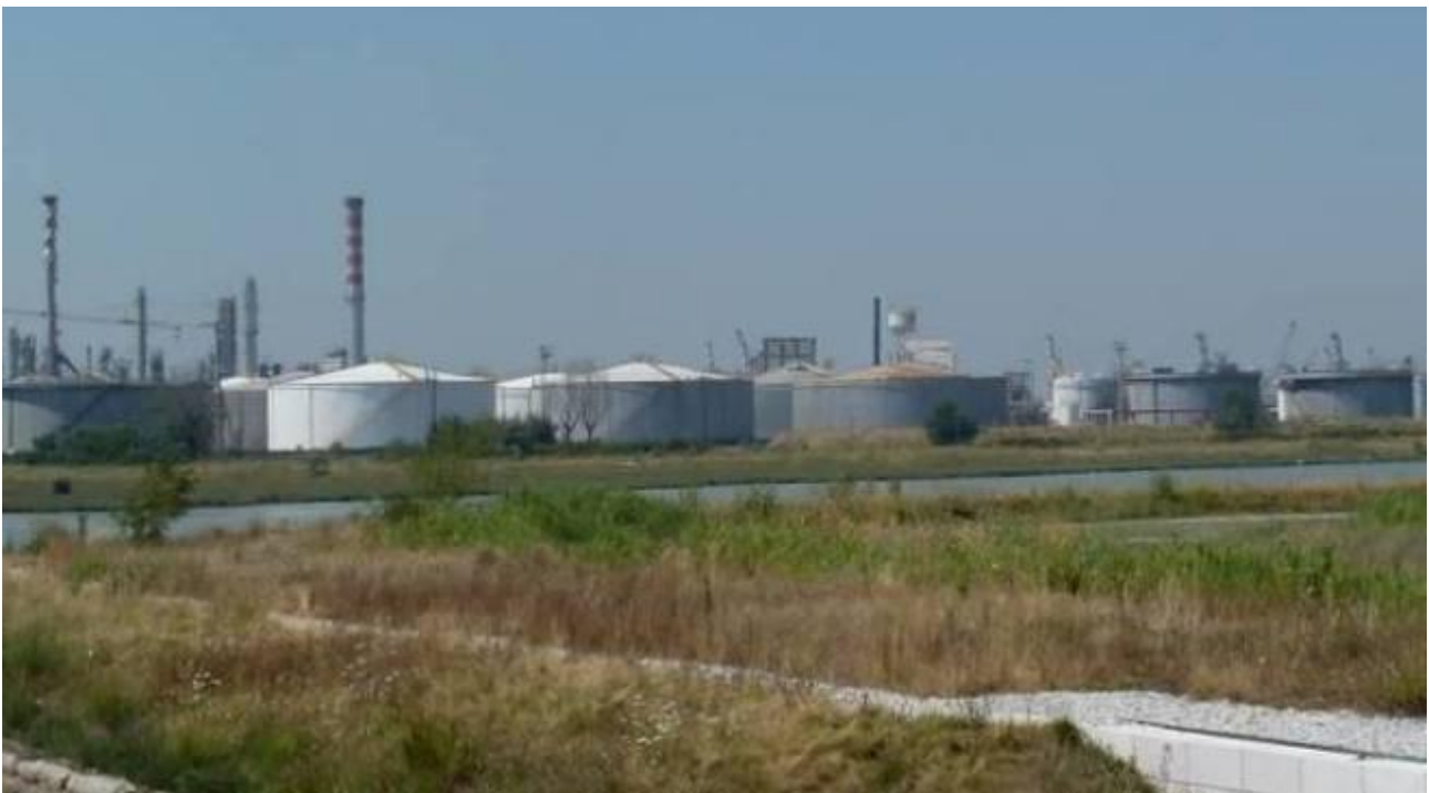
Figura 12. Inserimento paesaggistico Raffineria di Venezia - Scenario futuro (punto di vista n. 6 dal ponte della Libertà)