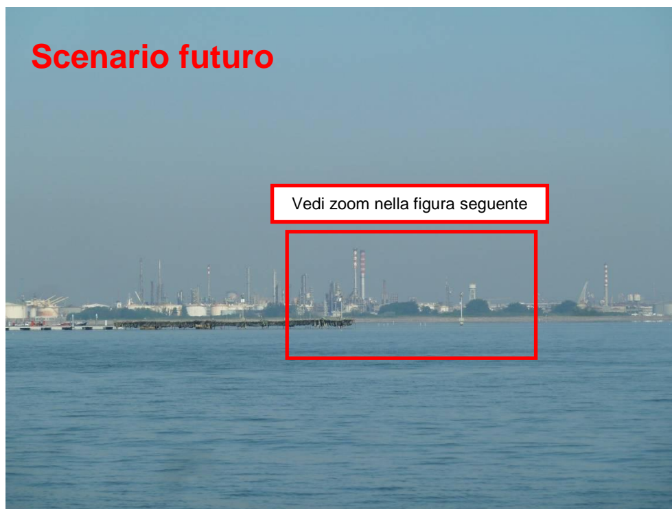
Figura 17. Inserimento paesaggistico Raffineria di Venezia - Scenario futuro (punto di vista n. 7 dalla città di Venezia)