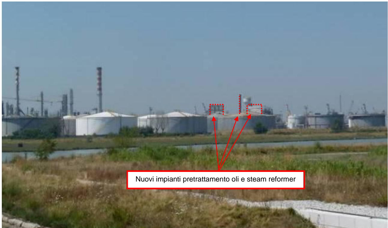
Figura 10. Nuovi impianti presso Raffineria di Venezia (punto di vista n. 6 dal ponte della Libertà)