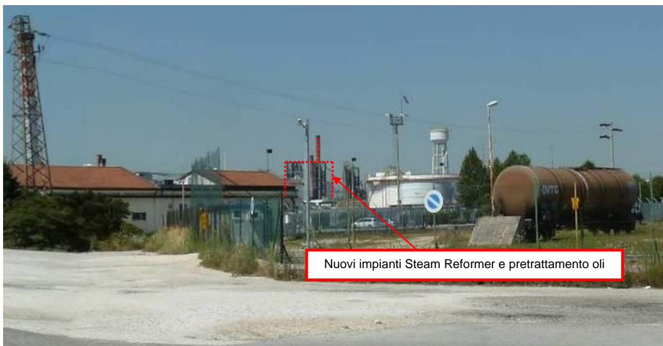
Figura 4. Nuovi impianti presso Raffineria di Venezia (punto di vista n. 5 da via dei Petroli)