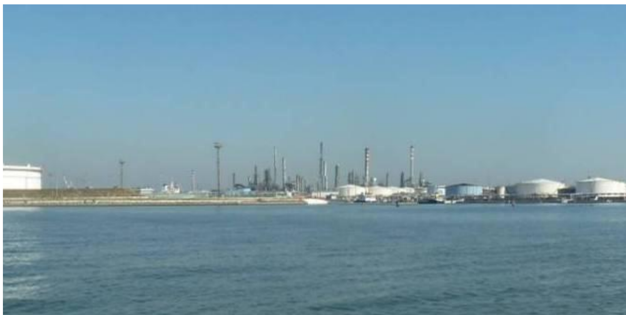
Figura 25. Inserimento paesaggistico Raffineria di Venezia - Scenario attuale (punto di vista n. 11 dalla laguna - Canale delle Tresse)