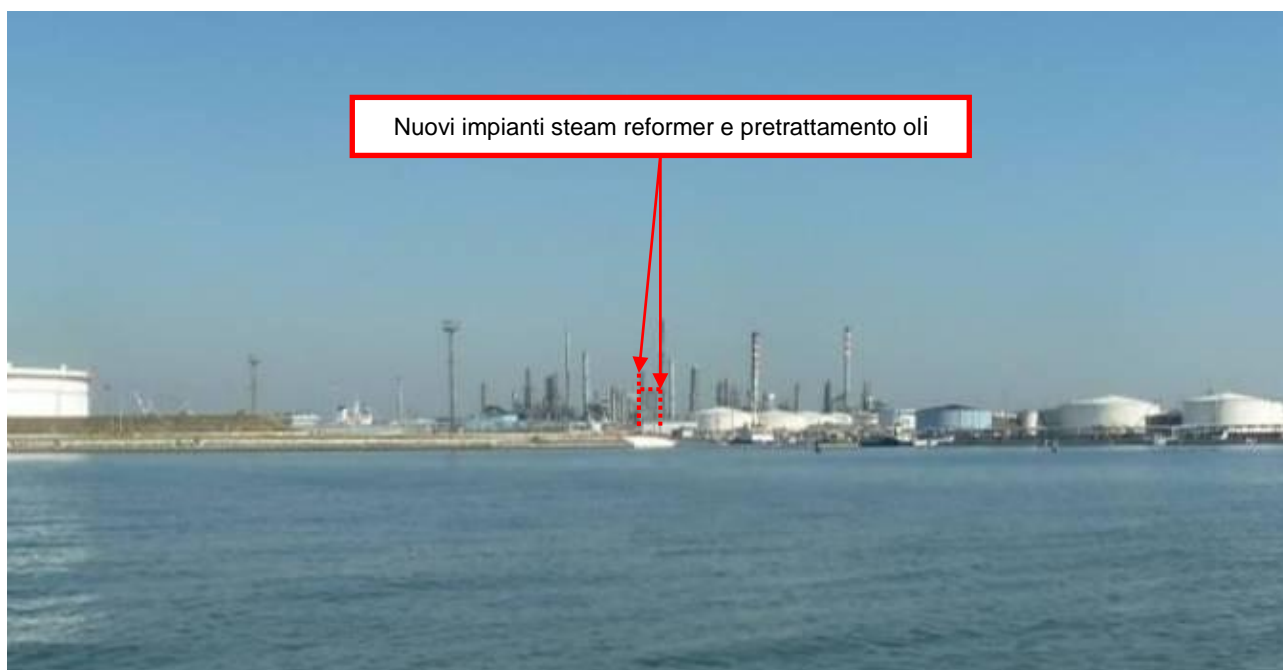
Figura 26. Nuovi impianti presso Raffineria di Venezia (punto di vista n. 11 dalla laguna - Canale delle Tresse)