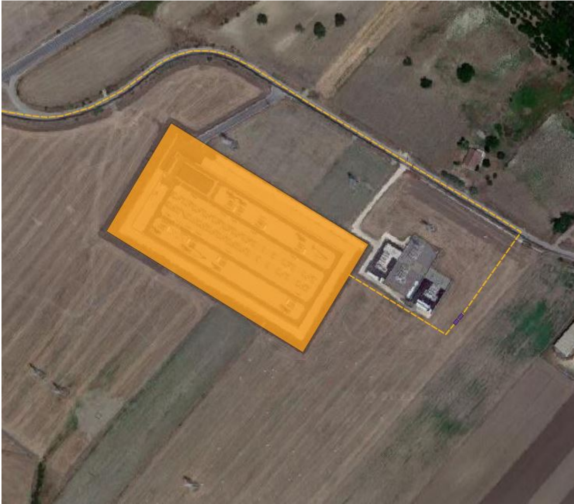
Figura 2 -Ipotesi posizionamento futura SE-Terna (in arancione), in viola posizionamento Stazione di Consegna