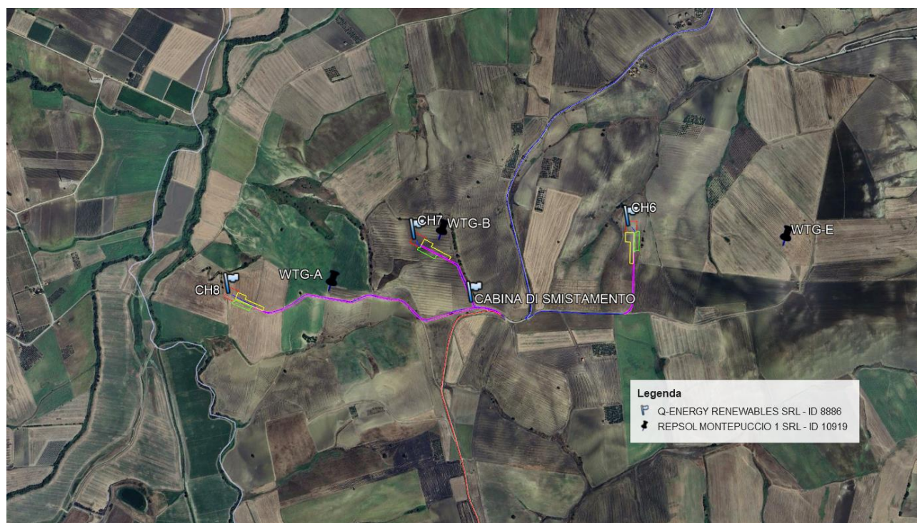
Figura 2 – Inquadramento su ortofoto

Come si può facilmente evincere, la ridotta distanza appare contraria a regole di buona tecnica e sicurezza e comporterebbe altresì una perdita di produttività per “effetto scia” oltre ad una alta interferenza aerodinamica che provocherebbe turbolenze con probabili sovraccarichi dei componenti delle WTG dell’impianto eolico della Q-Energy Renewables S.r.l. durante la fase operativa dell’impianto, con conseguente rischio di maggiore sollecitazione e maggior possibilità di rottura degli aerogeneratori.