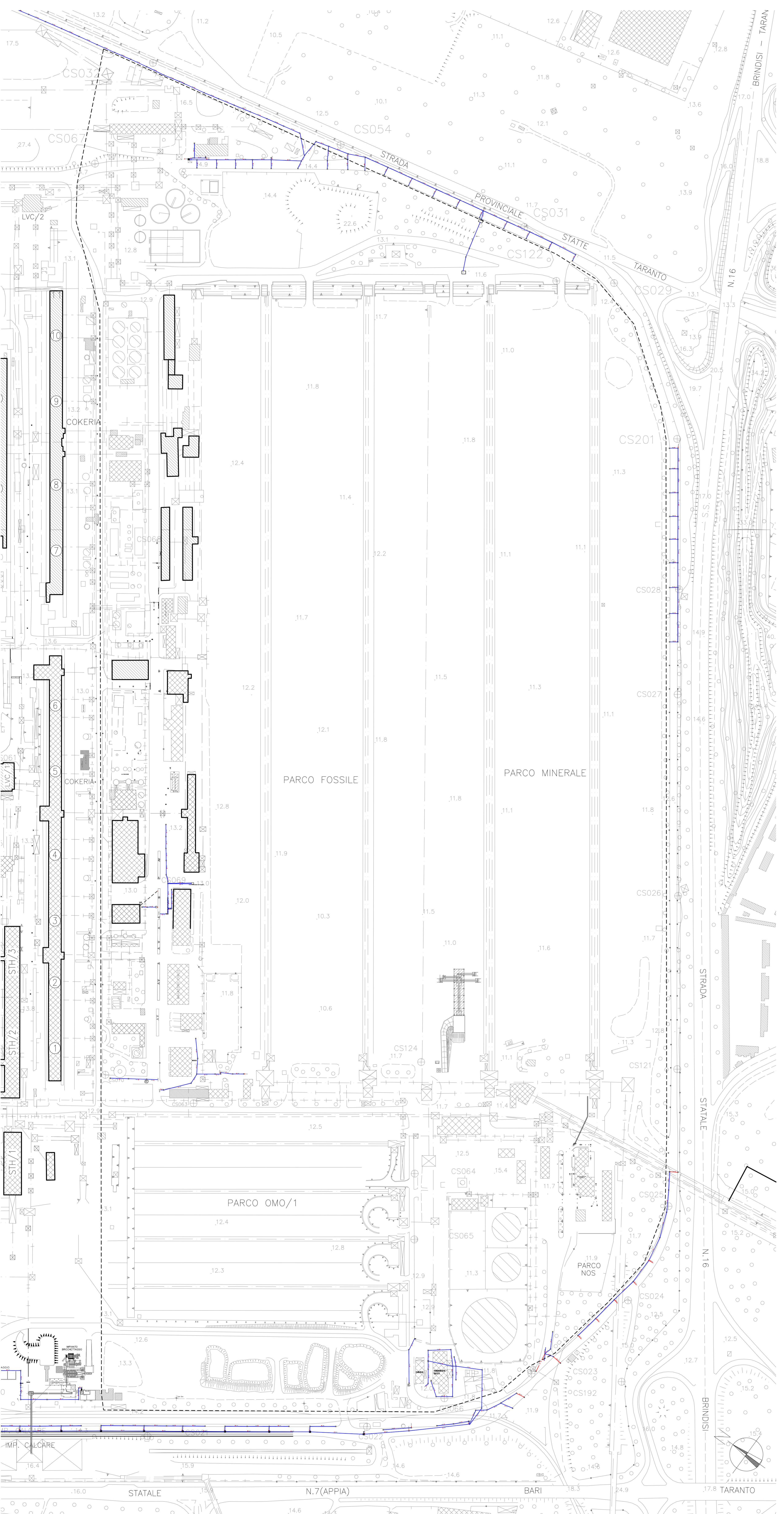
PLANIMETRIA DEI SOTTOSERVIZI - Stralcio area intervento Rapp. 1:2000