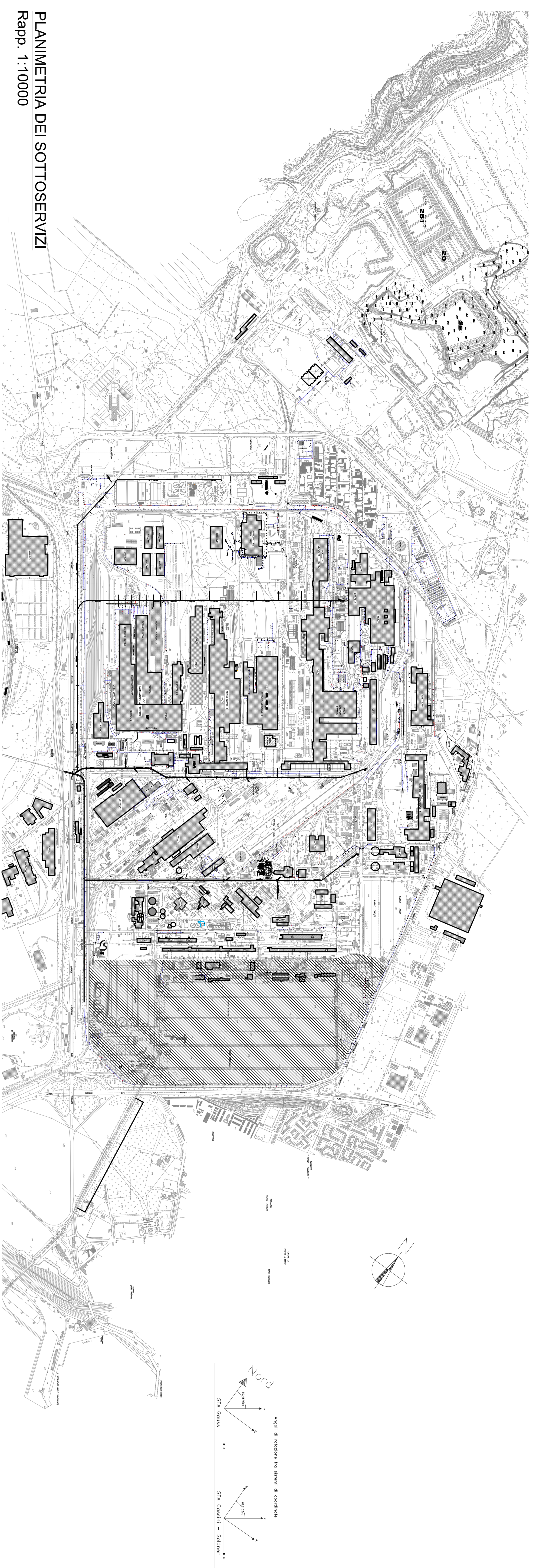
PLANIMETRIA DEI SOTTOSERVIZI Rapp. 1:10000