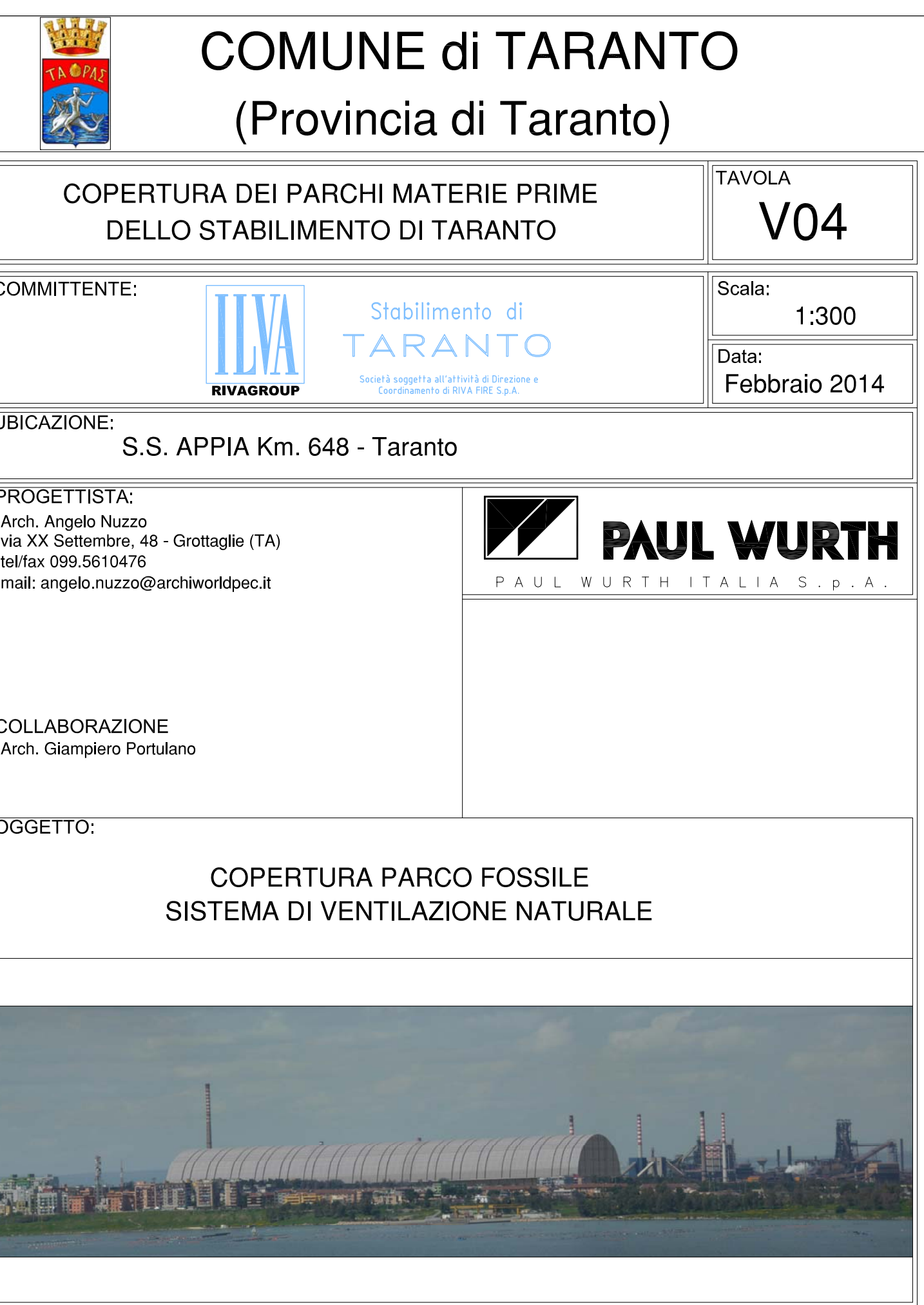
COPERTURA PARCO FOSSILE