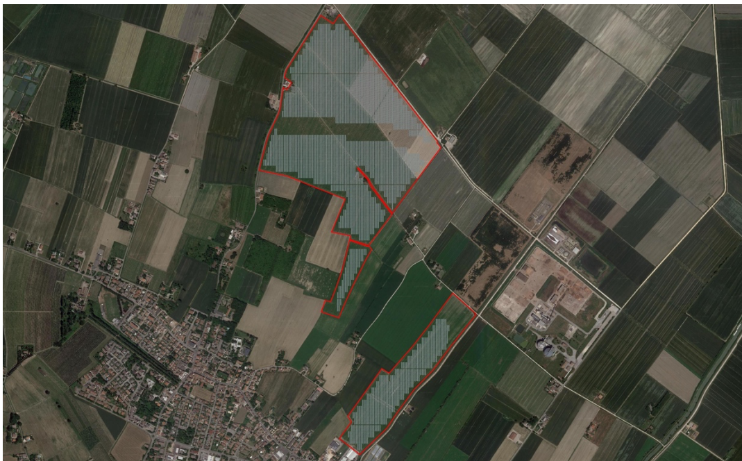
Figura 1 - Area intervento

L'area complessiva dell'impianto agrivoltaico ricopre un'area di circa 98 Ha. Le aree d'intervento sono localizzate nel Comune di Finale Emilia (MO).