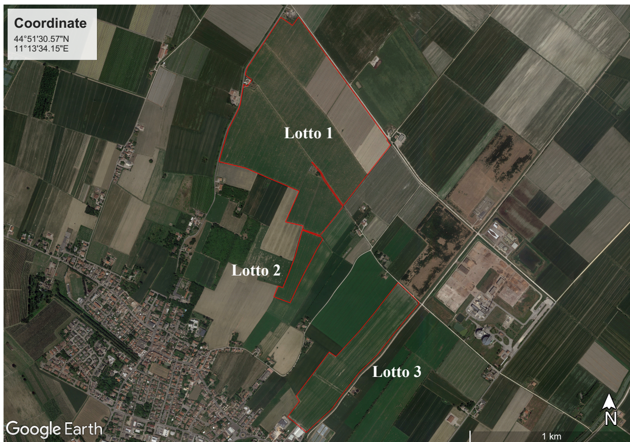
Figura 4 - Area Impianto