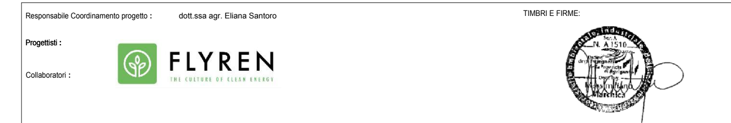
Tavola n. T.1.1CB Scale: 1:2.000

Tipo lavoro: Layout generale di impianto su catastale dell'area Sud