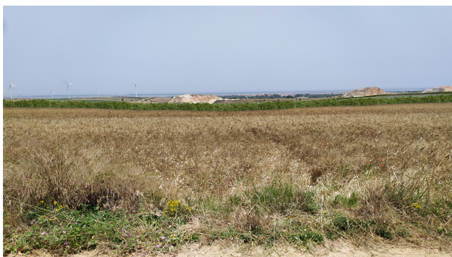
Vista 3 - Fotoinserimento