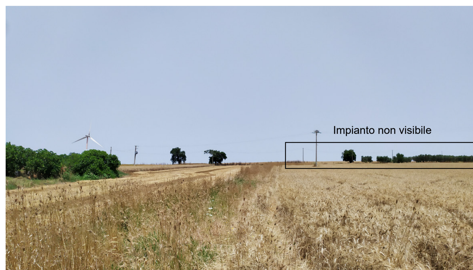
Vista 6 - Stato di fatto

Comune di : APRICENA Provincia di : FOGGIA Regione : PUGLIA