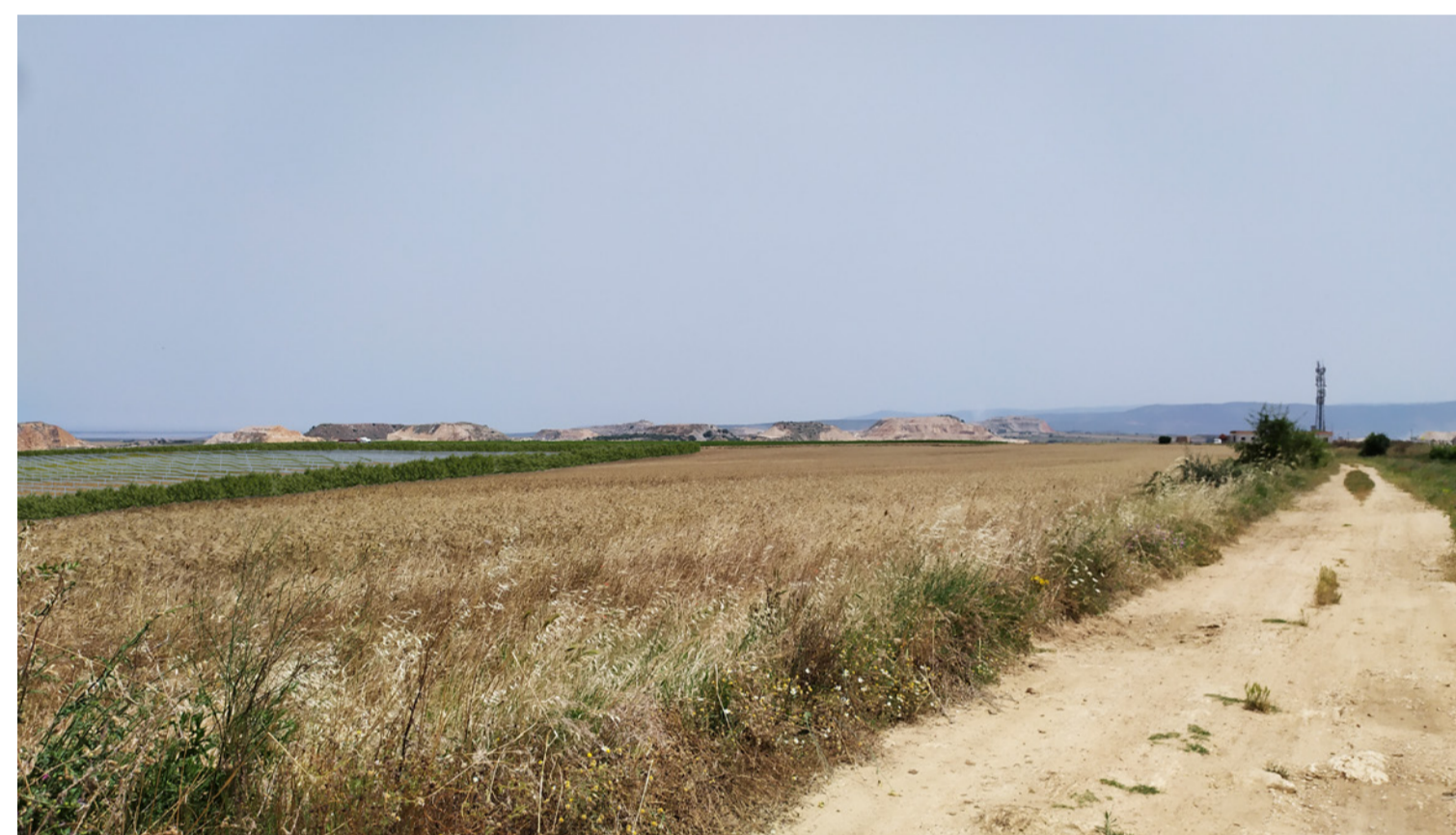
Vista 4 - Fotoinserimento