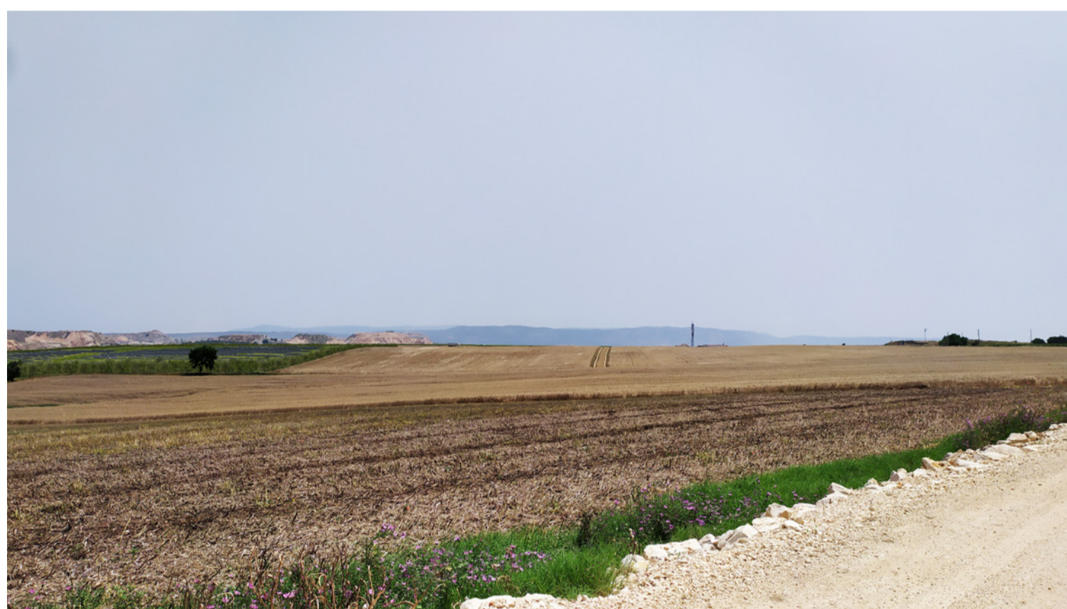
Vista 2 - Fotoinserimento