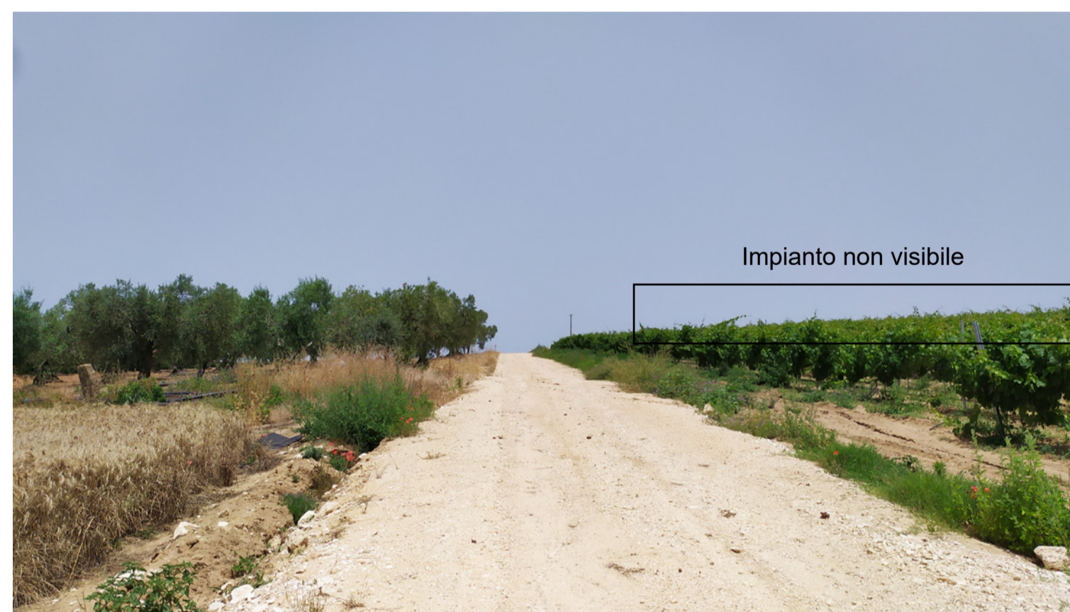
Vista 5 - Stato di fatto