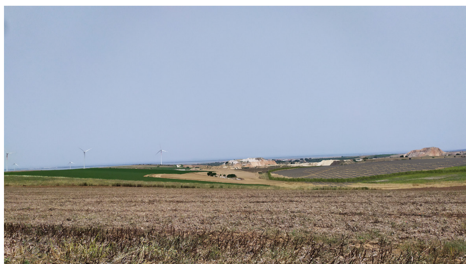
Vista 1 - Fotoinserimento