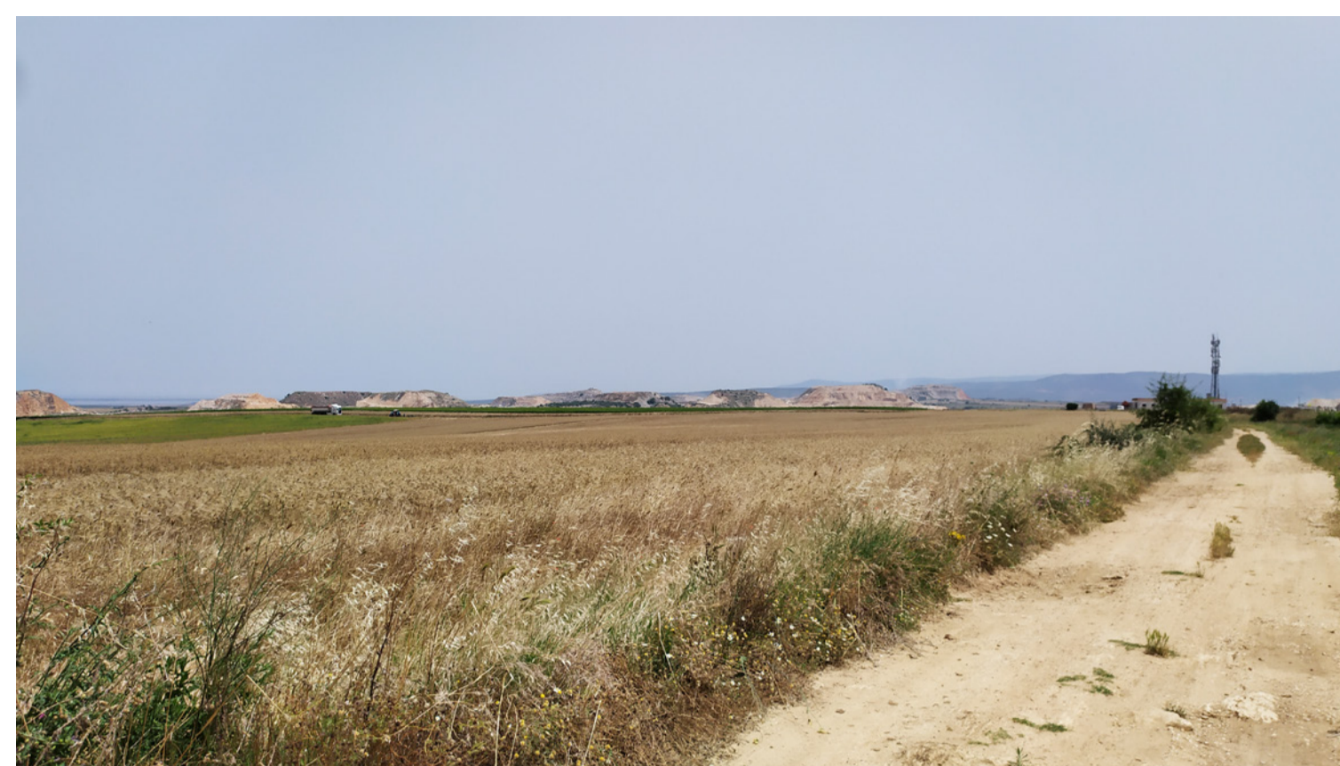
Vista 4 - Stato di fatto