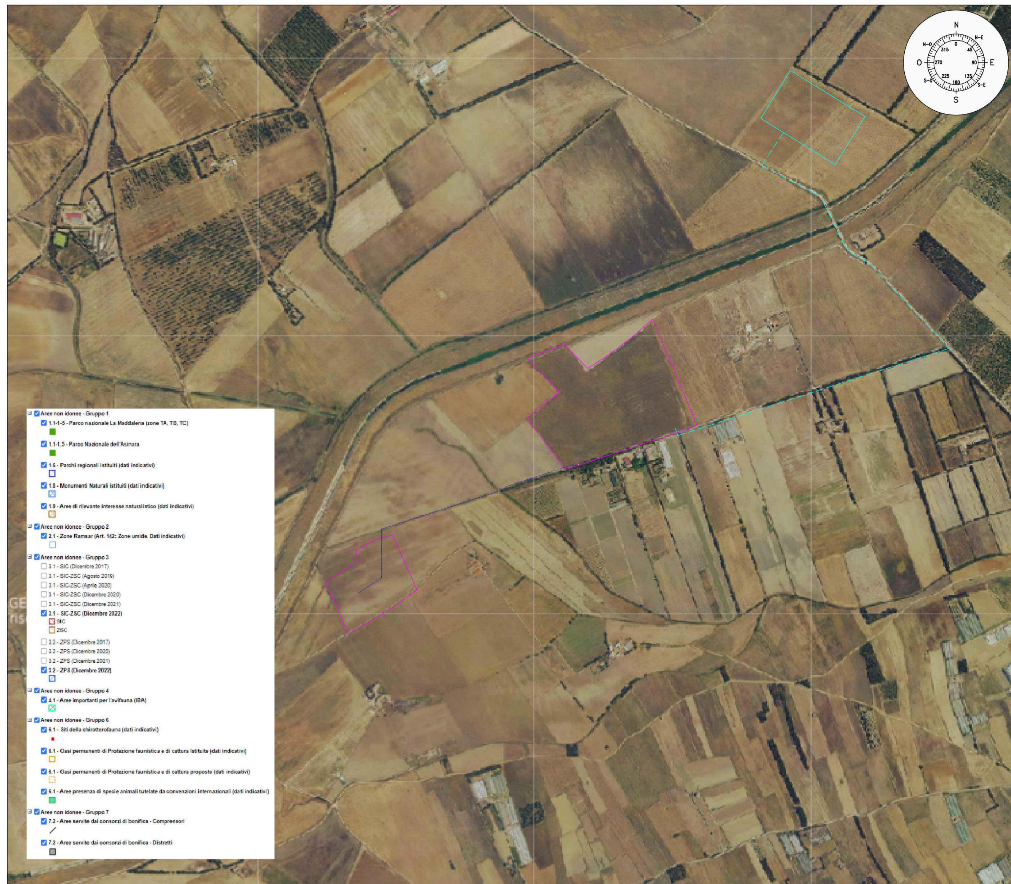
INQUADRAMENTO DLG 42/2004 ARTT. 142, 136 e 157 – Beni paesaggistici e Aree dichiarate di notevole interesse pubblico – SCALA 1:8'000