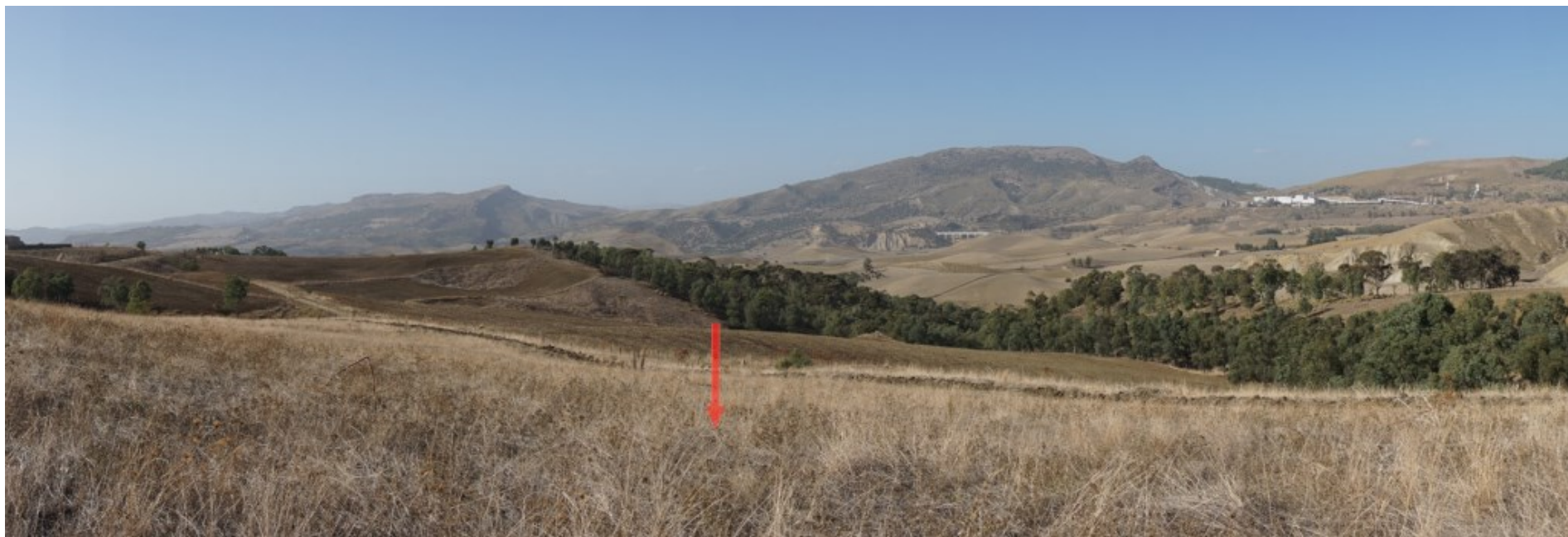
Ripresa fotografica – Stato di fatto – Localizzazione Torre 09