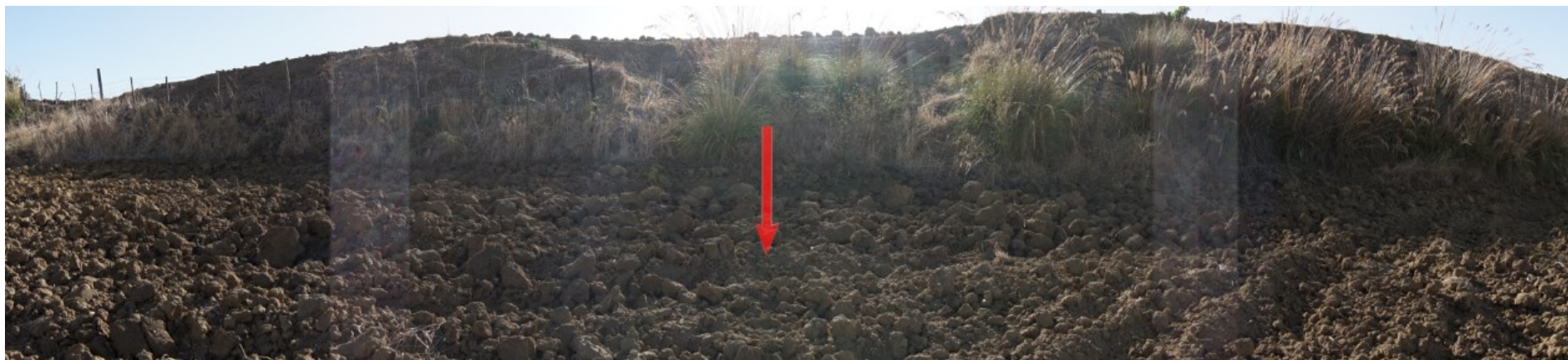
Ripresa fotografica – Stato di fatto – Localizzazione Torre 01