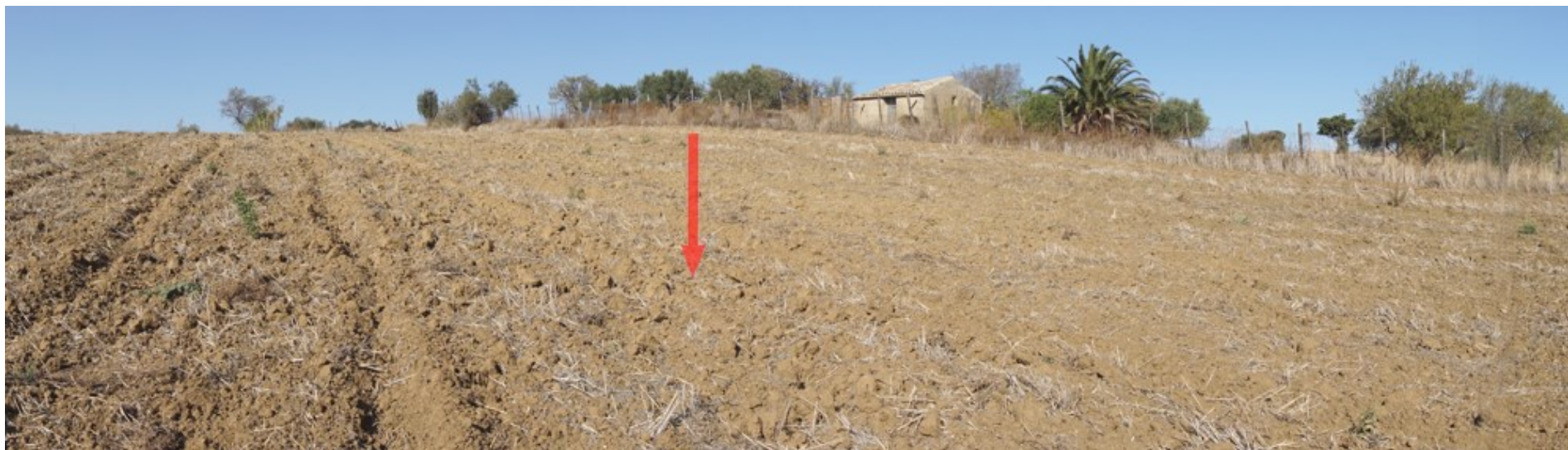
Ripresa fotografica – Stato di fatto – Localizzazione Torre 03