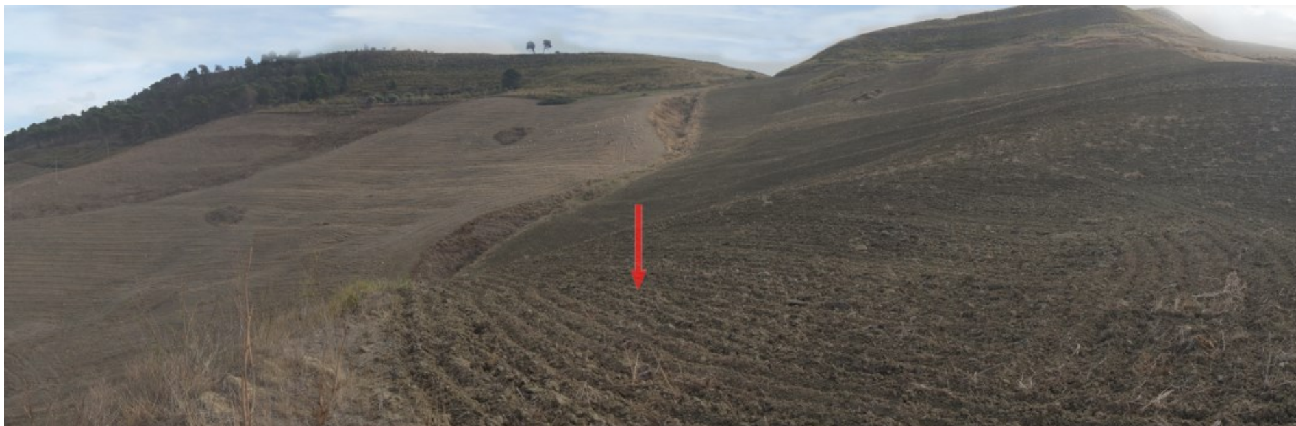
Ripresa fotografica – Stato di fatto – Localizzazione Torre 10