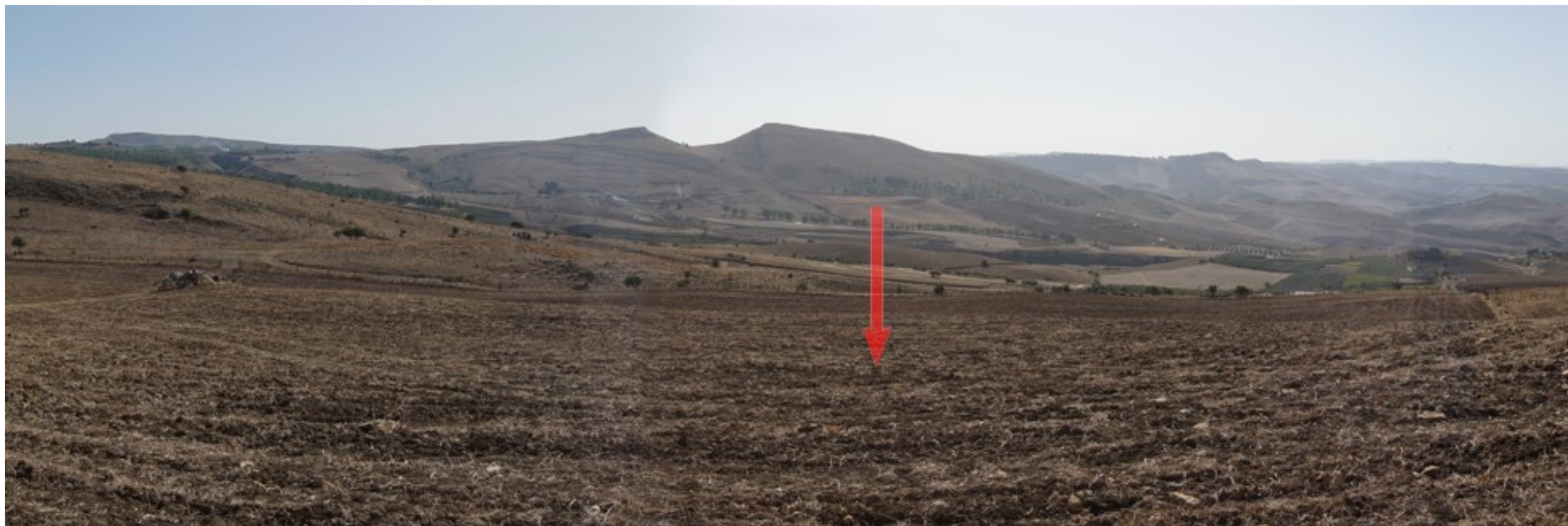
Ripresa fotografica – Stato di fatto – Localizzazione Torre 04