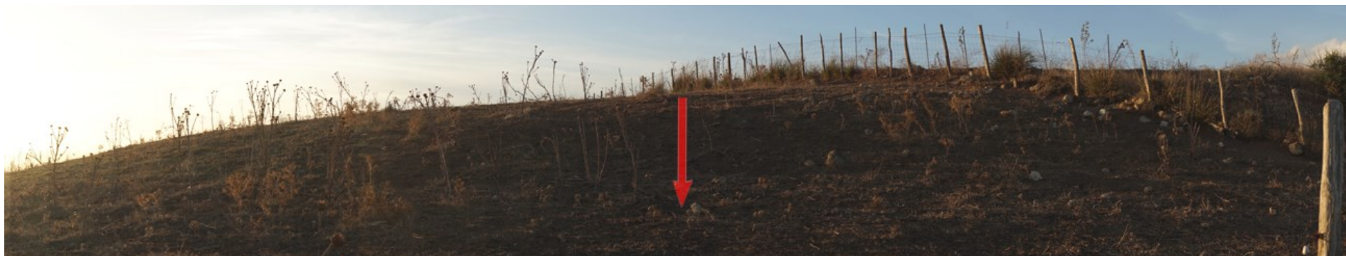
Ripresa fotografica – Stato di fatto – Localizzazione Torre 05