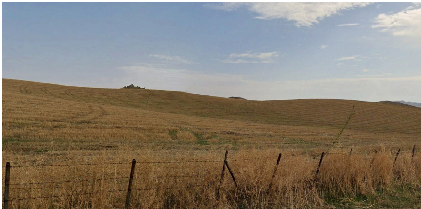
Ripresa fotografica – Stato di fatto – Localizzazione Area di Cantiere