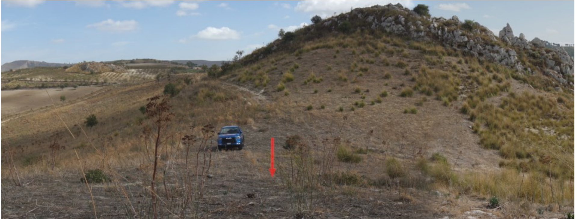
Ripresa fotografica – Stato di fatto – Localizzazione Torre 12