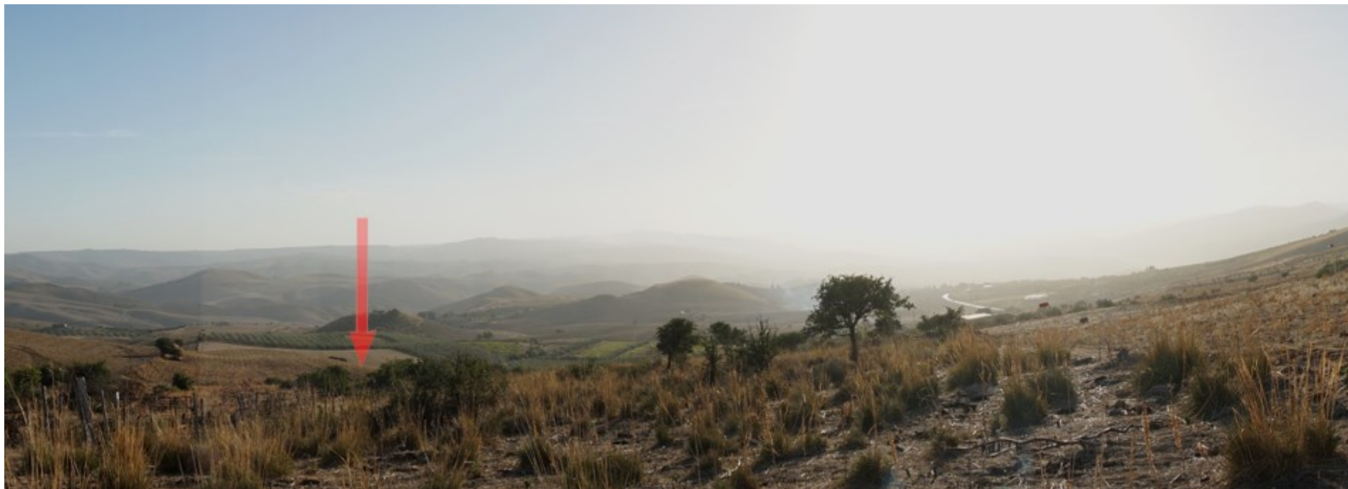
Ripresa fotografica – Stato di fatto – Localizzazione Torre 06