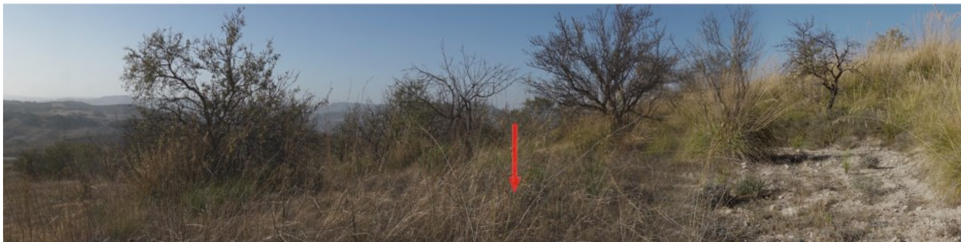
Ripresa fotografica – Stato di fatto – Localizzazione Torre 14