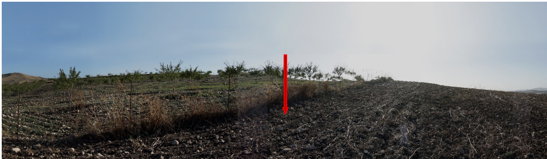
Ripresa fotografica – Stato di fatto – Localizzazione Torre 15