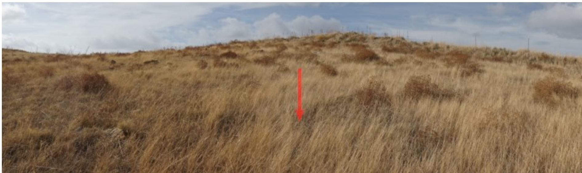
Ripresa fotografica – Stato di fatto – Localizzazione Torre 11