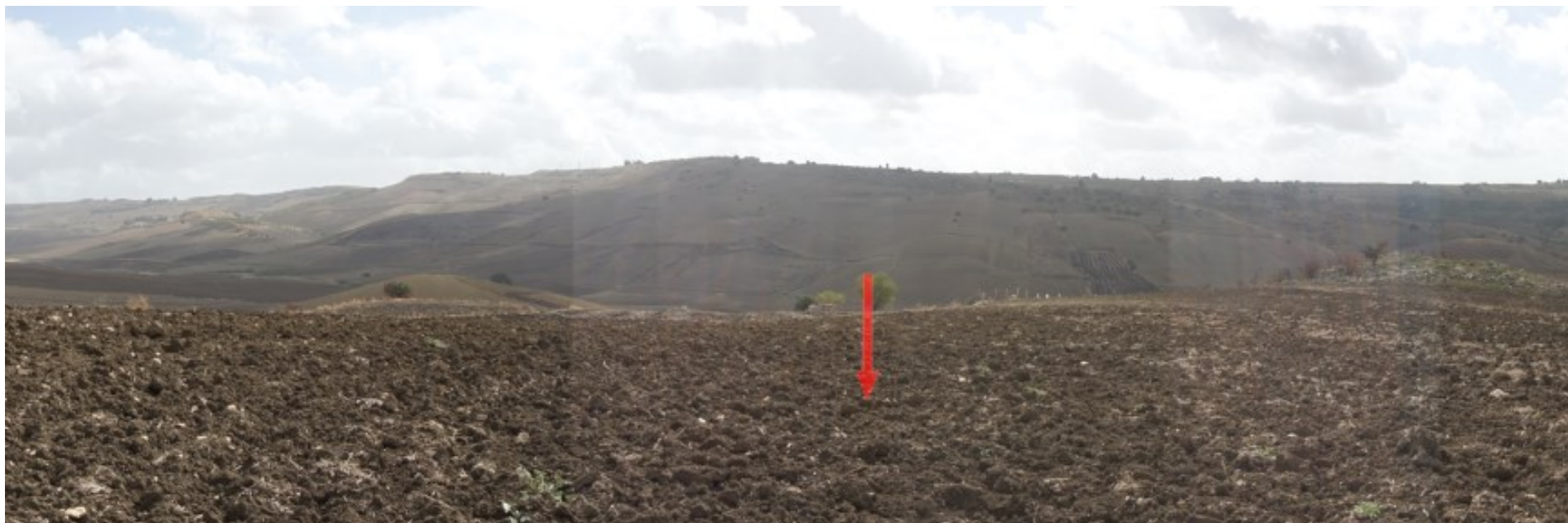
Ripresa fotografica – Stato di fatto – Localizzazione Torre 17