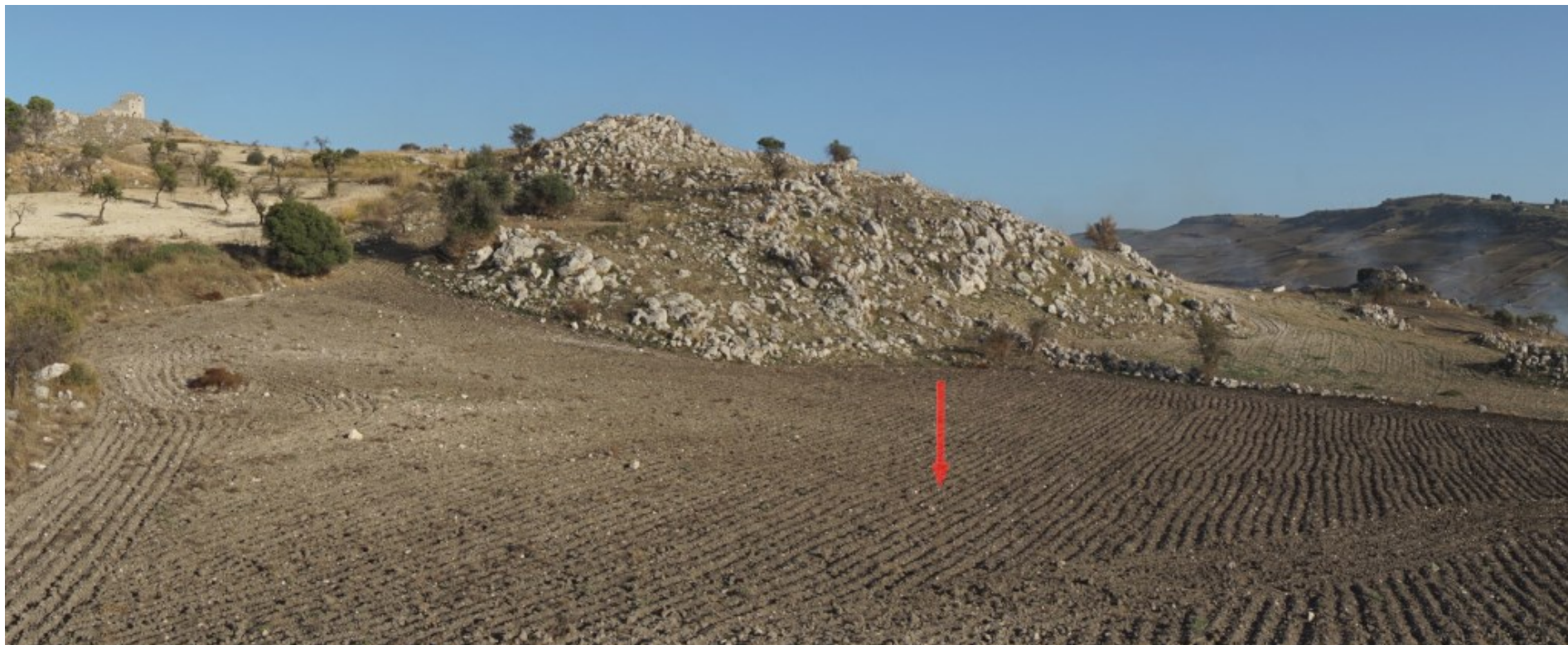
Ripresa fotografica – Stato di fatto – Localizzazione Torre 16