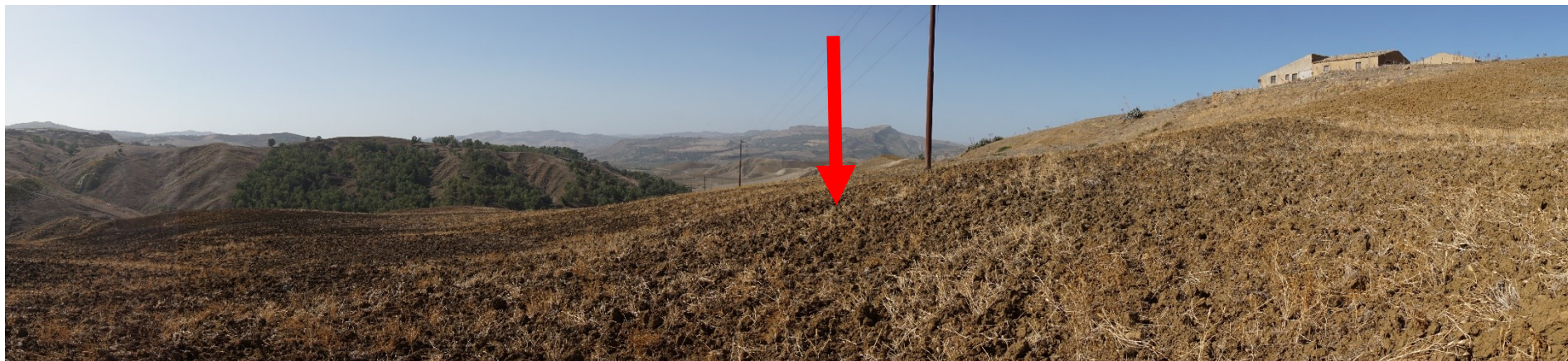
Ripresa fotografica – Stato di fatto – Localizzazione Torre 08