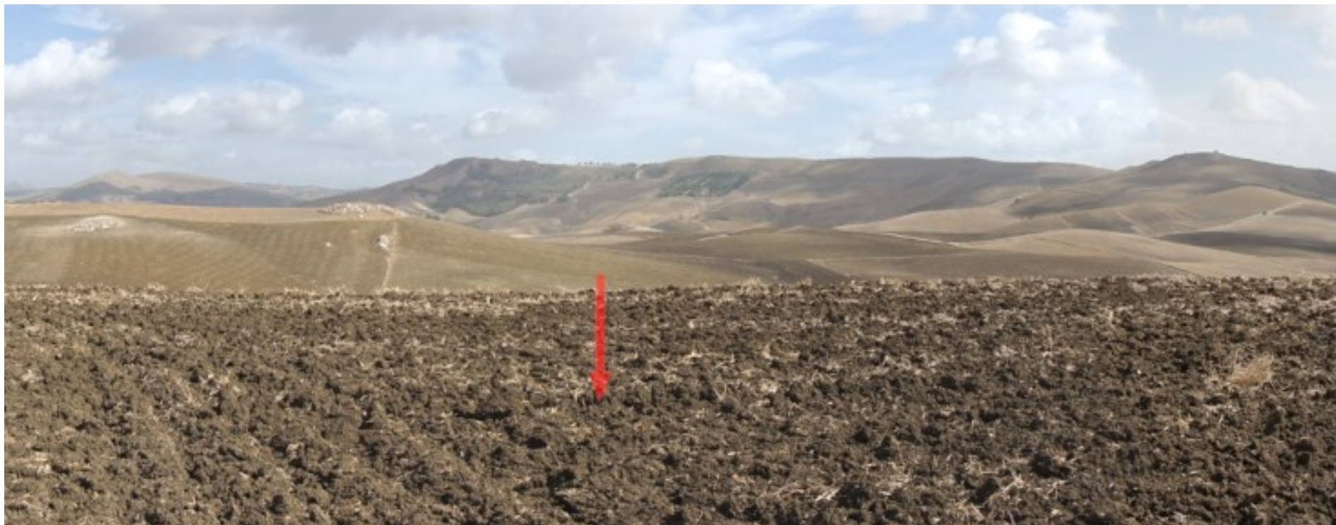
Ripresa fotografica – Stato di fatto – Localizzazione Torre 18