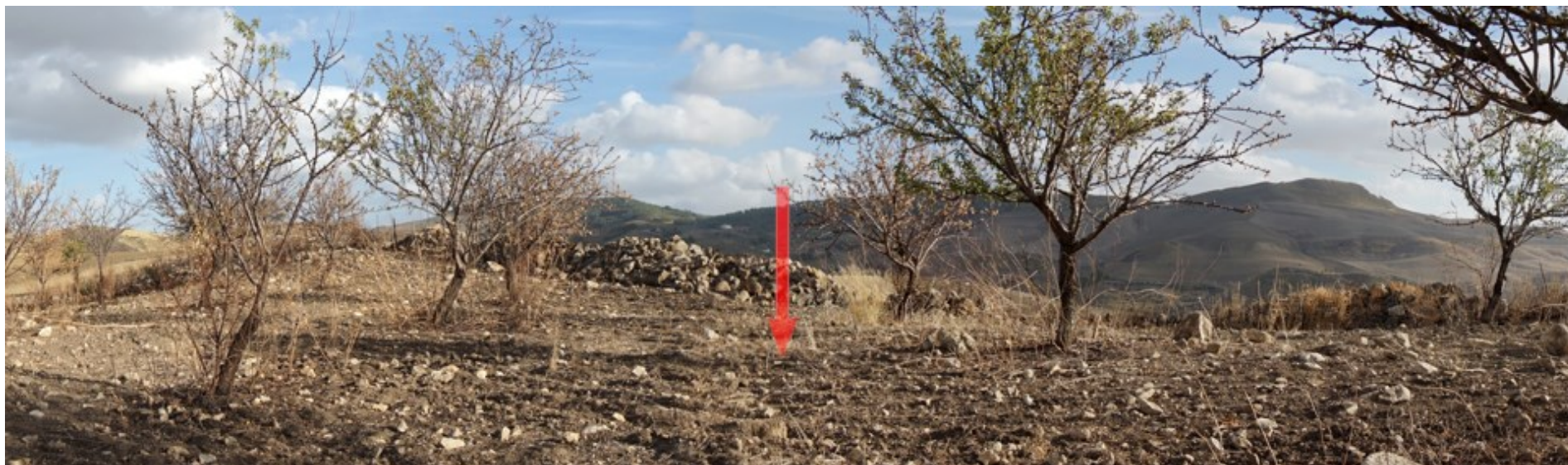
Ripresa fotografica – Stato di fatto – Localizzazione Torre 07