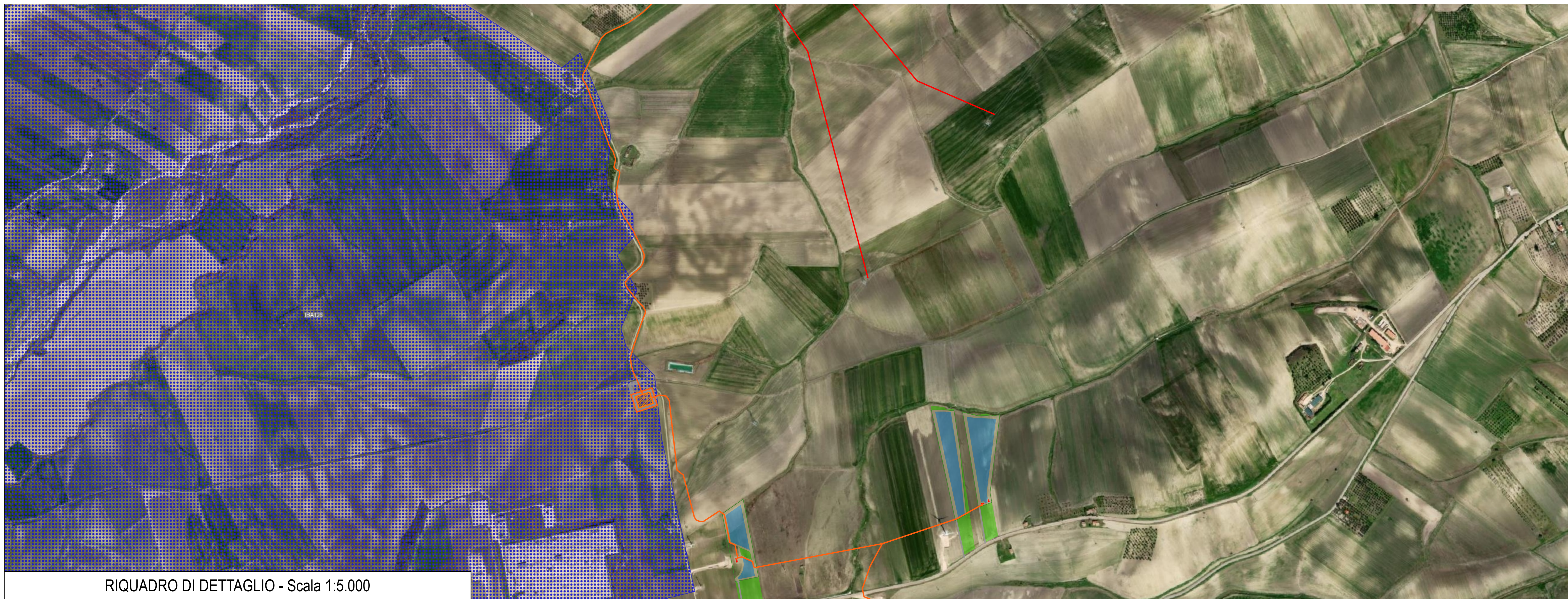
RIQUADRO DI DETTAGLIO - Scala 1:5.000