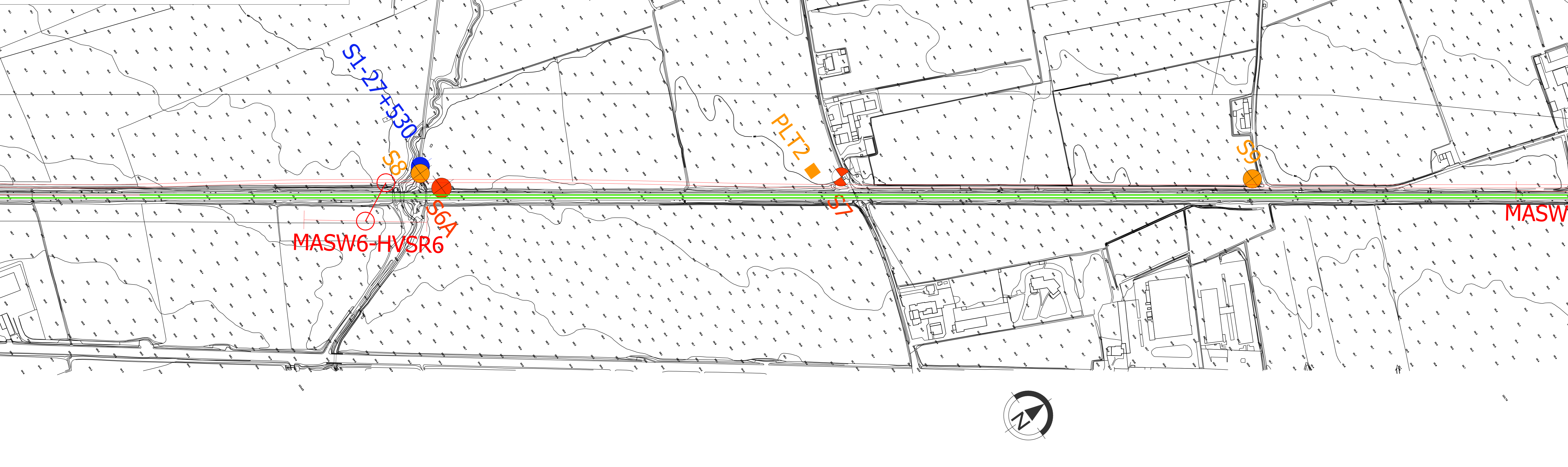
Planimetria indagine Scala 1:2000