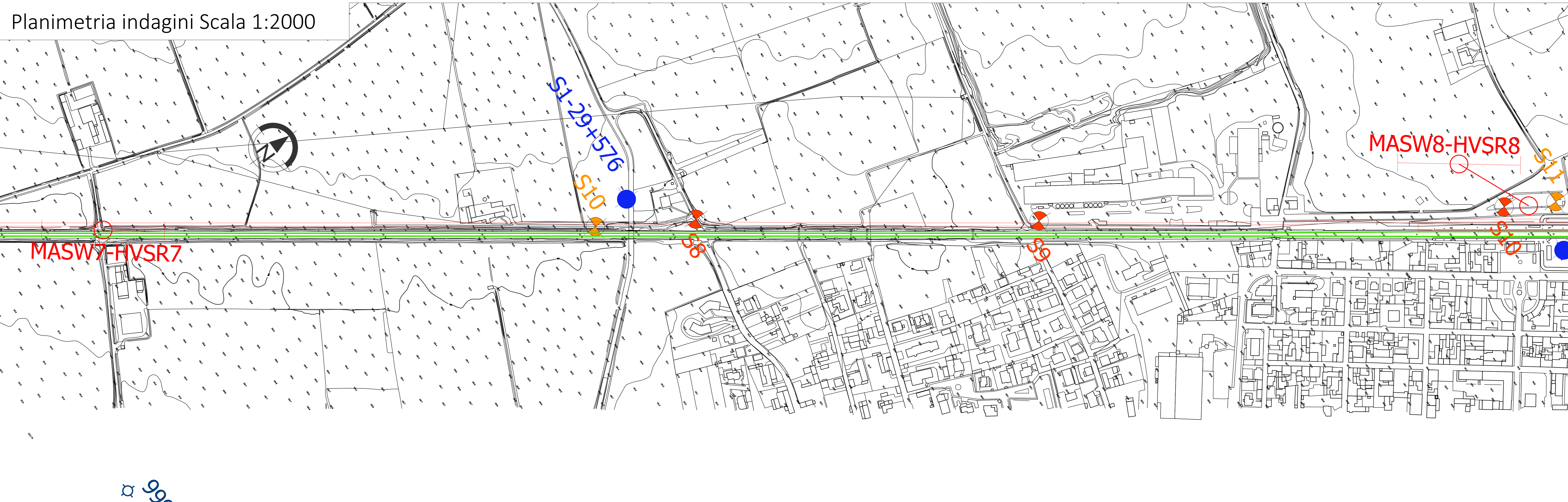
Planimetria indagine Scala 1:2000