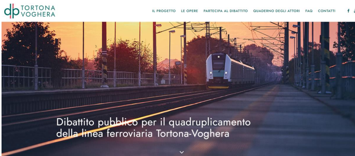
Immagine della "home" del sito internet di riferimento