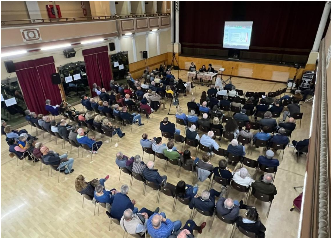
Immagine dell'incontro territoriale di Pontecurone