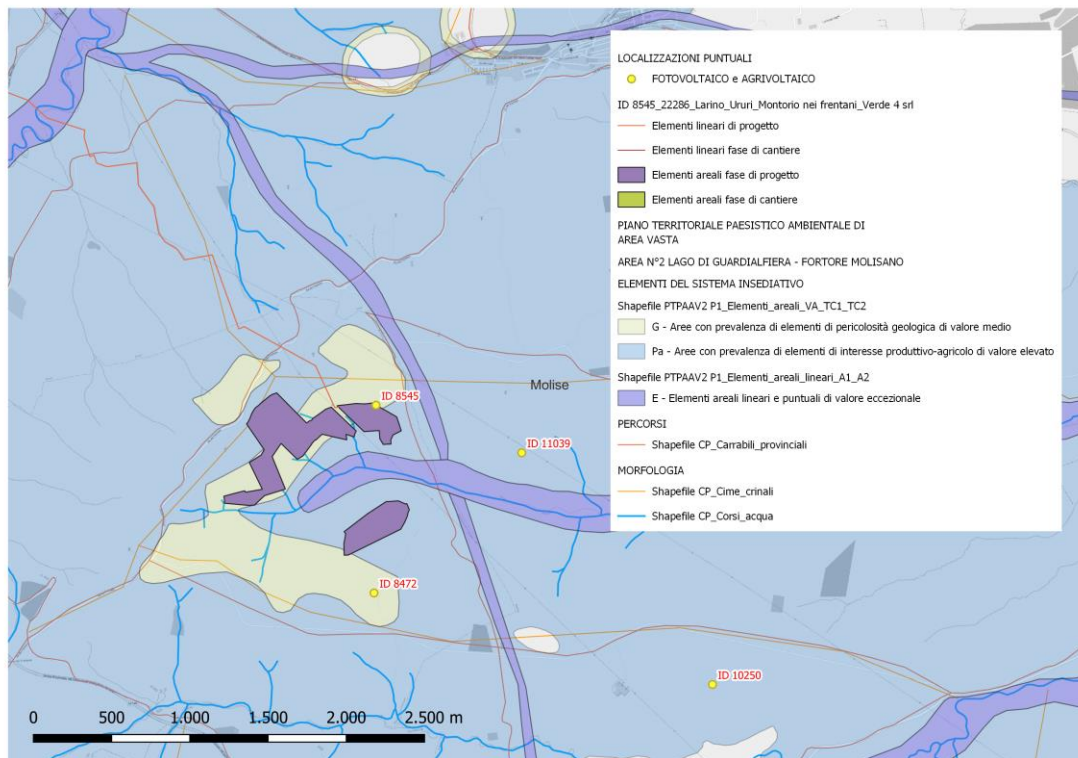
1. Elab.GIS a cura della SS-PNRR: Individuazione del progetto "Larino7" in relazione al PTPAAV n.2

CONSIDERATO che l'impianto si inserisce parzialmente in un contesto territoriale segnato dal tratturo Sant'Andrea – Biferno , sottoposto a tutela archeologica con DM 15/06/1976;