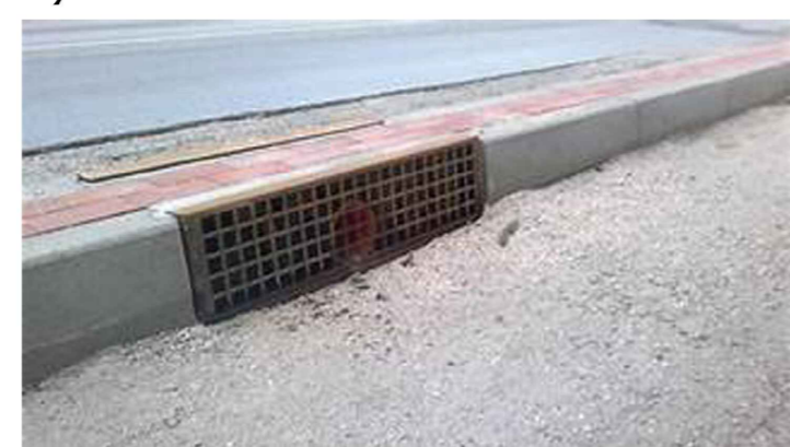
CADITOIA A MARCIAPIEDE FRONTRE STRADA

AUTOREITÀ DI SISTEMA PORTUALE DEL MAR TIRRENO CENTRALE Accordo Quadro per affidamento di servizi tecnici di Progettazione, Direzione dei Lavori e Verifica della progettazione relativi a opere portuali, strade e ferrovie, potenziamento e riqualificazione degli immobili ed interventi di sostenibilità ambientale da realizzare nelle aree di competenza dell'Autorità di Sistema Portuale del Mar Tirreno Centrale Lotto n.4 - Potenziamento e riqualificazione degli immobili Intervento di "Potenziamento e riqualificazione delle infrastrutture dell'area monumentale del porto di Napoli destinate al traffico passeggeri, alle attività portuali e di collegamento con la città - CUP - G12C2100123002 CIG-9105692EBC PROGETTO DI FATTIBILITÀ TECNICA ED ECONOMICA