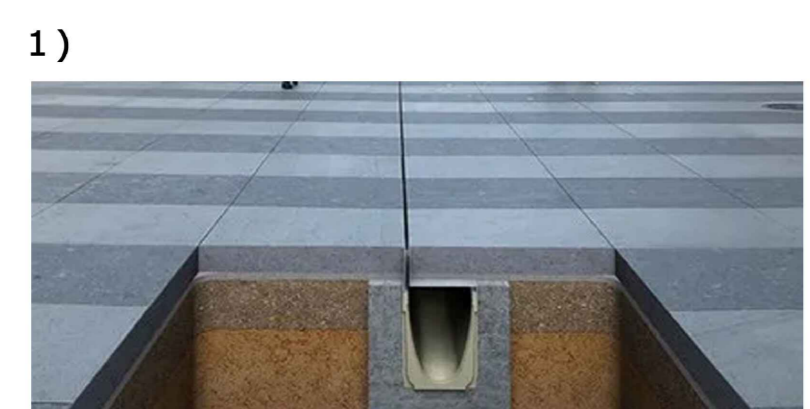
CADITOIA A FESSURA IN ACCIAIO INOX