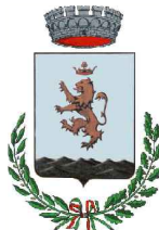
COMUNE DI ORANI