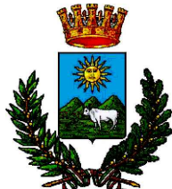
COMUNE DI NUORO