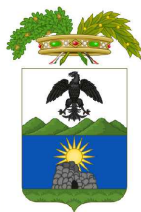
PROVINCIA DI NUORO