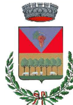
COMUNE DI ORGOSOLO