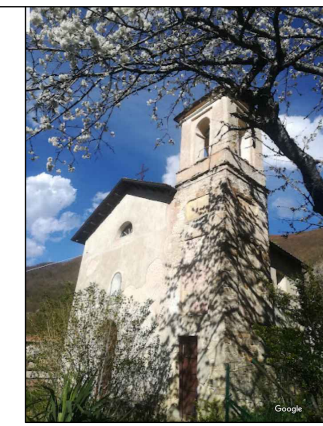
Vista direzione est - stato di fatto