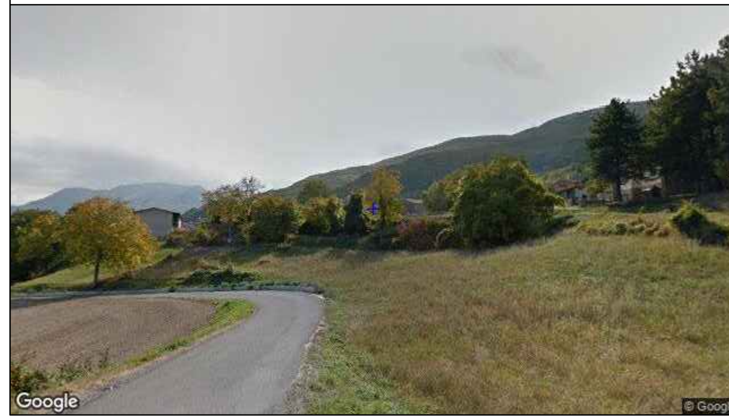
Vista direzione sud-ovest - stato di fatto