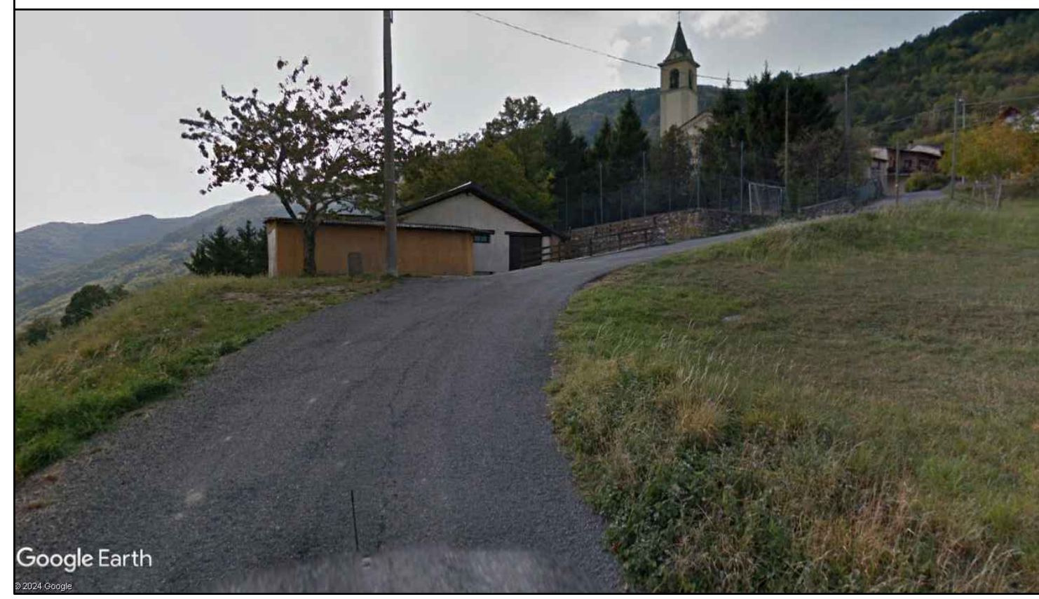
Vista generale - stato di fatto