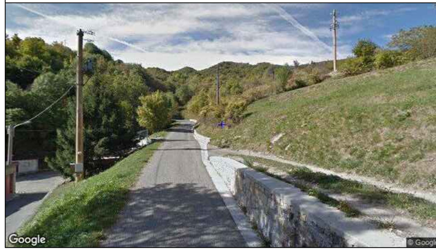
Vista direzione nord-ovest - stato di fatto