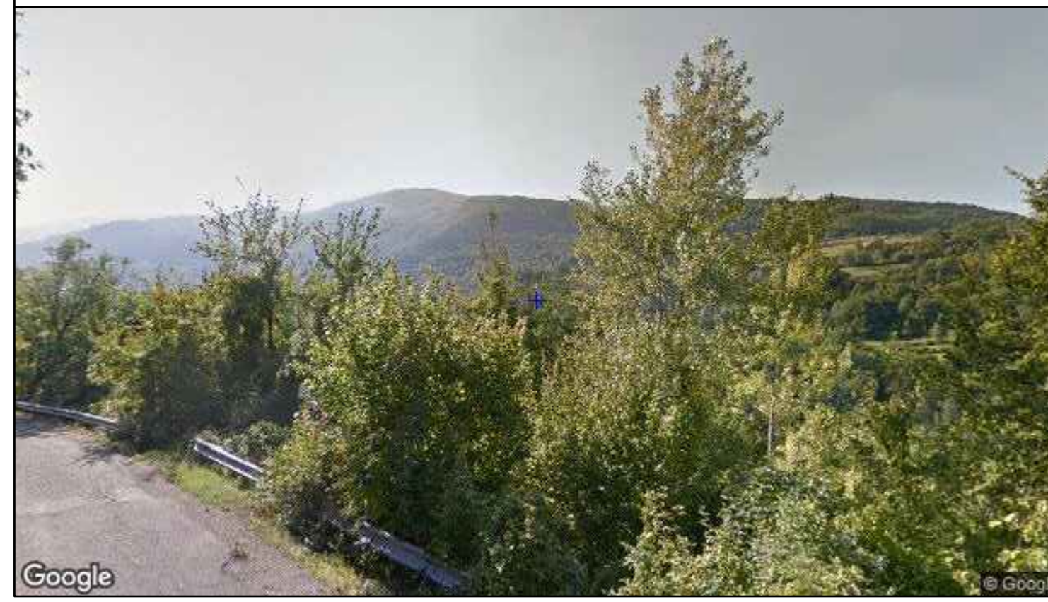
Vista direzione sud-ovest - stato di fatto