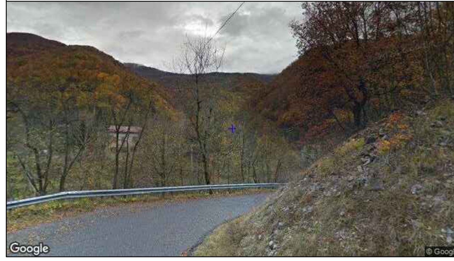
Vista direzione ovest - stato di fatto