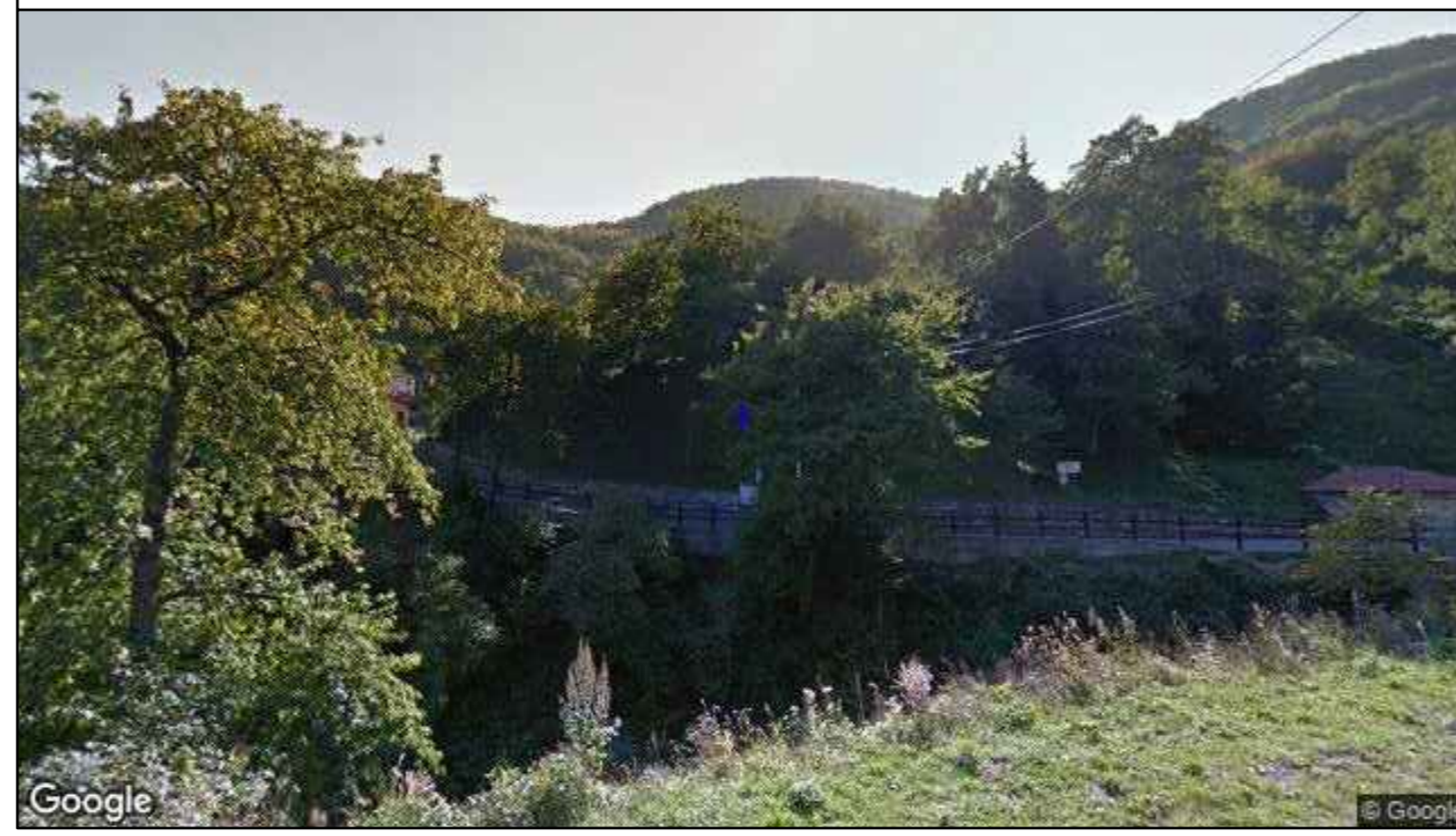
Vista direzione ovest - stato di fatto