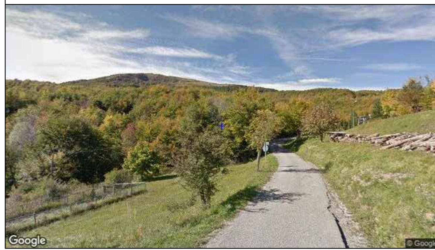
Vista direzione nord-ovest - stato di fatto