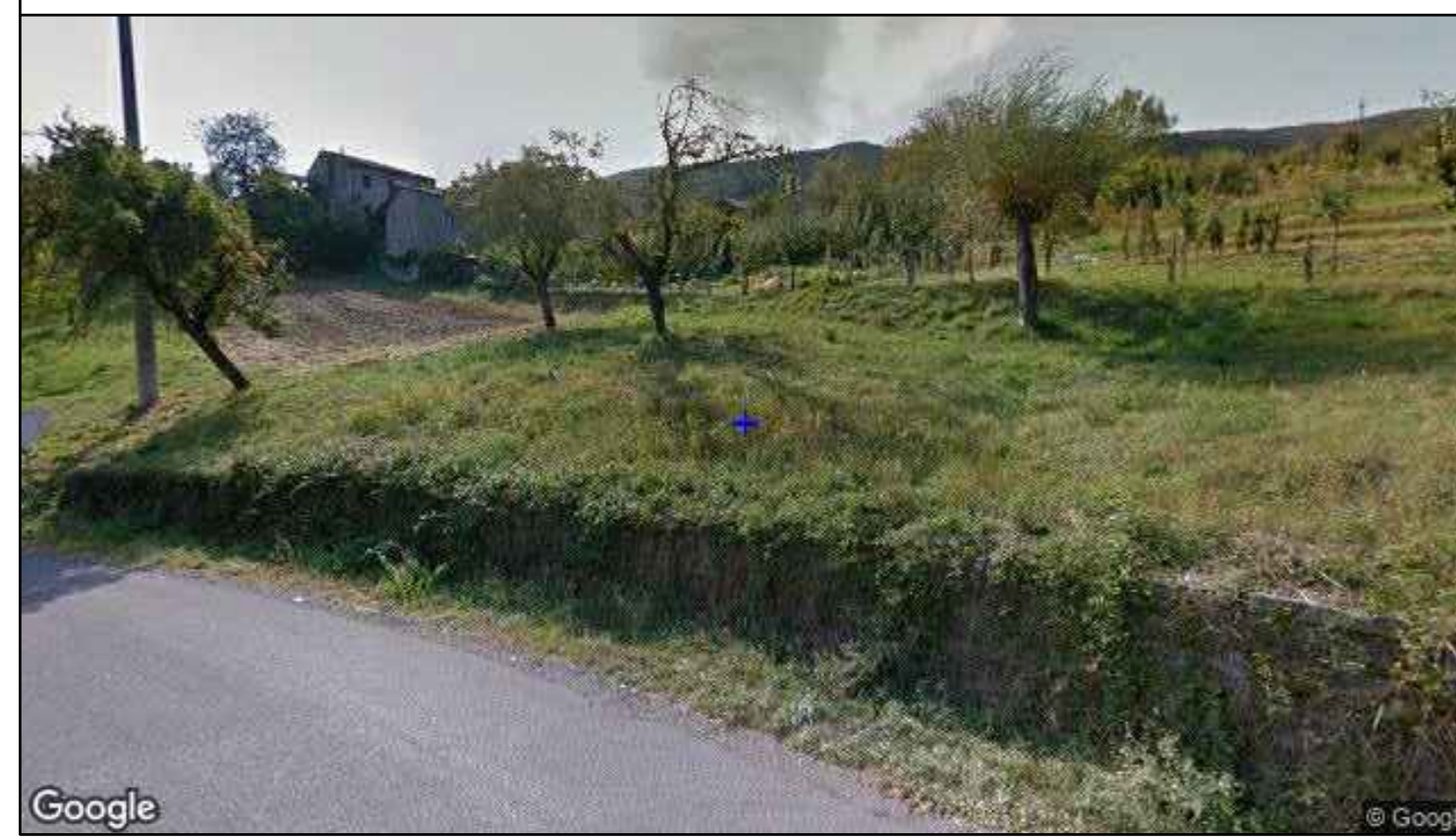
Vista direzione sud-ovest - stato di fatto