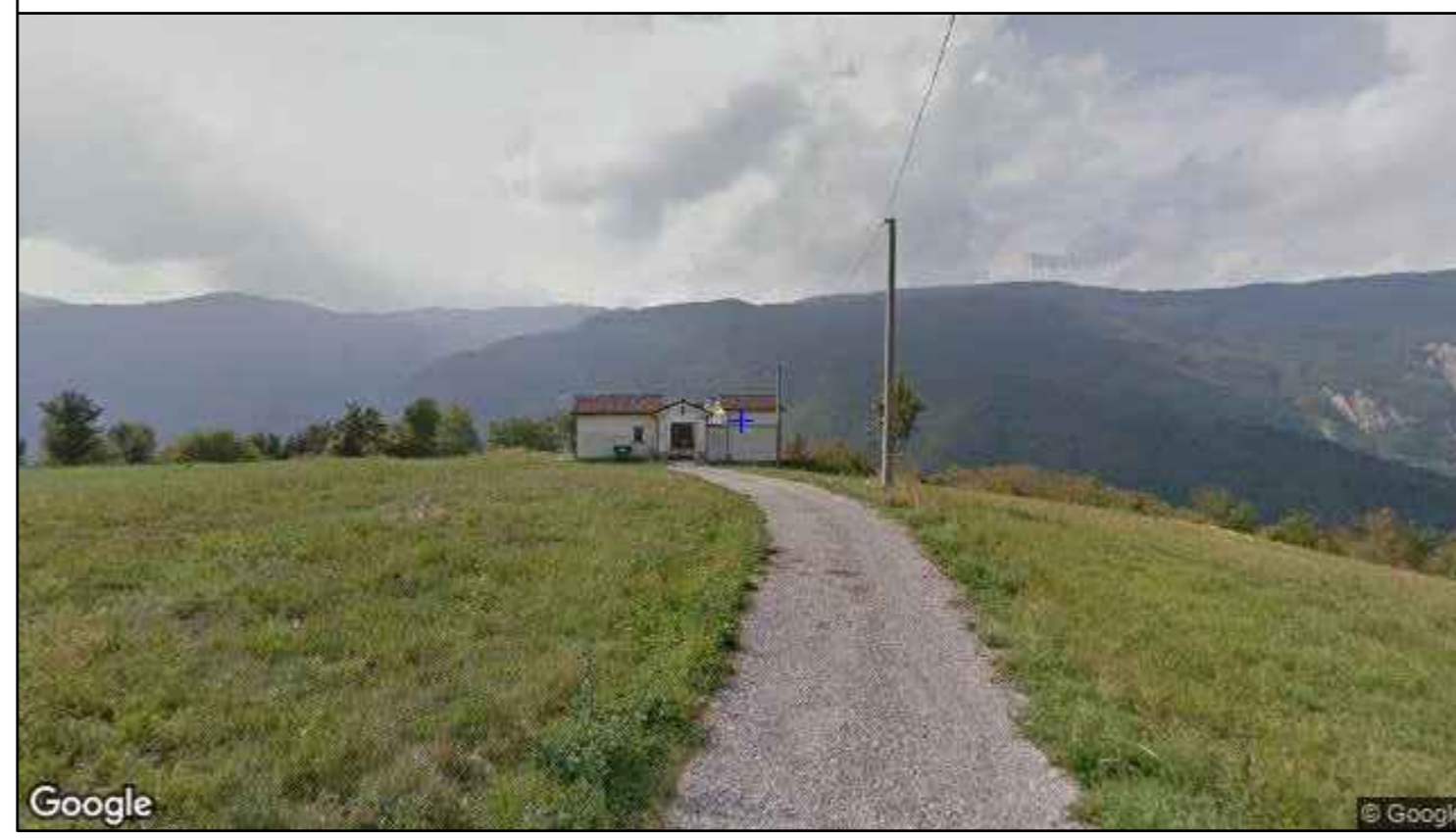
Vista direzione ovest - stato di fatto