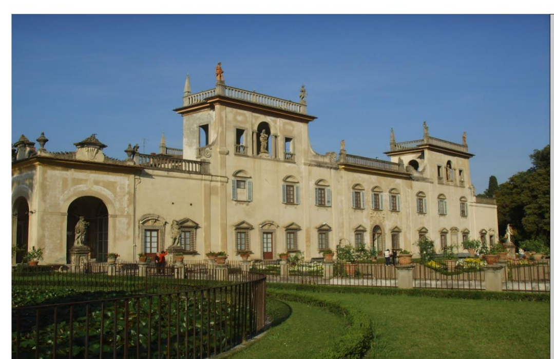
4. VILLA SALVATI GUICCARDINI