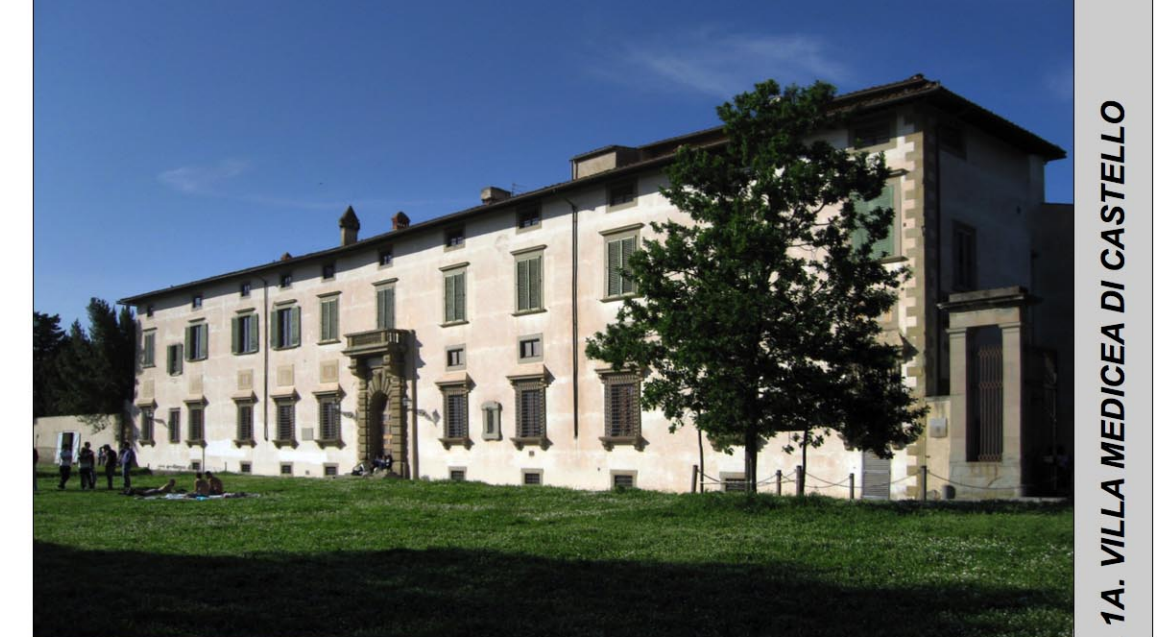
1B. VISUALE DALLA VILLA MEDICEA DI C. A. VILLA MEDICEA DI CASTELLO