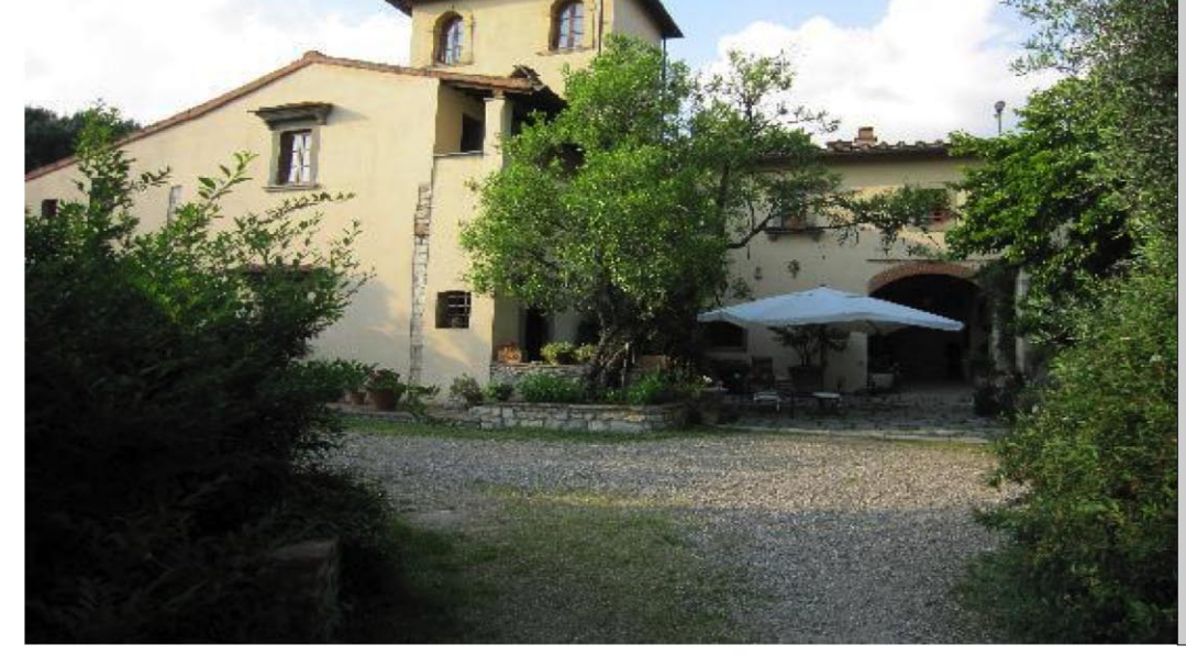
12. VILLA IL PARADISINO