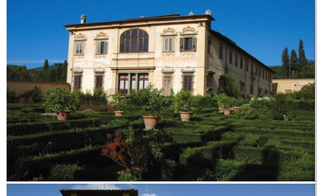
9. VILLA CORSINI