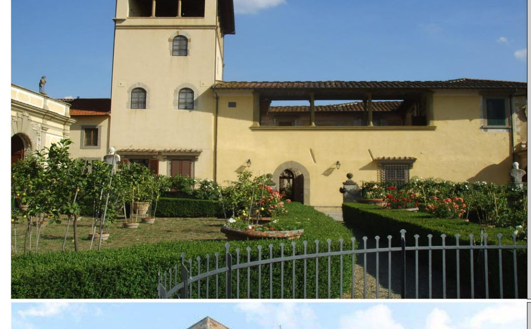
10. VILLA IL POZZINO