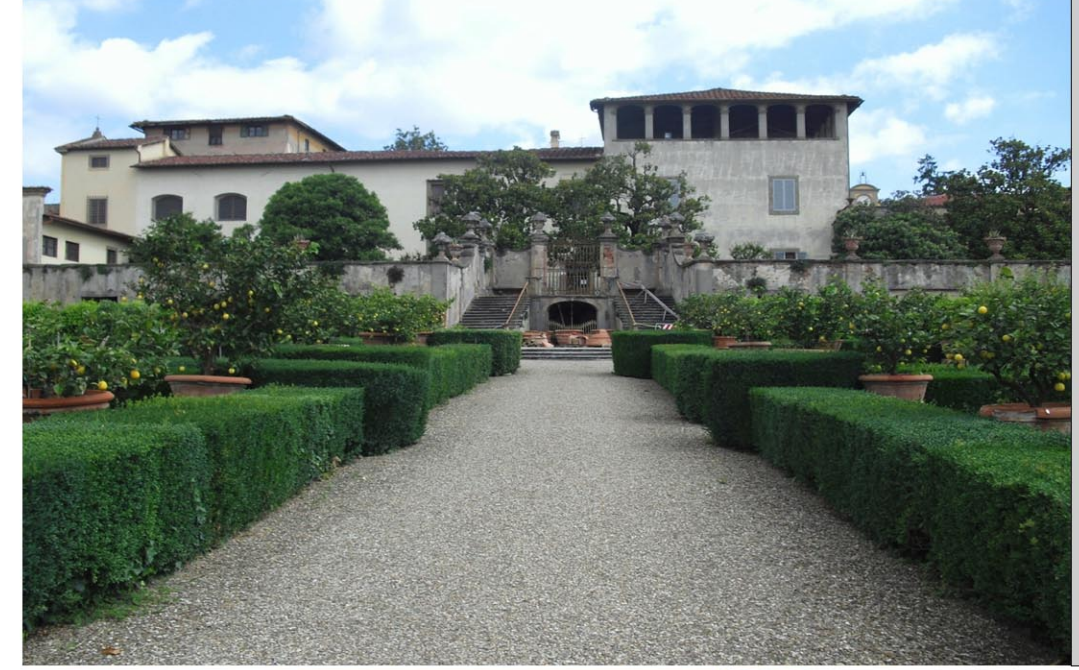
5. VILLA LA QUIETE