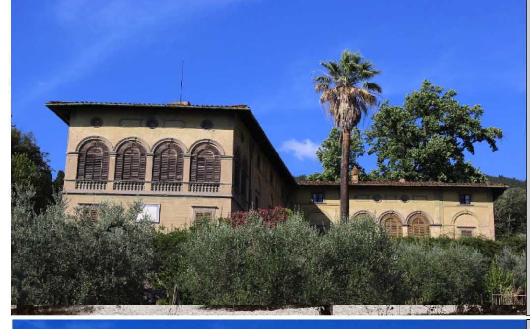
7. VILLA GINORIA DOZZA