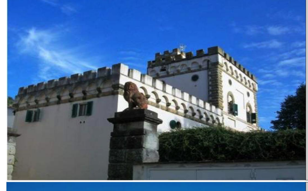
8. VILLA FOSSI PAOLI