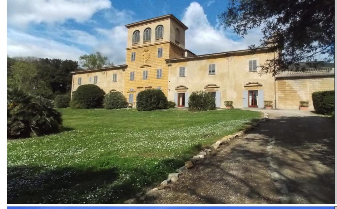
6. VILLA GERINI