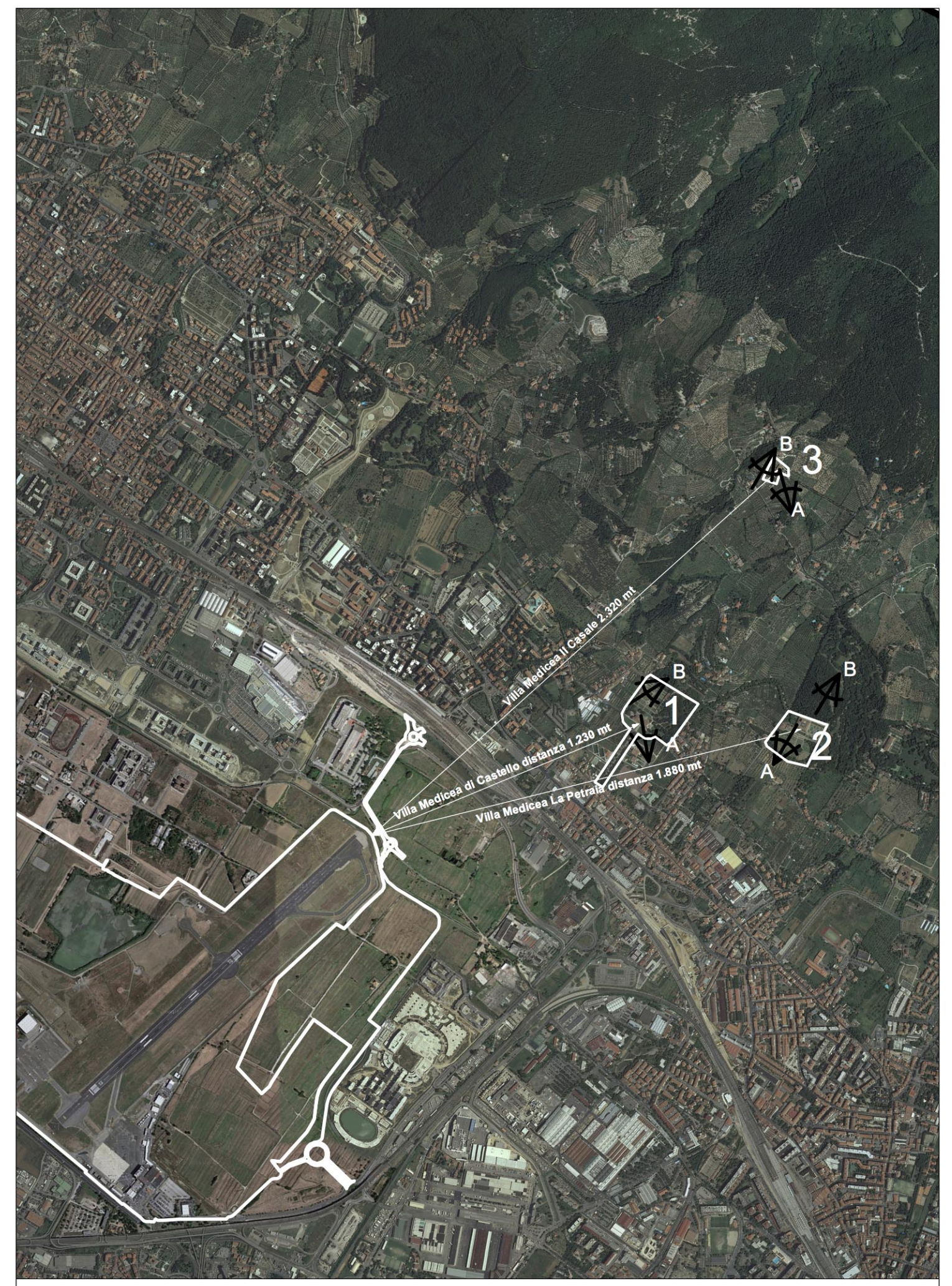
FOTO DI BENI VINCOLATI VISUALI DAI BENI VINCOLATI