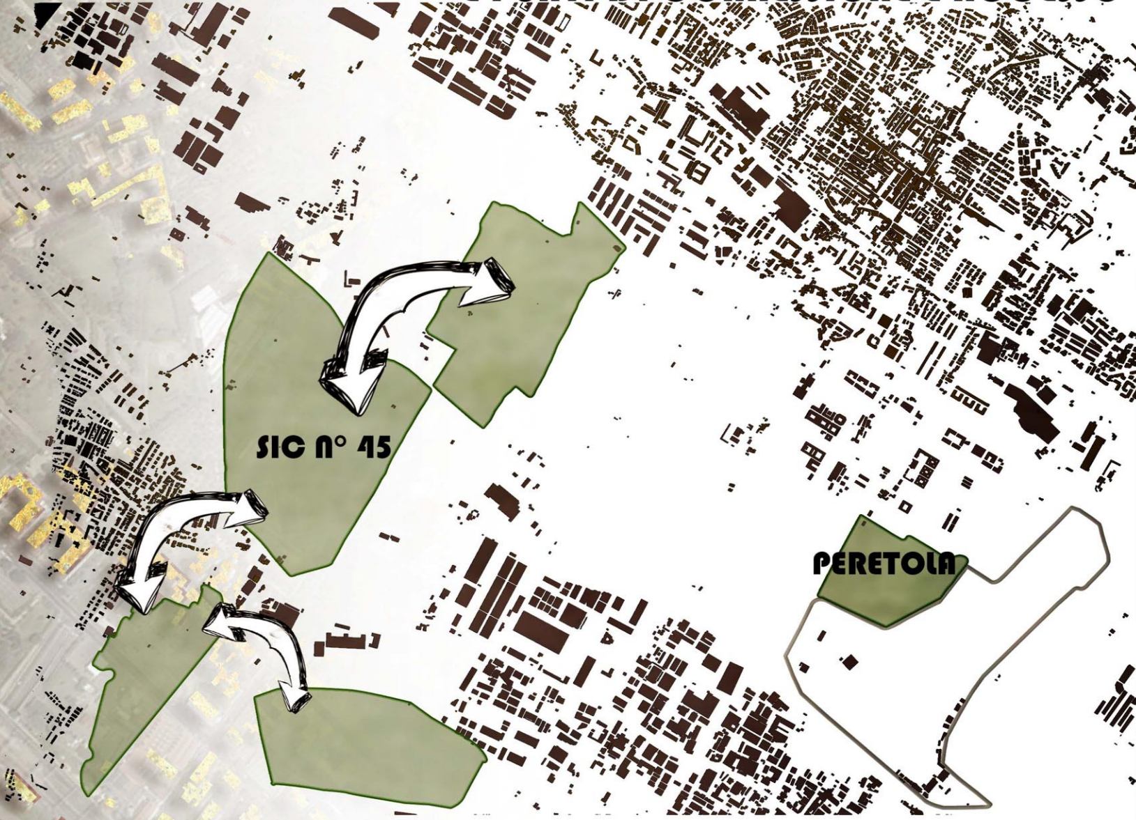
CONTINUITA' DEL SISTEMA DELLE AREE SIC