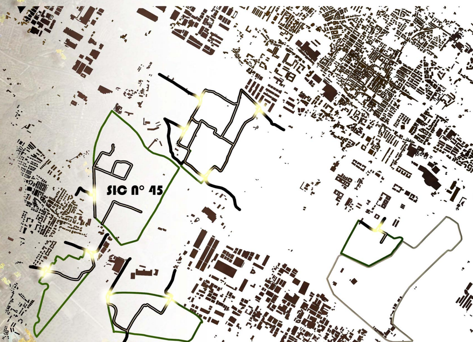
PERCORSI PROMISCUI CARRABILI-CICLOPEDONALI E PUNTI DI CONNESSIONE E ACCESSO