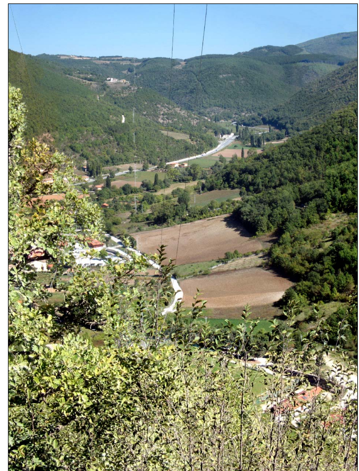
Panoramica 04 - Stato di fatto

TRACCIATO LINEA CAPPUCCINI-CAMERINO ESISTENTE CAPPUCCINI-CAMERINO