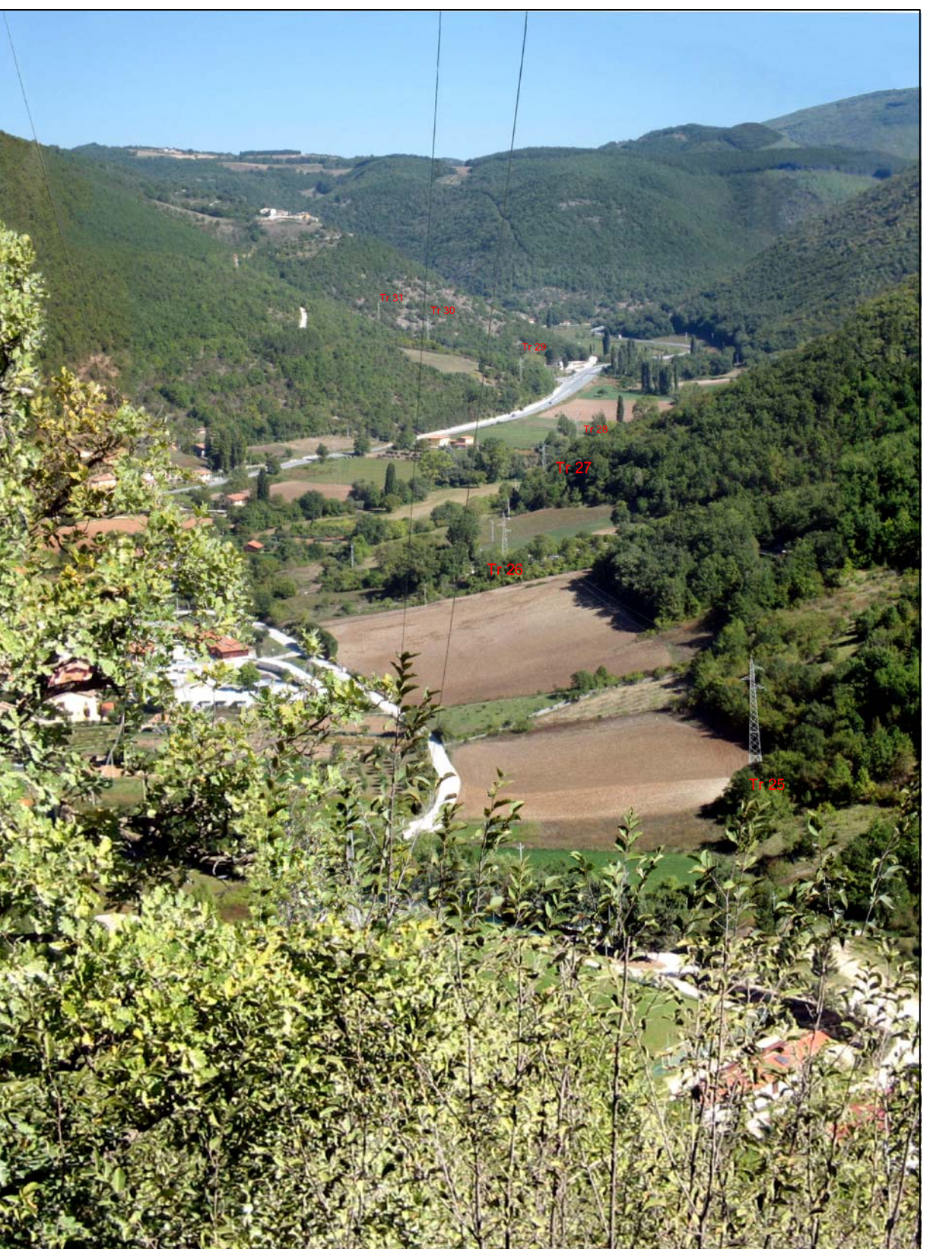
Panoramica 04 - Fotosimulazione del progetto