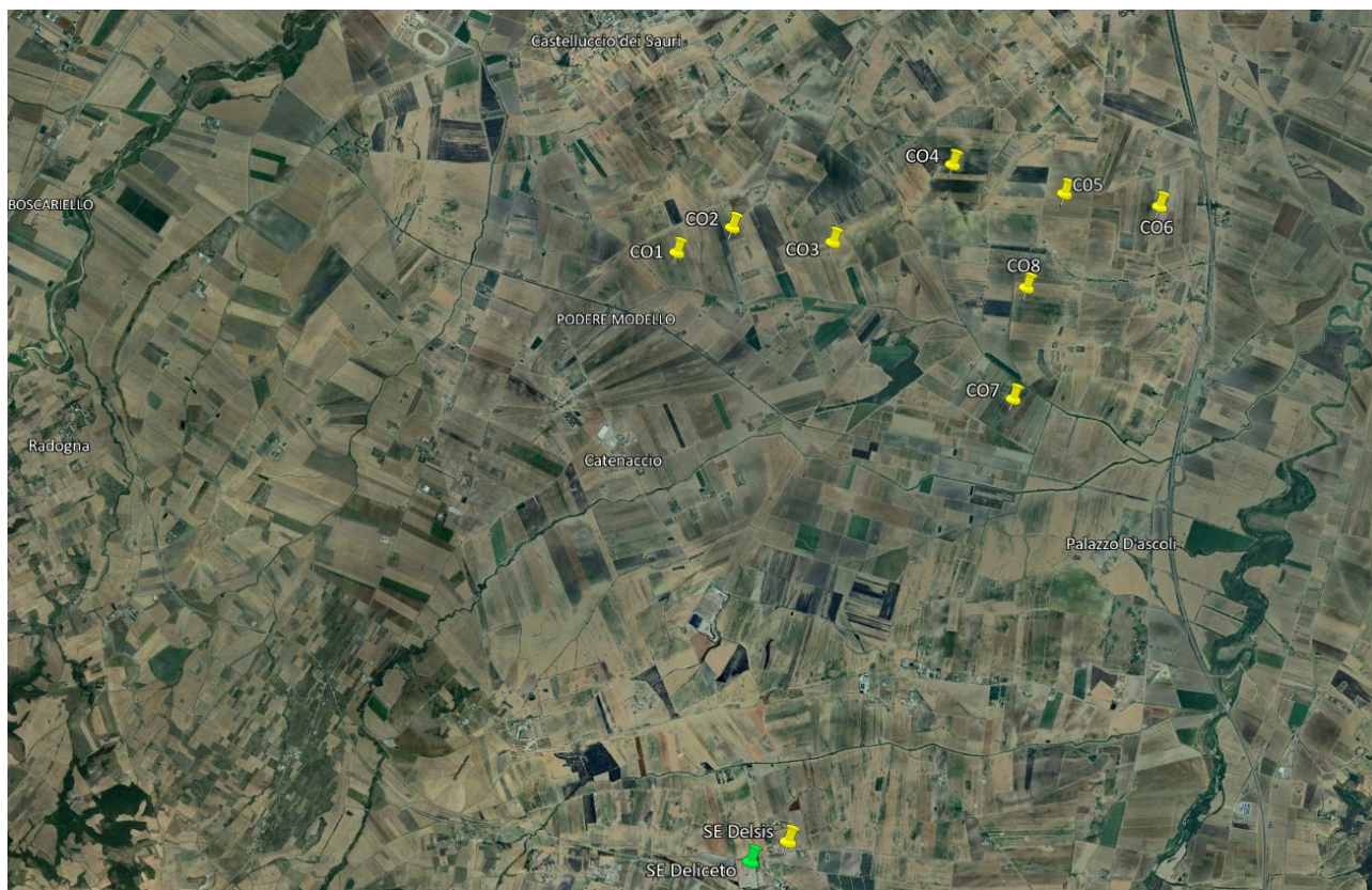
Figura 2 – Inquadramento territoriale del progetto (2/2)