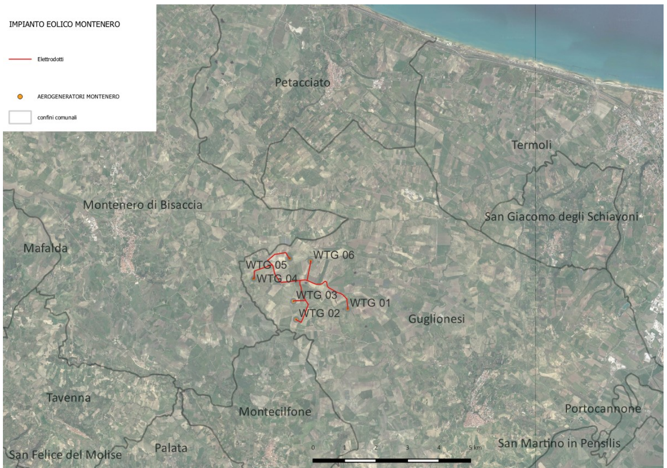
Figura 1 aerofoto ambito territoriale area d'impianto

Il territorio interessato dalle strutture principali del parco eolico in progetto (gli aerogeneratori con piazzole e strutture accessorie e la rete del cavidotto MT interno al parco), come già accennato in premessa, ricade all'interno del comune di Guglionesi.