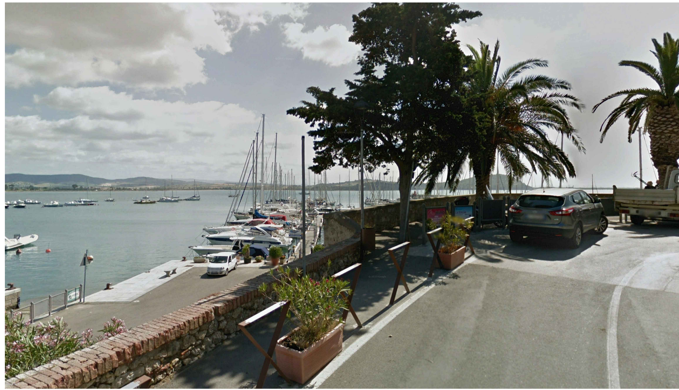
CENTRO URBANO DI TALAMONE - FOTOINSERIMENTO - STATO ATTUALE