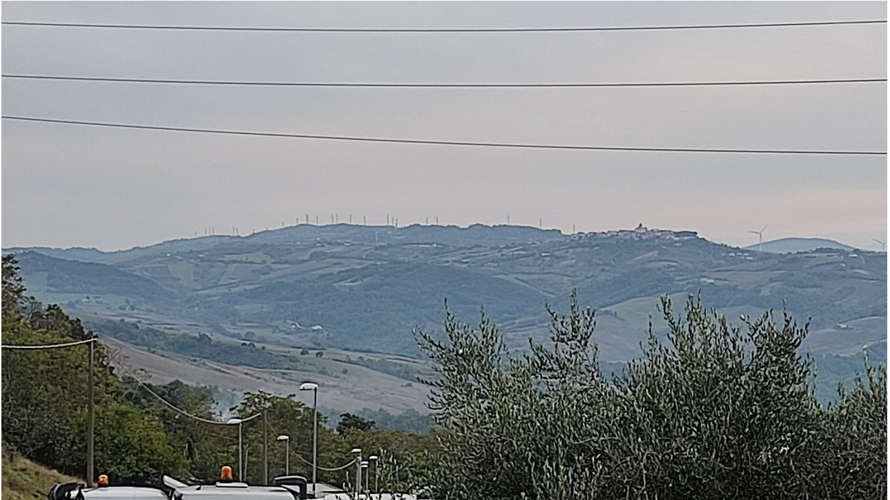
Punto di presa n° 1 - Stato di Fatto