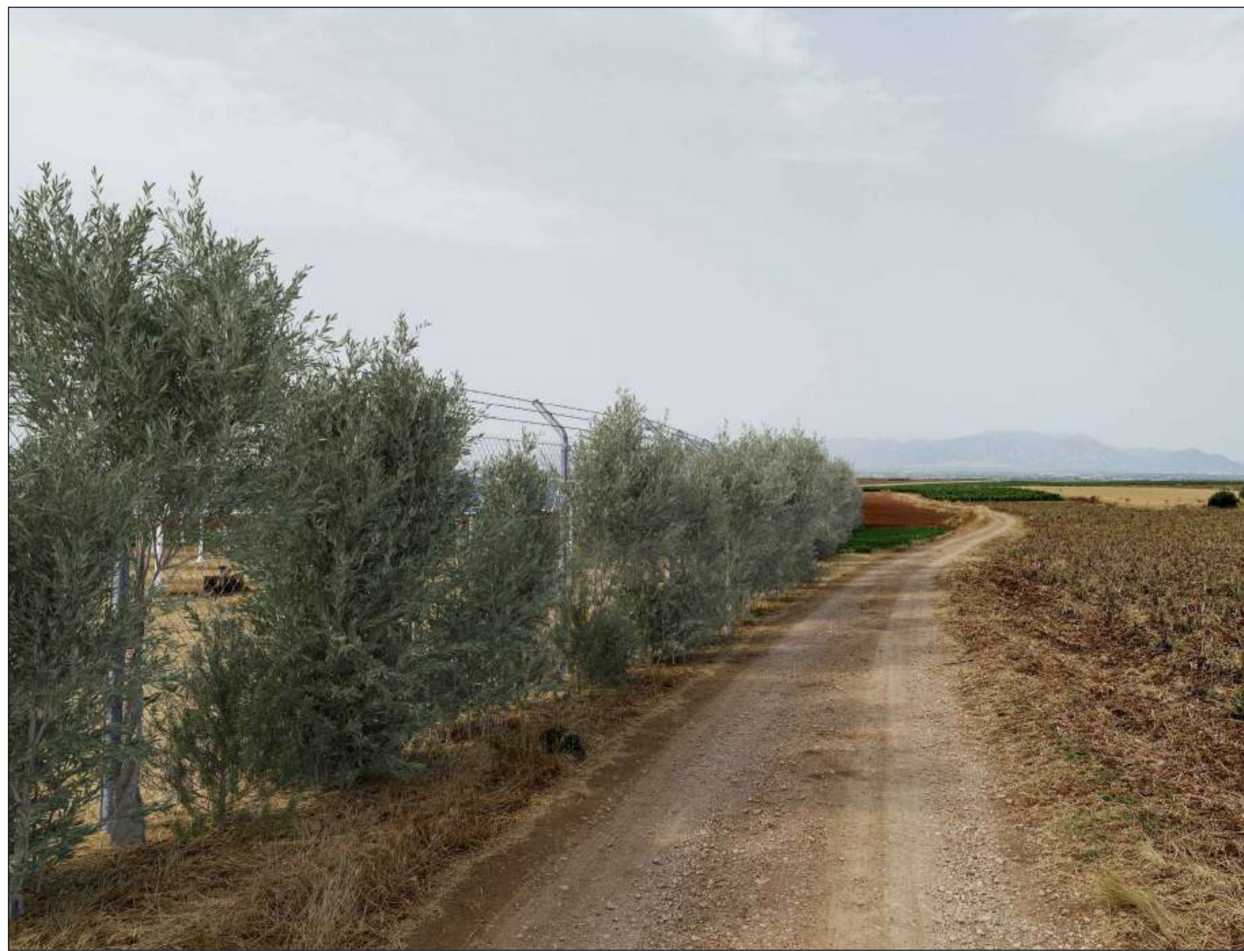
FOTOINSERIMENTO PUNTO VISTA CON MITIGAZIONE IMPATTO VISIVO