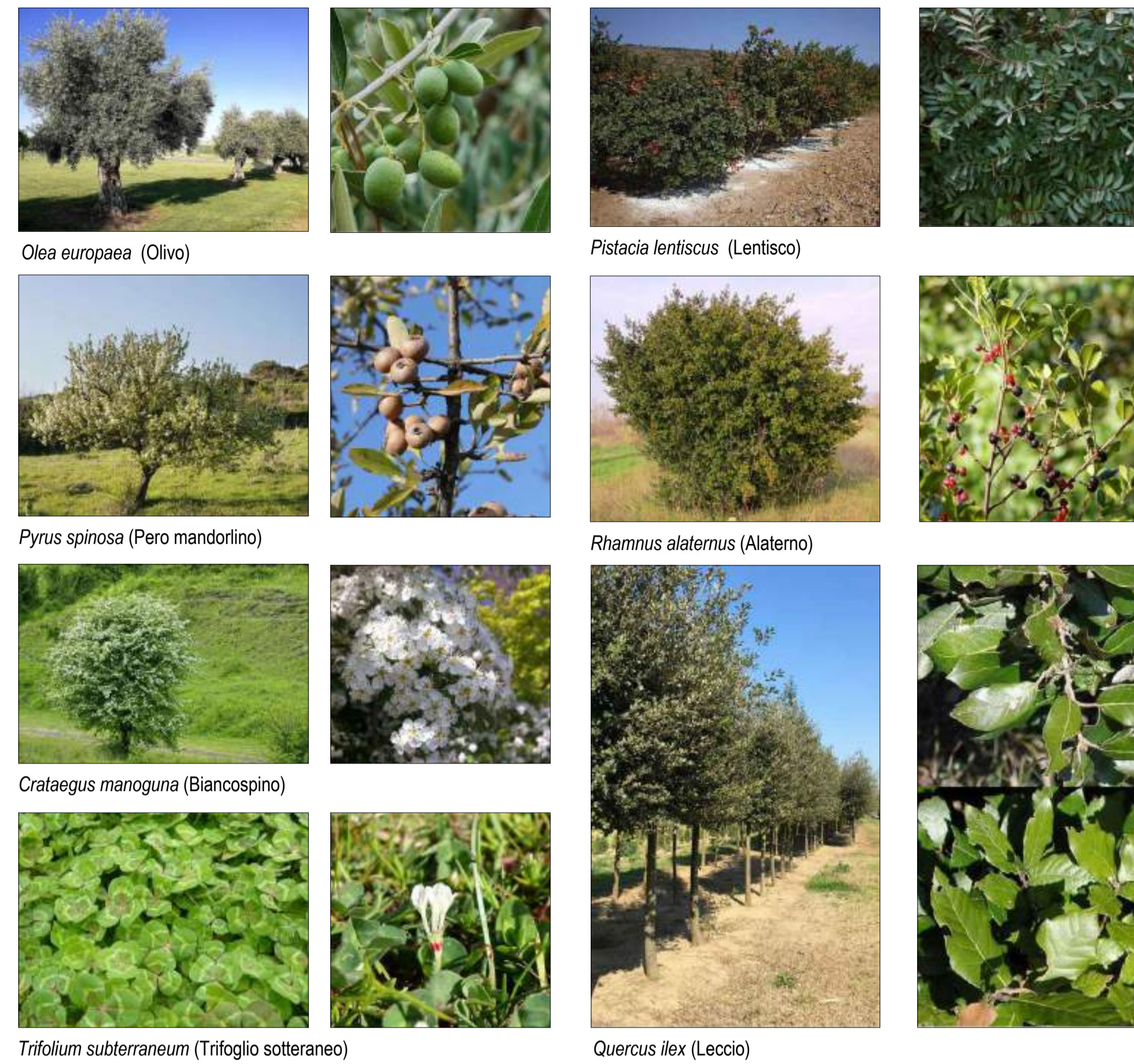
ESEMPI DELLE POSSIBILI SPECIE ARBOREE E ARBUSTIVE