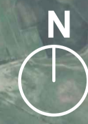
INQUADRAMENTO LAYOUT E ELETTRODOTTO SU BASE ORTOFOTO