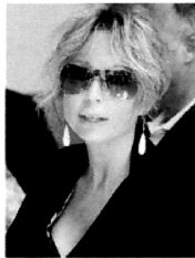
PRIMOGENITA Marina Berlusconi

zato da Raffaele Fitto a Bari. Con lui, per la prima volta, ci saranno tutti i 5 capolista azzurri. Conferma poi la presenza domenica alla trasmissione Virus su Raidue e al programma di Lucia Annunziata. L'incontro con i vertici di Forza Italia è servito poi per fare il punto della situazione su alcuni dossier aperti, uno su tutti quello