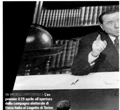
IN VIDEOCONFERENZA L'ex premier il 29 aprile all'apertura della campagna elettorale di Forza Italia al Lingotto di Torino