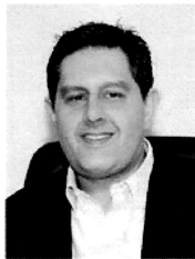
IL CONSIGLIERE Giovanni Toti

ROMA. Un blitz nella Capitale per riunire il vertice del partito e fare il punto della situazione prima di ritirarsi nella campagna elettorale. Silvio Berlusconi, che trascorrerà buona parte del primo maggio a palazzo Grazioli a registrare spot ed interviste, lo ha ribadito anche al vertice del suo partito: se i giudici pensano di fermarmi non autorizzandomi ad andare in giro a fare i comizi si sbagliano. Triplicherò le mie presenze in televisione e sarò presente anche se solo con i videomessaggi ad ogni evento di Forza Italia. L'umore non è certo dei migliori. I sondaggi confermano una lieve crescita del partito, ma i numeri di una volta sono un miraggio. A questo si aggiunge la rabbia per essere limitato non solo nei movimenti, ma anche negli interventi pubblici. Il rischio di essere «ammonito» dal tribunale che si occupa del suo affido ai servizi sociali per quanto detto sulla magistratura non sembra intormentito e a nulla sarebbero serviti i consigli del vertice del suo partito: gli elettori - e il senso del suo ragionamento - hanno il diritto di sapere la verità su quello che mi è accaduto. Insomma nessuna intenzione di abbassare i toni come conferma anche il suo consigliere politico: «Mentre il governo fa propaganda - accusa Toti - al presidente Berlusconi è impedito di fare alcuni comizi. Questa è una campagna elettorale falsata».