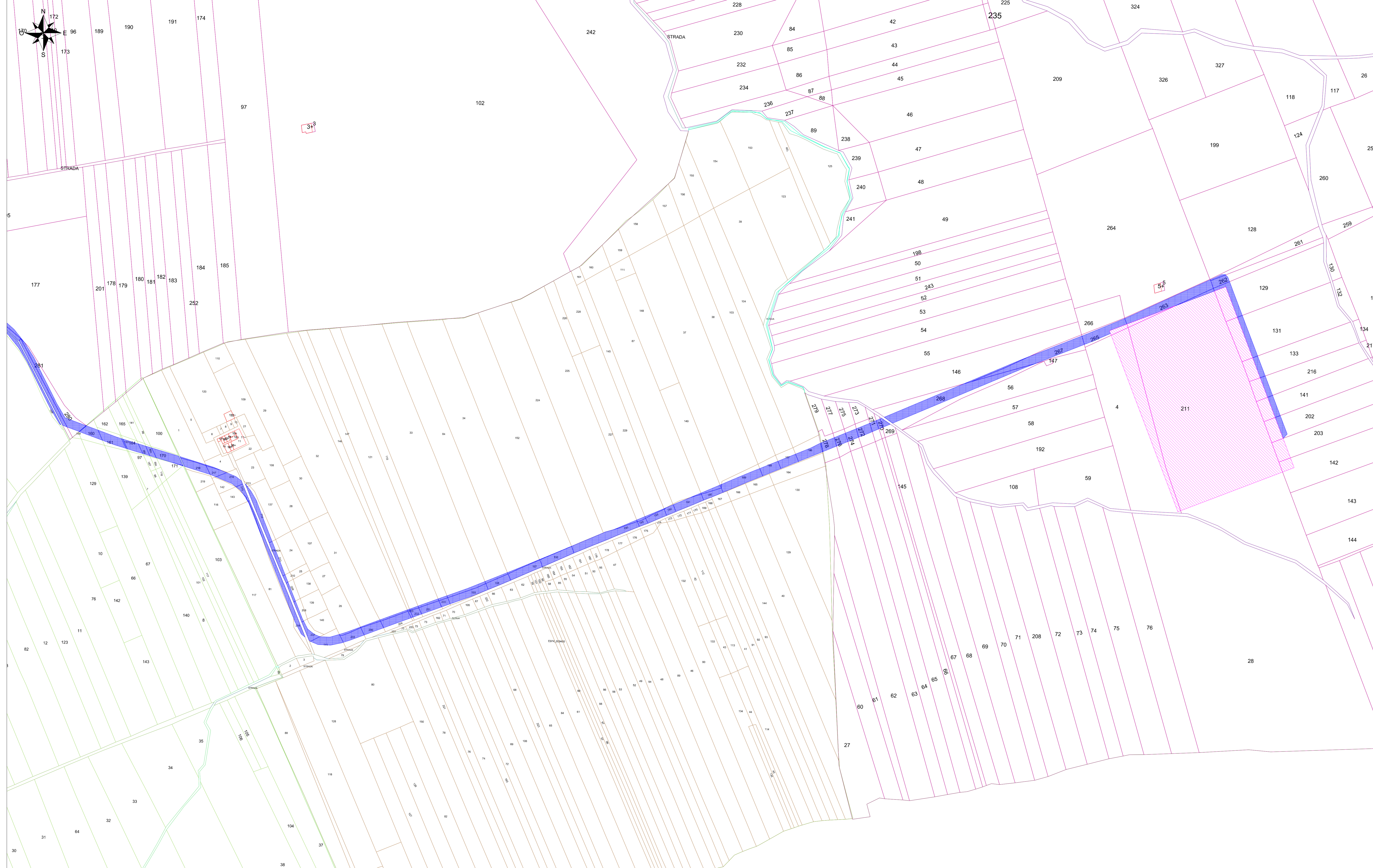
Inquadramento vista E - Scala 1:2000