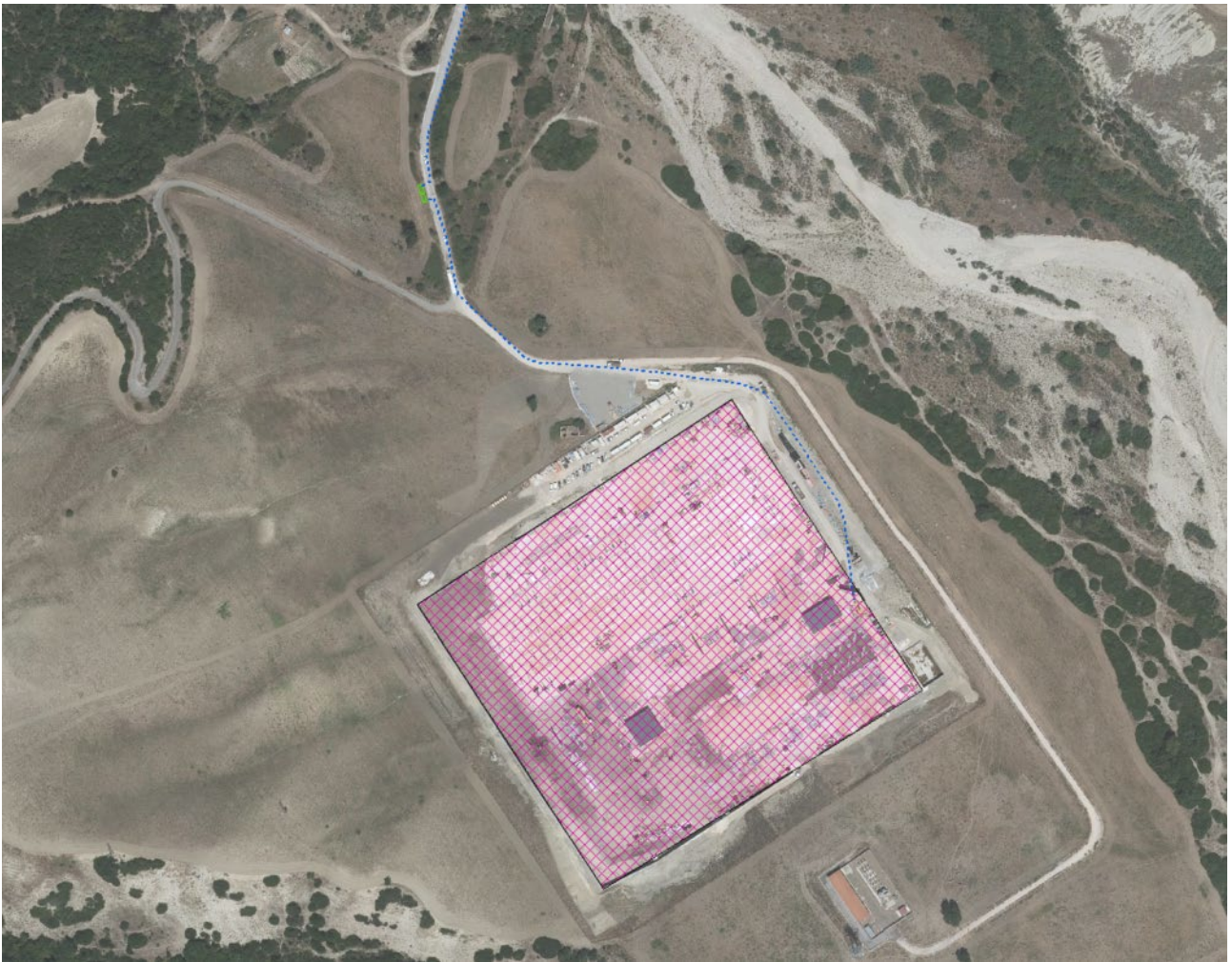
Figura 2 -Ipotesi posizionamento futura SE-Terna (in viola), in verde posizionamento Stazione di Consegna