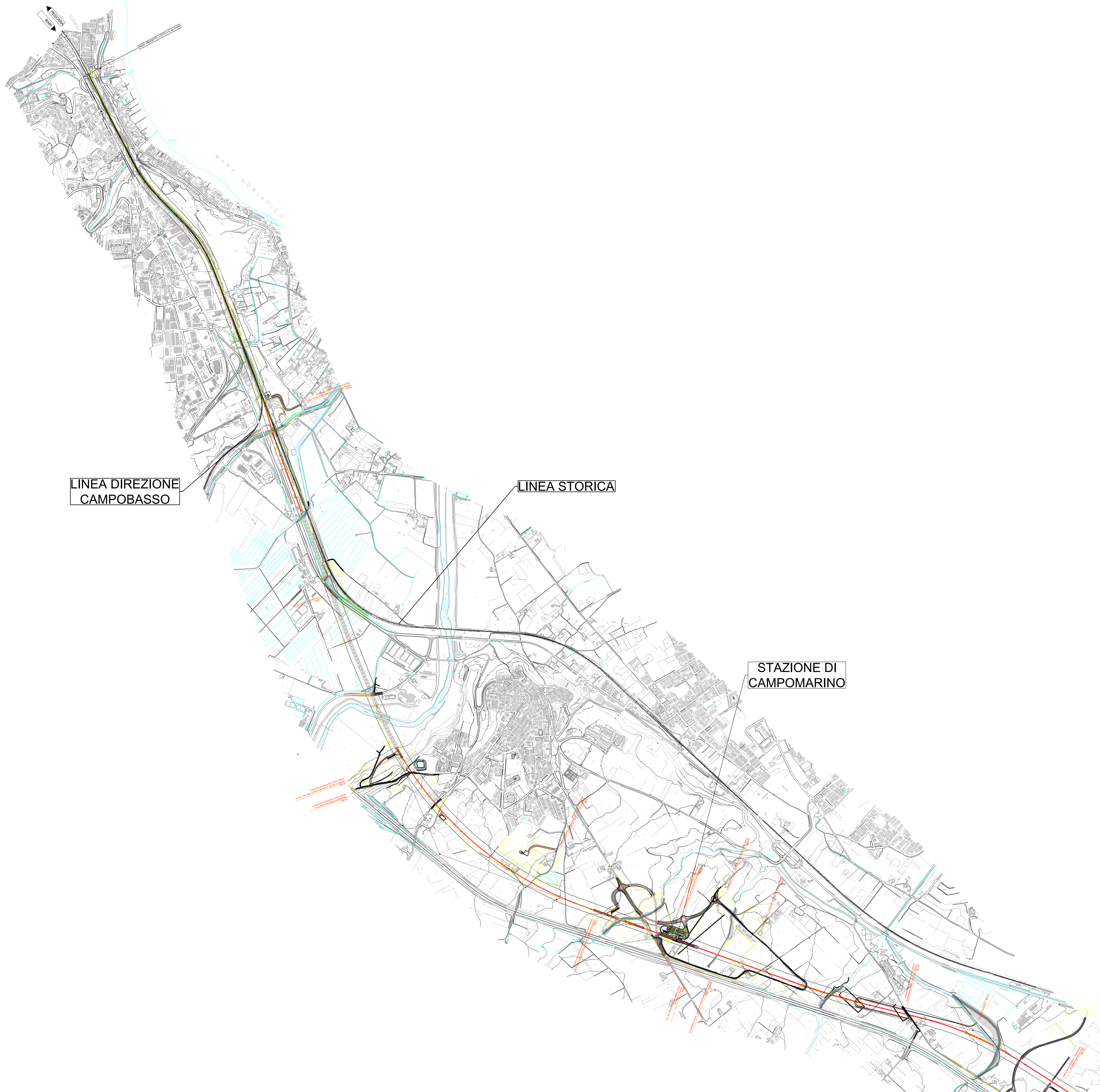
Key plan di progetto