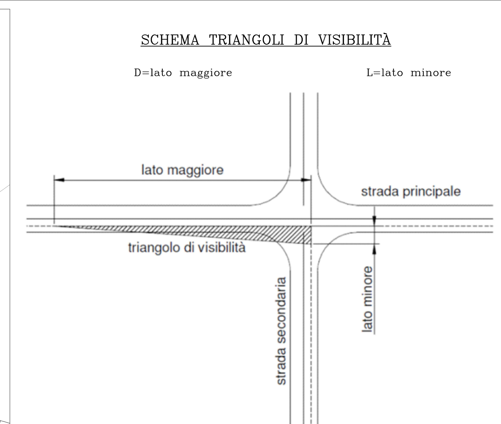
TABELLA RIEPILOGATIVA CON CARATTERISTICHE DELLE INTERSEZIONI E DEI RELATIVI TRIANGOLI DI VISIBILITÀ