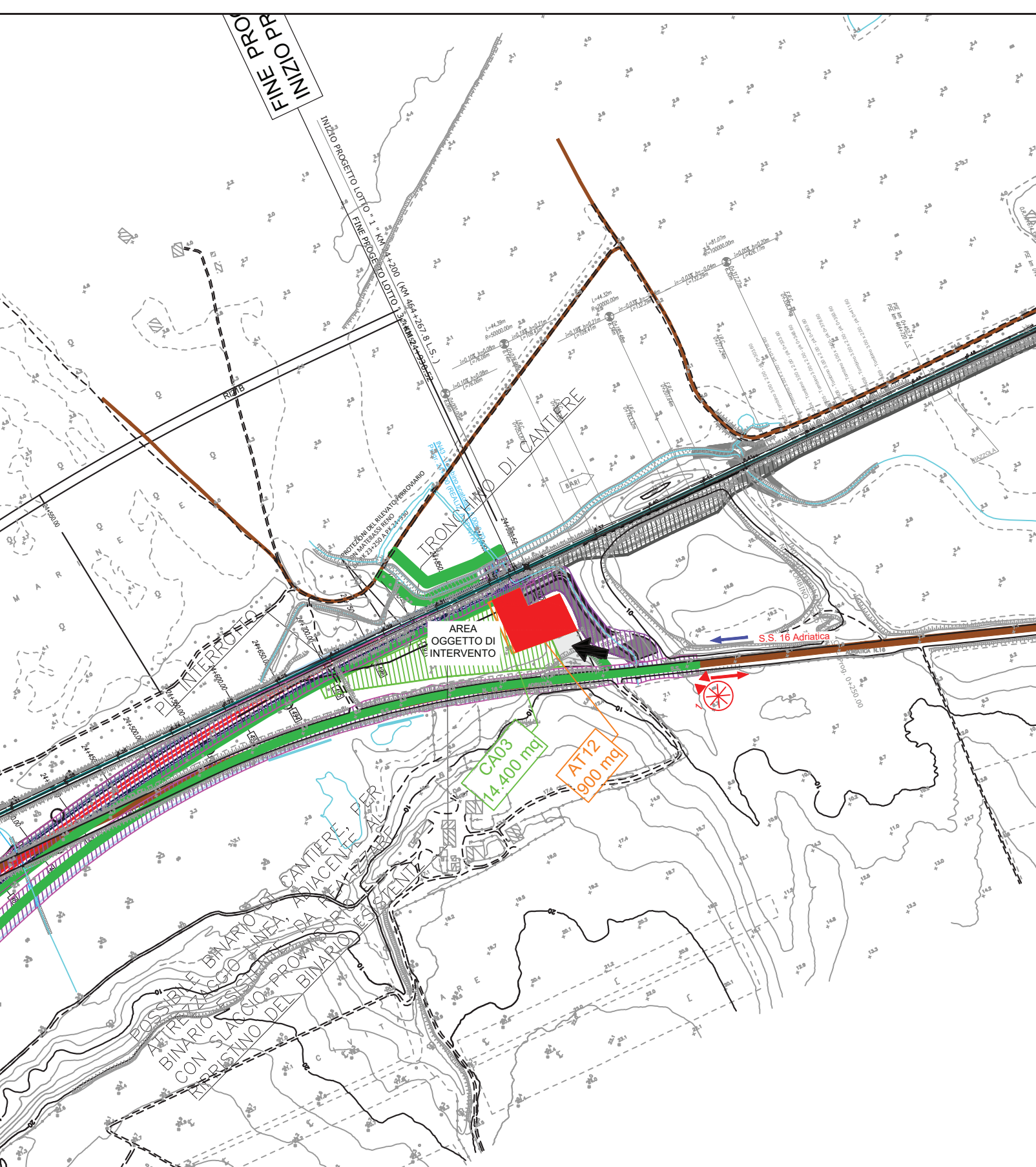
PLANIMETRIA 1 : 5000