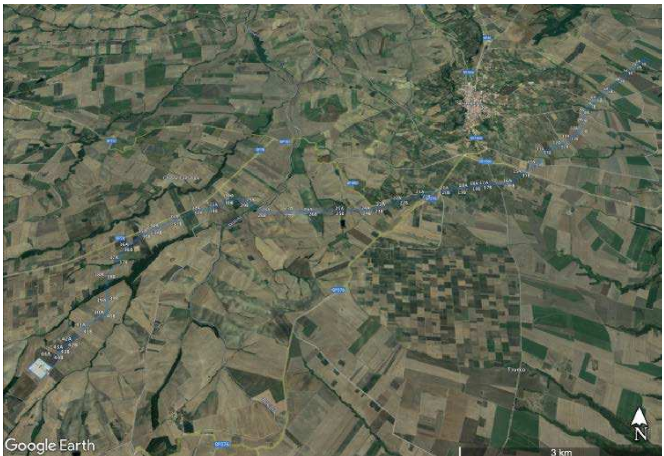
Figura 1 area realizzazione elettrodotti e relativa SE Serracapriola