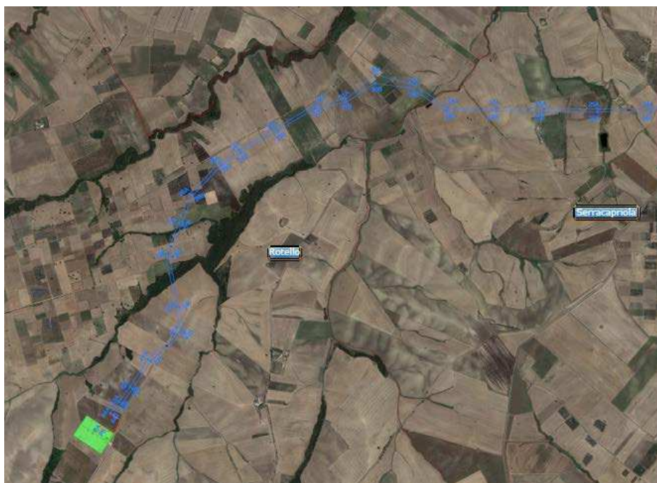
Figura 3 elettrodotto e SE Rotello esistente in area comune Rotello