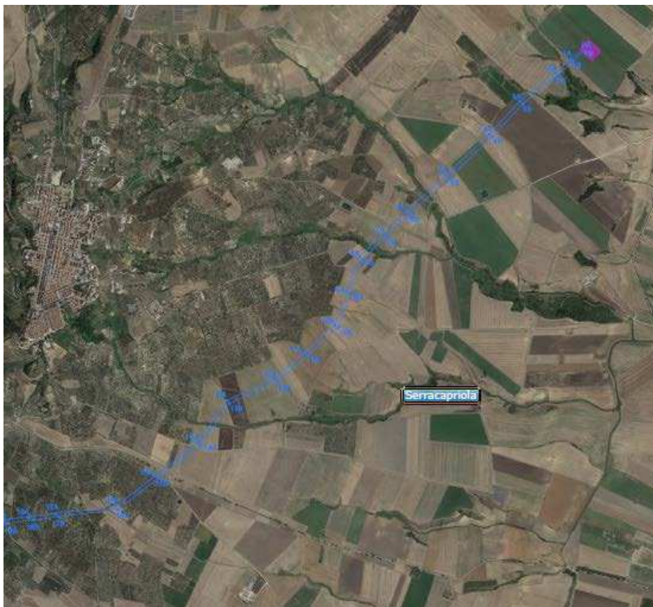
Figura 2 elettrodotto e nuova SE Serracapriola in area comune Serracapriola