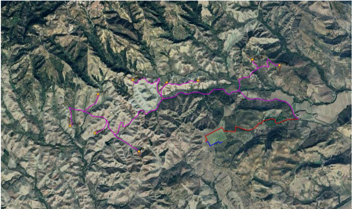
Figura 3 : Ubicazione dell'impianto eolico e delle opere di connessione su ortofoto