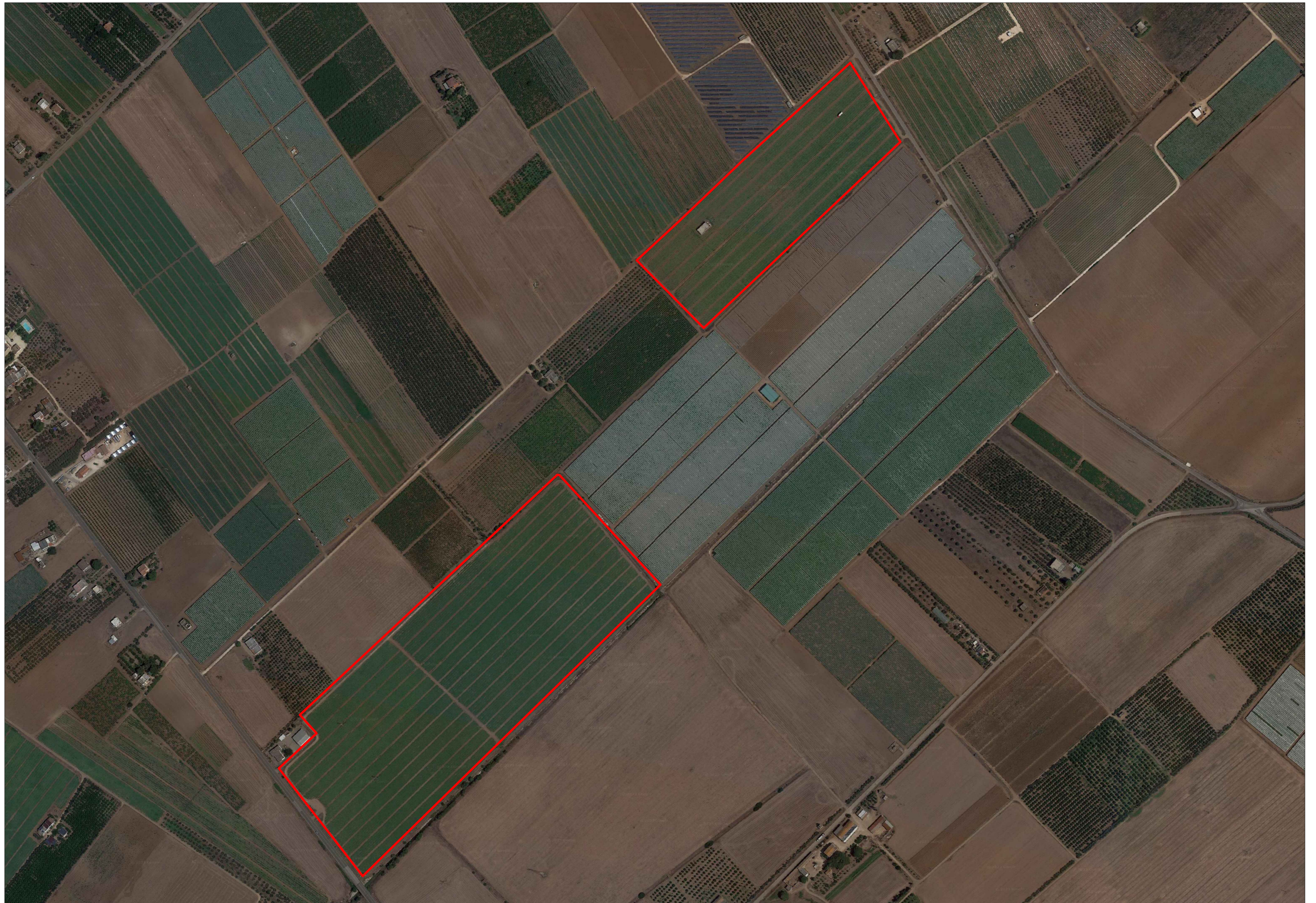
STRALCIO ORTOFOTO scala 1:4000