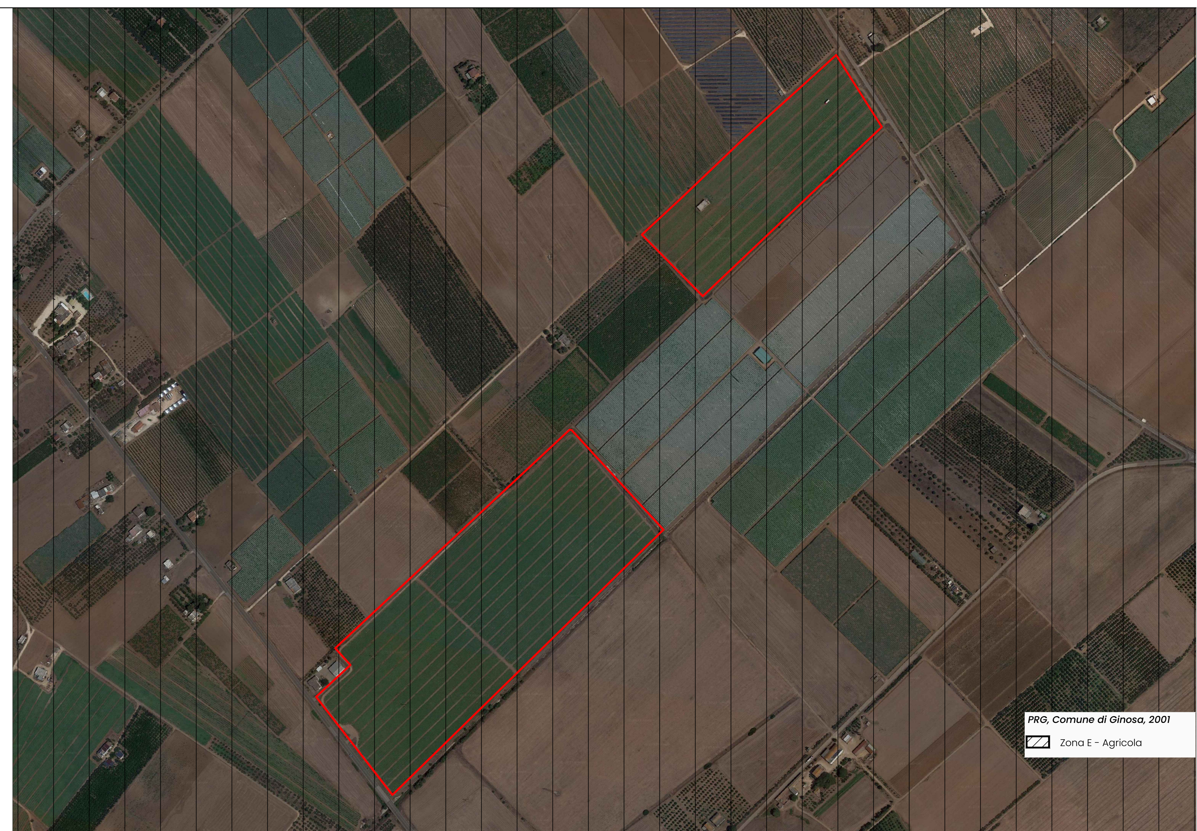
STRALCIO PRG, Comune di Ginosa scala 1:4000