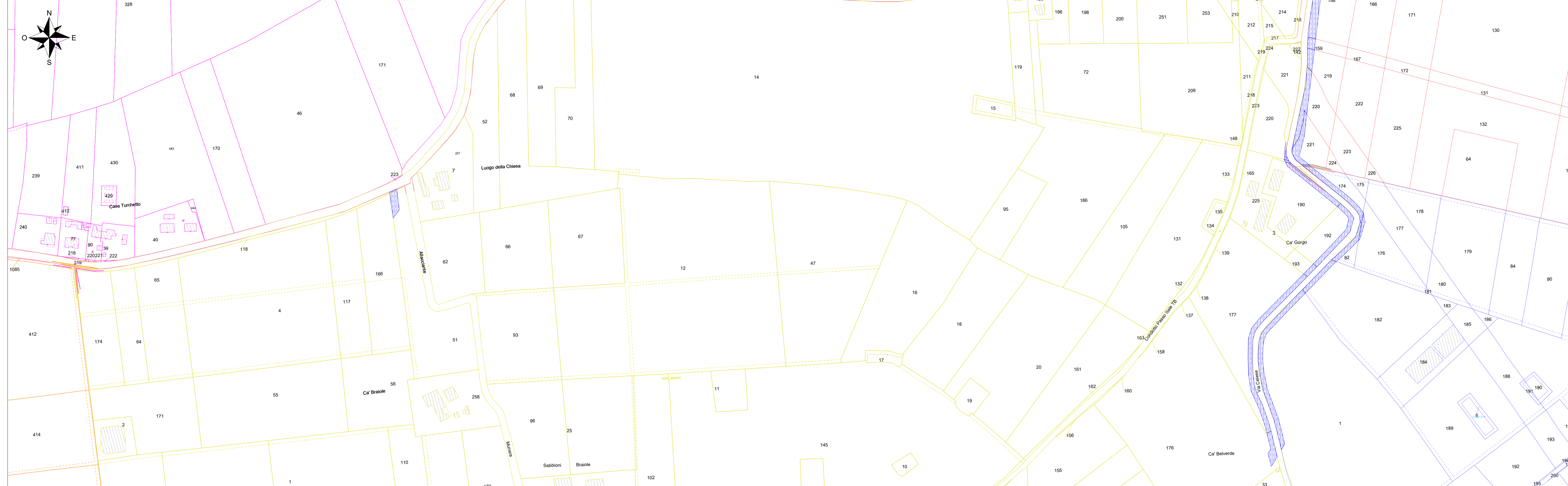
Inquadramento Vista B - Scala 1:2000